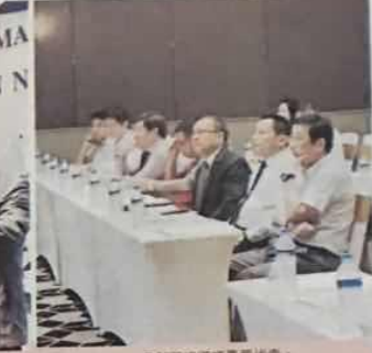
參加簽約儀式嘉賓代表。