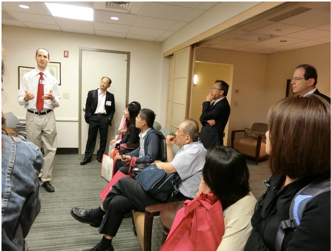
圖四、Tully health center 整合中心醫師講解整合醫療