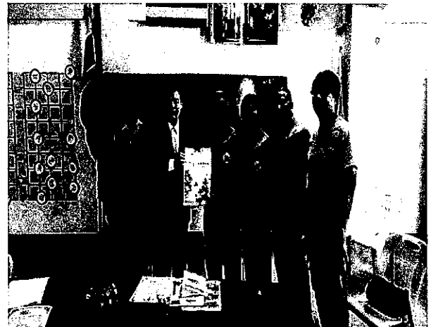
參訪泰北滿星疊大同中學並與該校校長、教師座談