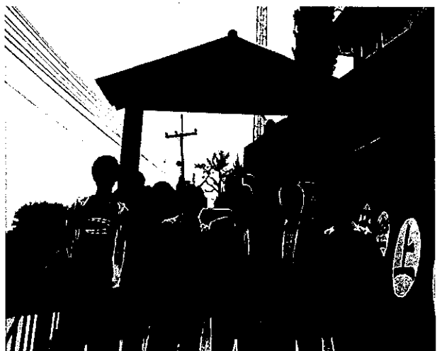
參觀漂排中興中學並與該校校長、教師座談