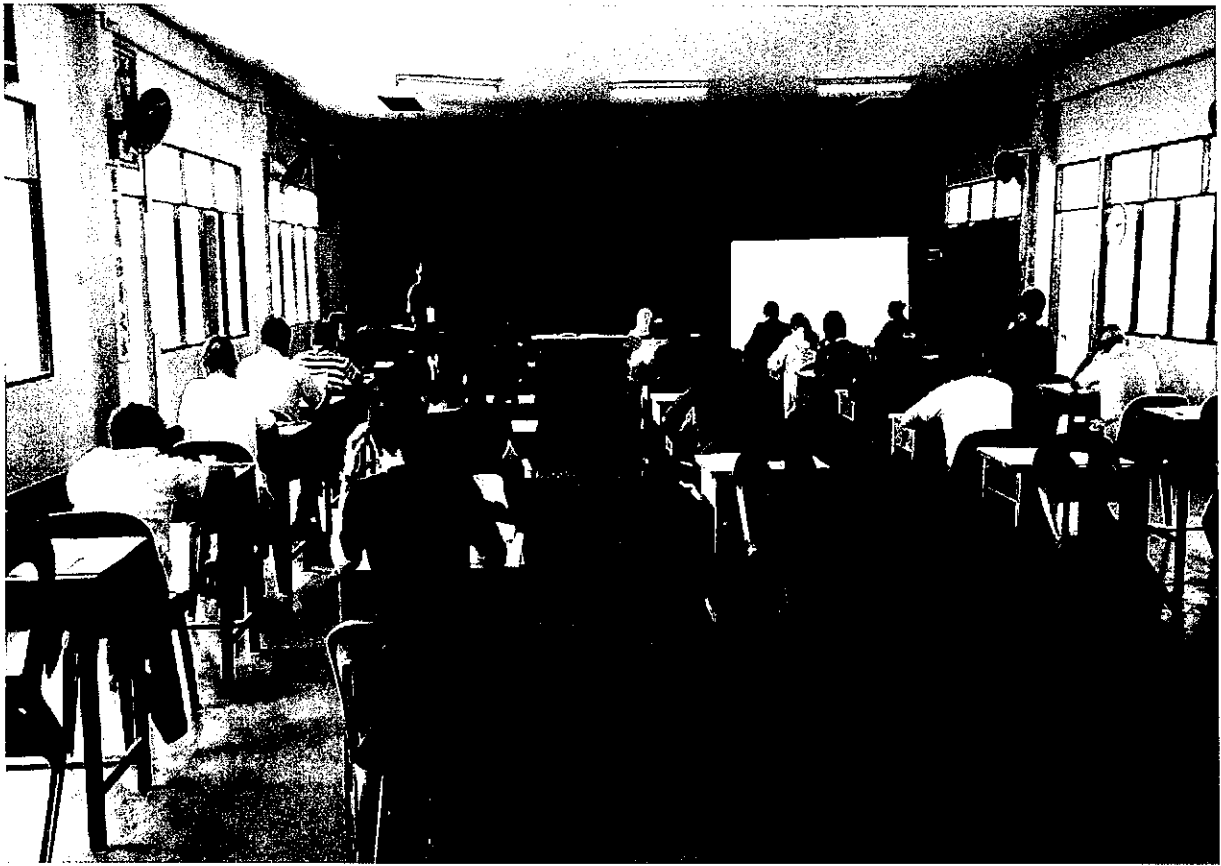
海外僑(華)校華語文教師檢定考試監考情形