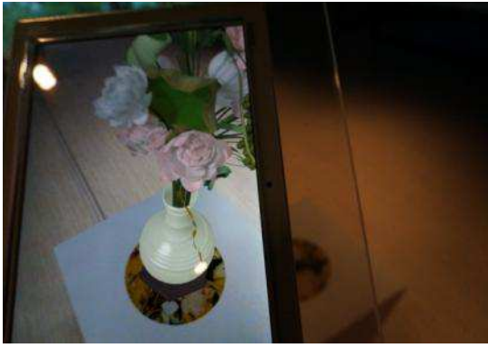
圖十四：「虛擬畫瓶花」

走進展間中段，策展團隊特別發揮巧思，保留一段透進自然光線的走道，望向窗外可欣賞九龍獅子山的風光景緻，與走道末端擺設郎世寧的《畫山水》兩相呼應，另外還有《畫白海青》、《白鷗圖》及《畫玉花鷹》(圖十六)，使現實與虛幻的自然景物因此產生連結與對話。