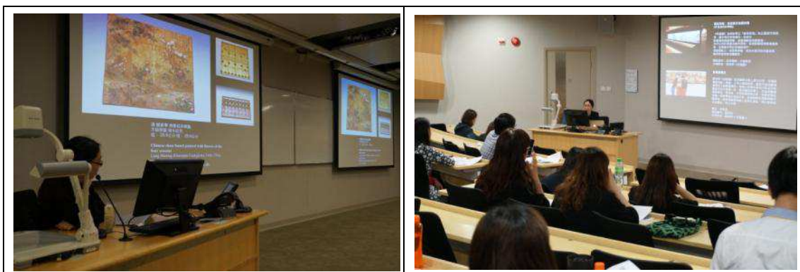
圖 2：本院同仁為導覽學員介紹展覽總說郎世寧生平、畫風及其複製畫展品

備運作是否正常，並清點致贈城大的複製畫及展覽畫冊。於初勘過程中，發現所展示複製畫有部分掛軸出現兩側外翻現象(圖 4)，經判斷恐因受潮關係外翻，將影響觀賞者參觀感受，請城大團隊協助處理固定；另「從郎世寧草圖看百駿圖」數位展件製作尚未完工(圖 5)，其草圖 U 型背板業架置完成，惟有關使用者體驗時需要用到之平板和動作感測器間的調教作業皆尚未完工；「百駿圖畫室」數位展件未完工(圖 6)，螢幕可以正常播映百駿圖影像，唯獨相關的連動繪畫平板尚未安裝完畢，細部調教作業亦尚未處理；「加配音效的銅版畫」數位展件未完工(圖 7)，雷射雕刻銅板尚未黏著於展板上；放映室部分未完工，螢幕可播映相關影片，為三部影片聲音干擾情況尚未解決，其餘數位展件則已大致完成，現場除部分數位展件未完成外，展作品名卡未貼，展場部分細部木工作業亦須修整。待初勘完畢，約於晚間 8 時離開展間後，沿途檢視城大校園內和周圍地區展覽宣傳看板的建佈情況，當日已完成城大通往港鐵九龍塘站通道兩側大型看板，以及 LED 螢幕輪播藝域漫遊展覽宣傳片(圖 8)。