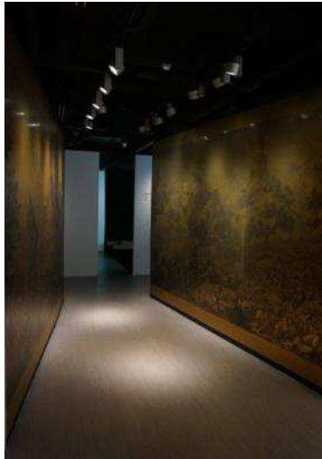
圖十七:「加配音效的銅版畫」