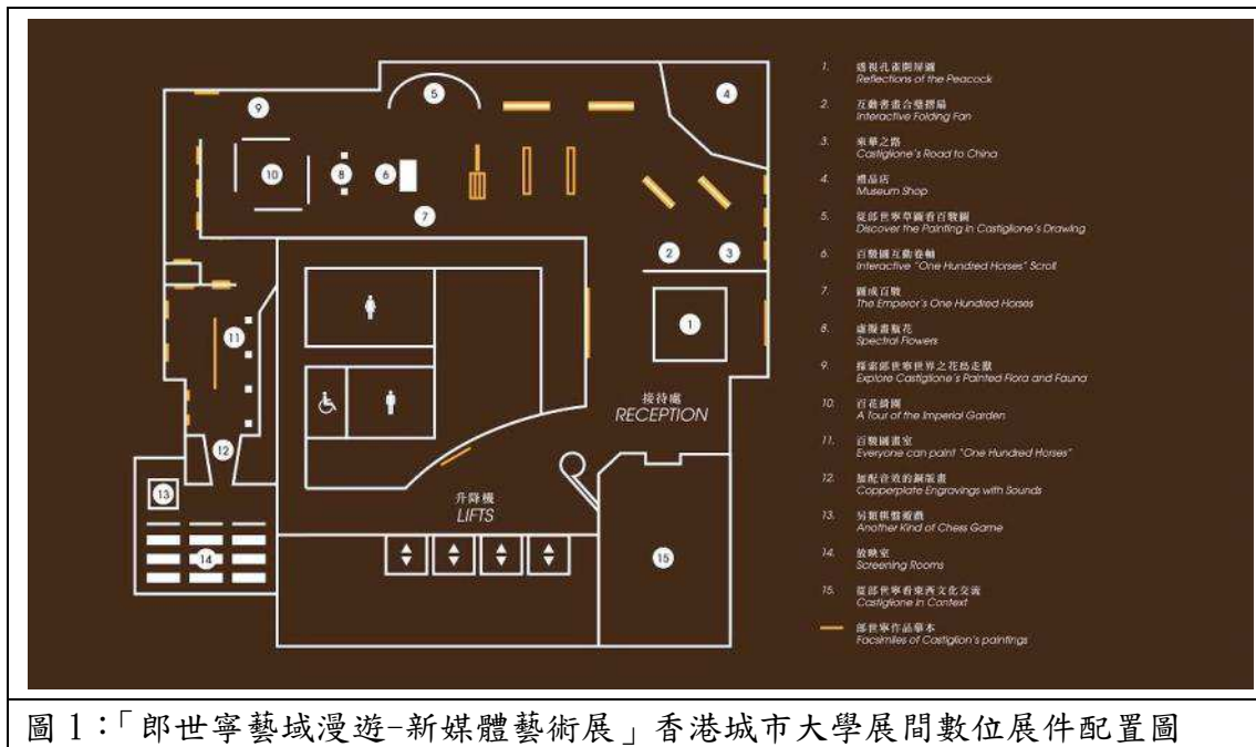
圖 1：「郎世寧藝域漫遊-新媒體藝術展」香港城市大學展間數位展件配置圖

路：三百年回望郎世寧·八千里路雲和月」、「百花綺園：仙萼長春新媒體藝術裝置」、「圖成百駿：新媒體百駿圖動畫」、「國寶神獸闖天關」動畫片、「銅版記功：郎世寧與乾隆得勝圖銅版畫」紀錄片，以及由城大邵志飛教授團隊製作之「透視孔雀開屏圖」、「互動書畫合璧摺扇」、「從郎世寧草圖看百駿圖」、「百駿圖互動卷軸」、「虛擬畫瓶花」、「另類棋盤遊戲」、「探索郎世寧世界之花鳥走獸」、「加配音效的銅版畫」、「百駿圖畫室」，相關數位展件配置圖如圖 1。