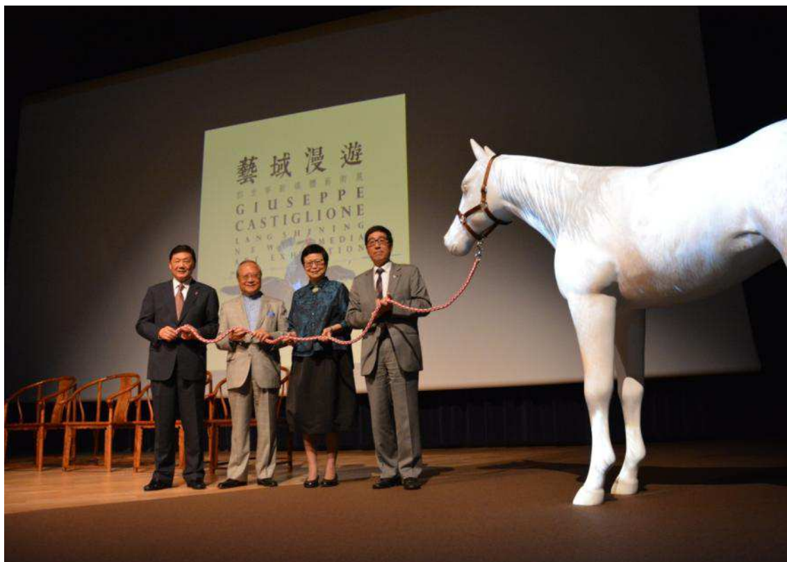
圖十九：主禮貴賓於展覽開幕式典禮合影，左至右分別為香港城市大學校董會胡曉明主席、香港城市大學梁乃鵬副監督、國立故宮博物院馮明珠院長，及香港城市大學郭位校長。