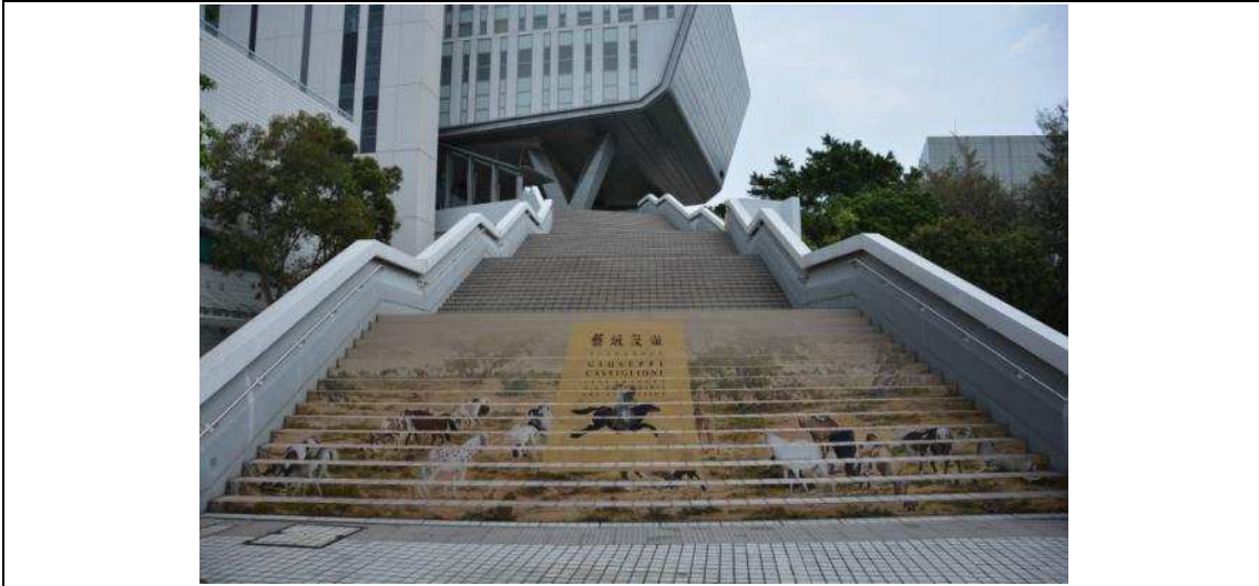
圖 19：學術樓(三)主要入口處樓梯上的主視覺佈置