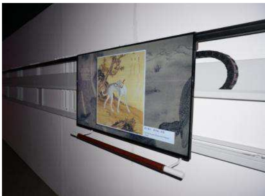
圖十三：「探索郎世寧世界之花鳥走獸」