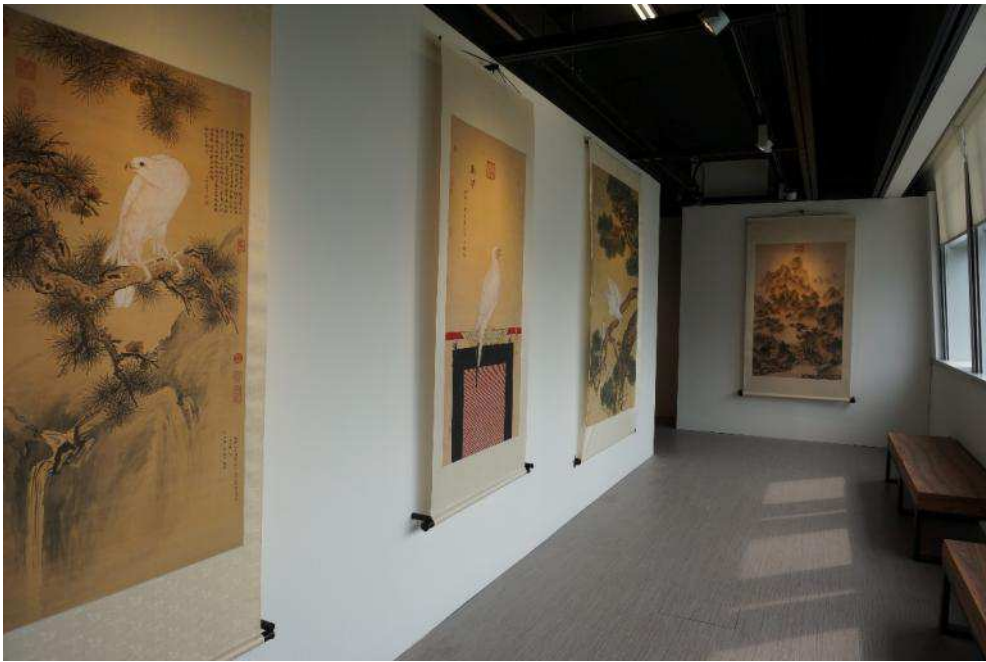
圖十六：由左至右分別為《白鷗圖》、《畫玉花鷹》、《畫白海青》以及《畫山水》

走進展間中段，策展團隊特別發揮巧思，保留一段透進自然光線的走道，望向窗外可欣賞九龍獅子山的風光景緻，與走道末端擺設郎世寧的《畫山水》兩相呼應，另外還有《畫白海青》、《白鷗圖》及《畫玉花鷹》(圖十六)，使現實與虛幻的自然景物因此產生連結與對話。