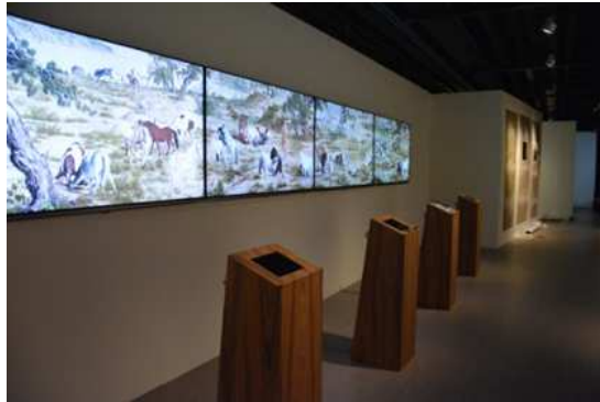
圖 6：「百駿圖畫室」數位展件未完工