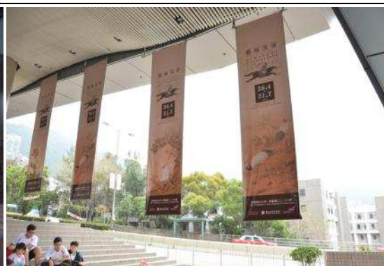
圖 16：展覽宣傳縱向旗幟