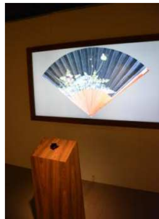
圖十五：「互動書畫合璧摺扇」