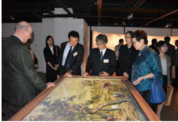
圖九：「百駿圖互動卷軸」