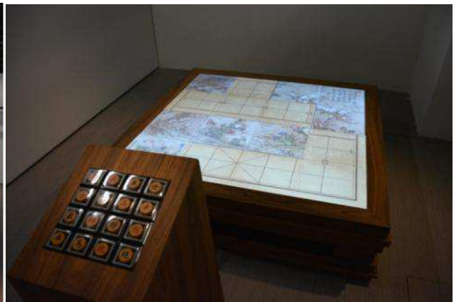
圖十二：「另類棋盤遊戲」