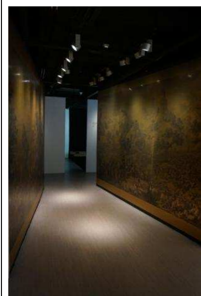
圖 13：「加配音效的銅版畫」左右兩側印刷銅版佈建完成