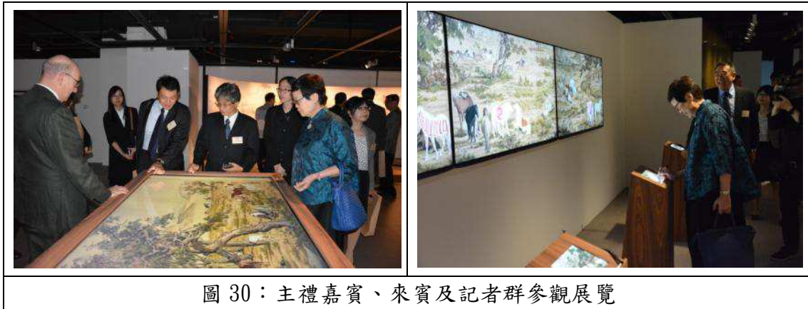
圖 30：主禮嘉賓、來賓及記者群參觀展覽