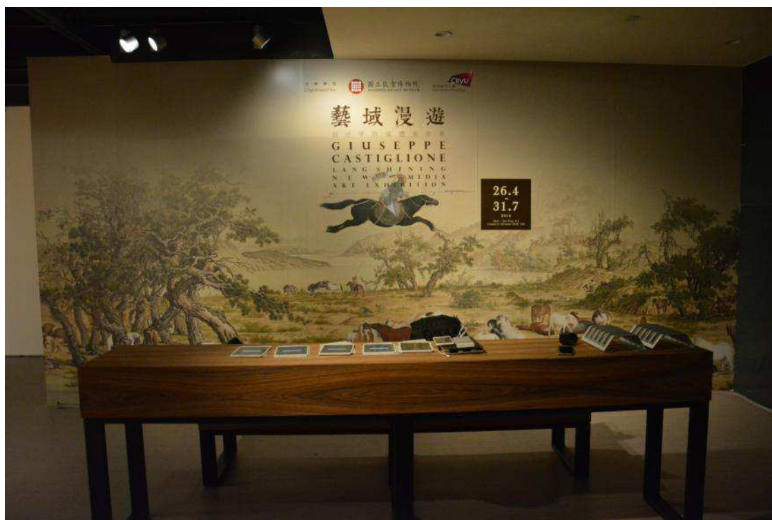
圖一：展覽情境與本院意象

「藝域漫遊—郎世寧新媒體藝術展」由國立故宮博物院與香港城市大學聯手舉辦，是故宮與城大繼2015年「同安·潮—新媒體藝術展—同安船與張保仔的故事」後第二次攜手合作，郎世寧新媒體藝術作品除曾遠赴義大利佛羅倫斯展出，也曾配合故宮90週年院慶「神筆丹青—郎世寧來華三百年」特展共同推出。今年4月26日至7月31日在香港城市大學學術樓(三)18樓(圖一)，觀眾們可欣賞到更精采豐富的展件，包括郎世寧畫作高仿真摹本、新媒體藝術作品，及創新互動裝置。