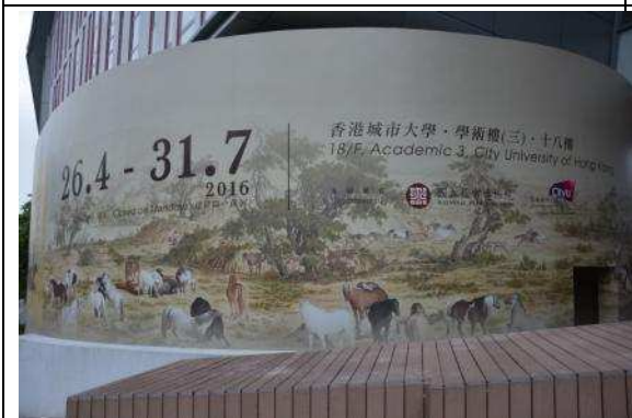
圖 15：巨型弧面的宣傳看板