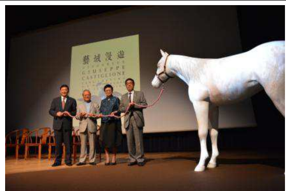
圖 29：主禮嘉賓於開幕式舞台合影