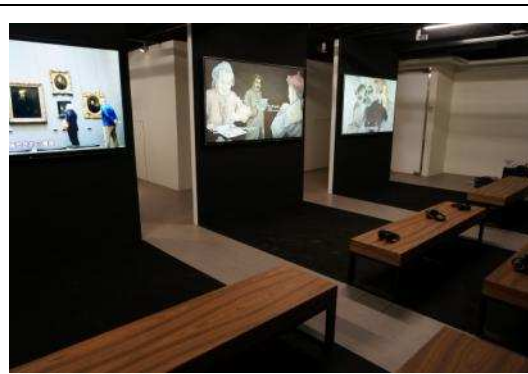
圖 12：「銅版記功」紀錄片的座位上加裝藍芽耳機