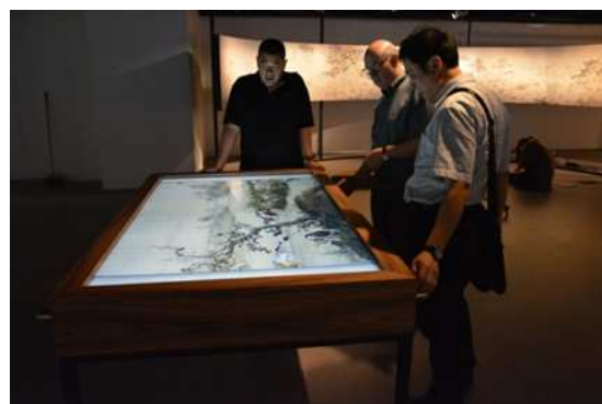
圖 14：邵教授為本院同仁進行數位展件說明