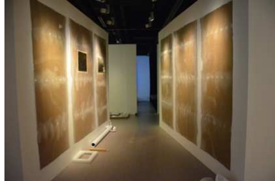
圖 7：「加配音效的銅版畫」數位展件未完工