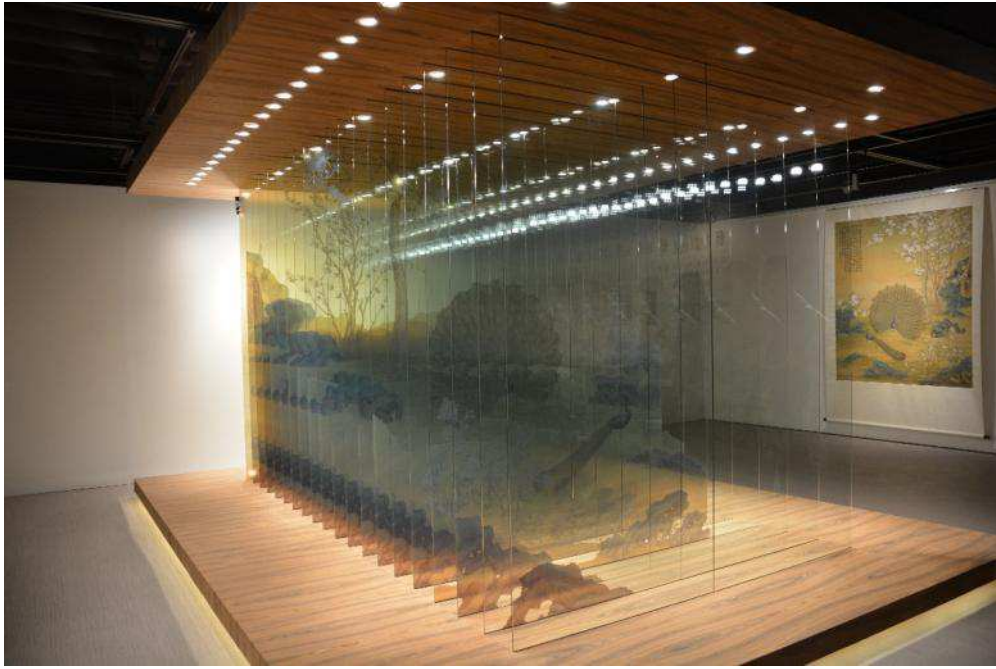
圖六：「透視孔雀開屏圖」與《畫孔雀開屏》

本次展覽的焦點是由《百駿圖》為創作靈感衍生的一系列新媒體作品，「從郎世寧草圖看百駿圖」(圖七)邀請觀眾透過 iPad 視窗，比較草圖與成品之間有趣的差異；「圖成百駿」(圖八)想像清朝皇家牧馬場的一日光景，和一百匹駿馬在草地上或遊戲、或休息的活潑姿態；「百駿圖互動卷軸」(圖九)模擬欣賞中國傳統卷軸的方式，請觀眾由右至左一段段仔細觀賞百駿圖的故事；「百駿圖畫室」(圖十)則邀請參觀者挑選自己喜愛的馬匹為之著色，讓屬於自己的馬匹躍入郎世寧畫中。