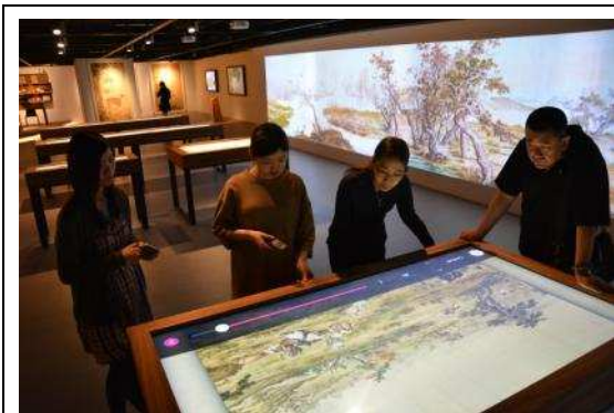
圖 11：調整「百駿圖互動卷軸」螢幕亮度