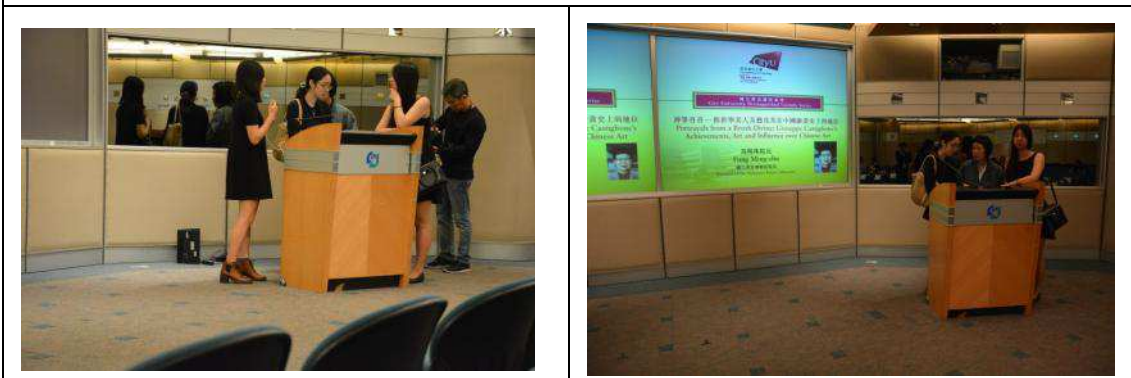
圖 23：講座現場音控調整及英文口譯校稿