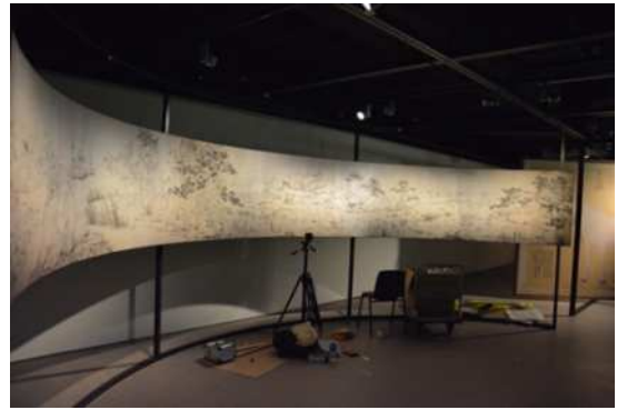
圖 5：「從郎世寧草圖看百駿圖」未完工