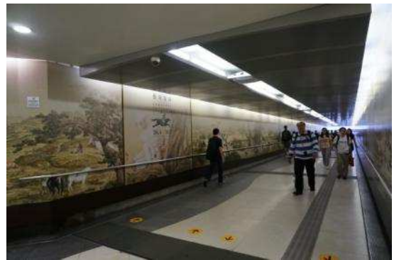
圖 8：港鐵九龍塘站通道兩側大型看板及 LED 螢幕輪播宣傳