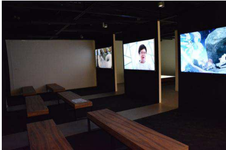
圖十八:影片放映室

2015年，由故宮團隊、臺灣優秀新媒體藝術家及香港城市大學創意媒體團隊共同製作的第一場「藝域漫遊—郎世寧新媒體藝術展」，在今年2016美國第49屆休士頓影展，奪得首獎金像獎及新媒體互動成人專業類白金像獎，本次在城市大學播出的兩部4K影片也分別榮獲該影展影片動畫類銀牌獎和影片製作類銅牌獎，成果輝煌。本院馮明珠院長與城市大學郭位校長皆在開幕典禮上強調，為成功舉辦本次展覽，除需仰賴「硬體」，即新科技載具；「軟體」，即策展團隊的創新能力和嚴謹考究態度；還有「心件」，即郎世寧珍貴的傳世作品，但更重要的是決策者推廣教育的心，以及籌備團隊盡責工作的態度。本此展覽精彩演繹郎世寧畫跨越東西方美學的不凡成就，是科技與人文藝術跨界組合的典範，同時更是臺灣與香港文化交流的重要里程碑。