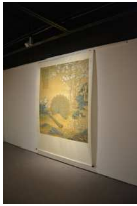
圖 4：掛軸複製畫兩側外翻情形