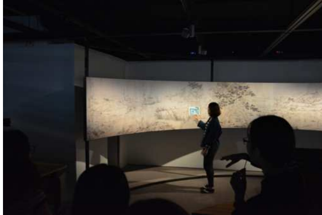
圖 10：工作團隊展示「從郎世寧草圖看百駿圖」展件予課程導覽學員