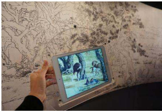
圖七：「從郎世寧草圖看百駿圖」

本次展覽的焦點是由《百駿圖》為創作靈感衍生的一系列新媒體作品，「從郎世寧草圖看百駿圖」(圖七)邀請觀眾透過 iPad 視窗，比較草圖與成品之間有趣的差異；「圖成百駿」(圖八)想像清朝皇家牧馬場的一日光景，和一百匹駿馬在草地上或遊戲、或休息的活潑姿態；「百駿圖互動卷軸」(圖九)模擬欣賞中國傳統卷軸的方式，請觀眾由右至左一段段仔細觀賞百駿圖的故事；「百駿圖畫室」(圖十)則邀請參觀者挑選自己喜愛的馬匹為之著色，讓屬於自己的馬匹躍入郎世寧畫中。