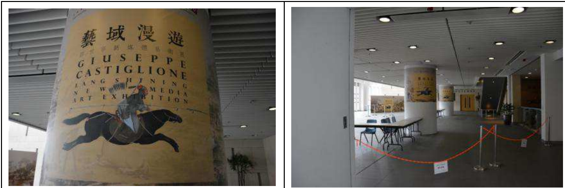
圖 22：開幕典禮門口佈置