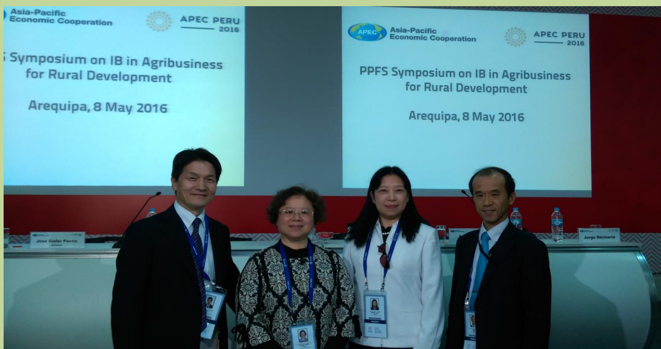
出席「除貧之包容性農企業研討會」我團代表與日本農林水產省主辦官員合影。