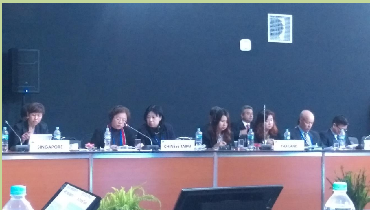
我團出席「PPFS 大會」情形。