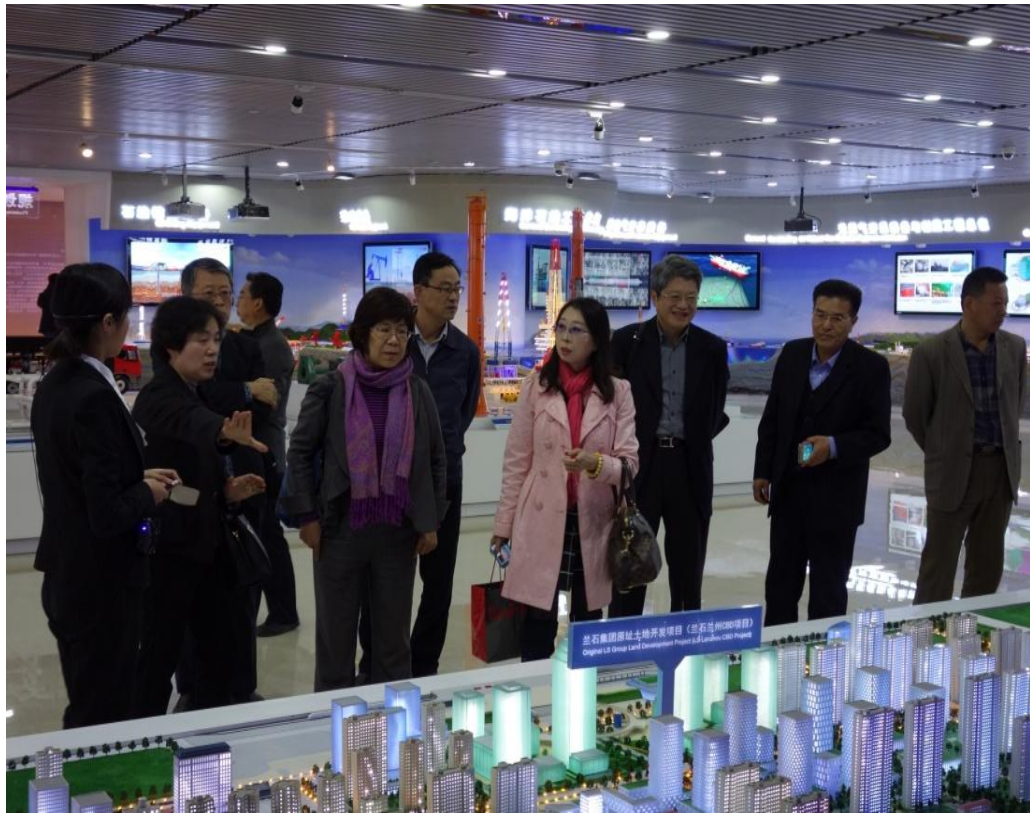
經貿團團員參訪蘭州新區蘭石集團