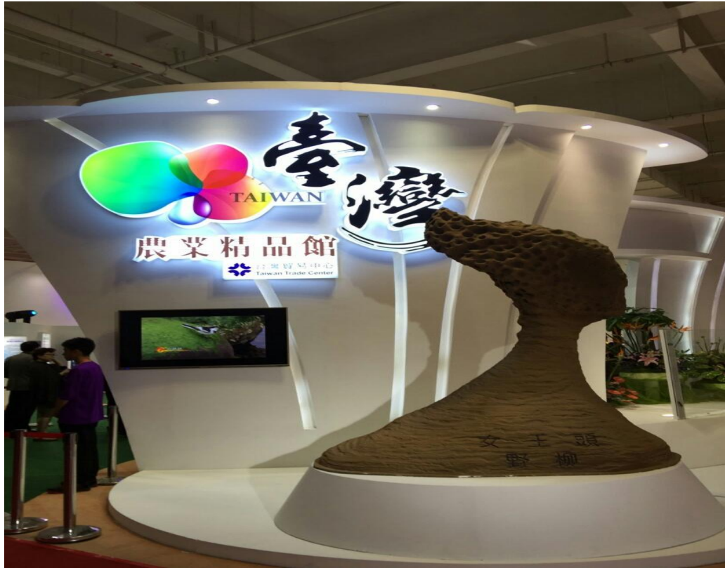
臺灣名品博覽會展場