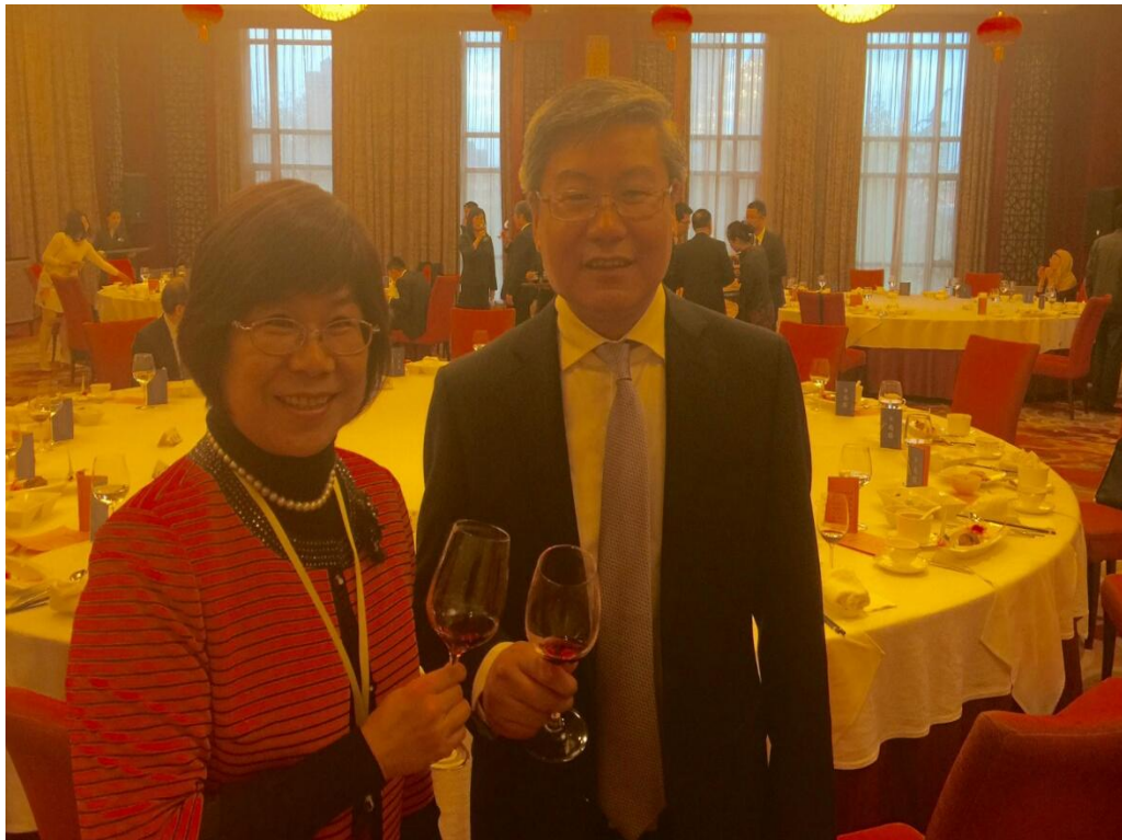
陸方歡迎晚宴 與甘肅省副省長李榮燦合影

會晤後，由貿促會假寧臥庄賓館 2 樓大宴會廳舉行歡迎晚宴，梁董事長代表及經貿團團員感謝甘肅省此次攜手辦理台灣名品博覽會，雙方會談甚歡，期盼未來有機會繼續交流。