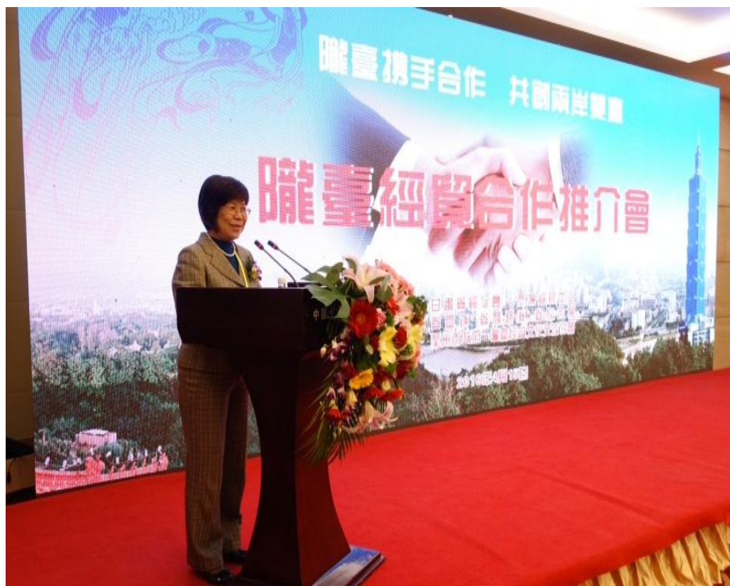
隴臺經貿合作推介會中發表致詞

本行則代表經貿團介紹本次名品展的特色及本行融資貸款、輸出入保險等業務，期許透過這樣大型的經貿活動，創造一個服務平台，使雙方企業互動，深入瞭解交流機會，進而推動兩岸合作契機，共創商機。