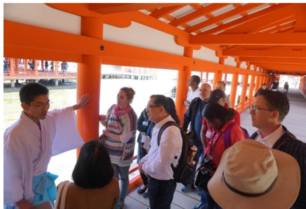
圖 12. 嚴島神社神職人員解說保存、管理方式 1

嚴島神社最著名的就是位於海上的大鳥居。鳥居是用於區分神界與人類居住俗界的標誌，是神社的大門。嚴島神社的第一個大鳥居創建於1168年，建立在距海岸線200米處的海水中，建