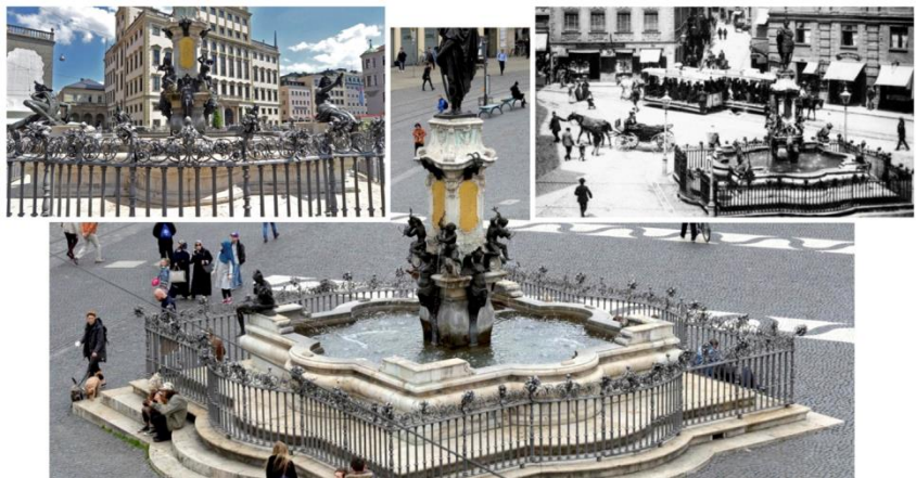
圖 19. 德國奧格斯堡之以藝術雕塑裝飾整體分流系統