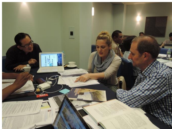
圖 14.講師與學員討論研究案例之登錄理由

4 月 22 日當天上午，主辦單位 UNITAR 安排 12 位參加學員以簡報發表研習成果。進行方式係將學員分成三組，每組擇選一位學員於報名當時所提供之研究案例撰寫提名文本，並由該位學員擔任小組長。每組報告時間 20 分鐘，每組組員必須參與事前討論、簡報製作與上台表。發表內容項目則參照主辦單位提供之提名格式。自 4 月 19 日下午起，所有學員及講師們即熱烈討論研究案例之登錄理由特點，並思考可比較分析的其他遺產物。