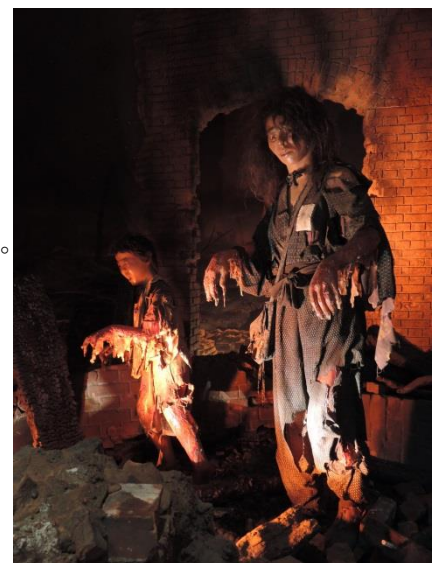
圖 7.廣島和平紀念資料館展示原子彈爆炸恐怖場景