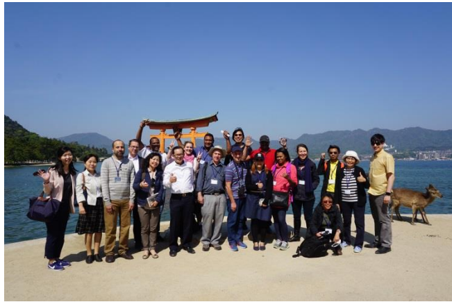
圖 13..以大鳥居當背景，大夥兒在嚴島神社拍團體照!

造材質為木材， 水面下的部分 使用不易腐爛、 樹齡約 500-600 年的楠木。據嚴 島神社的神職 人員表示，下方 的木材約每 100