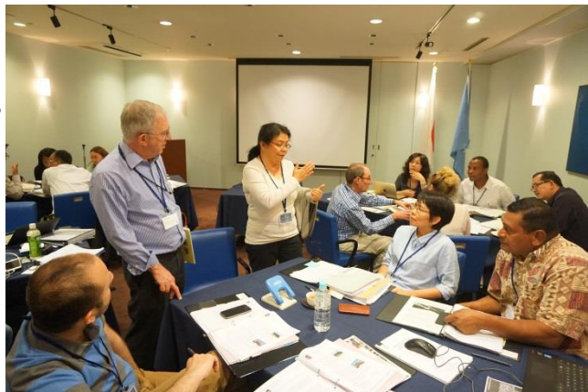
圖 20. 講師與學員討論互動密切

本次活動於講座課程中發送已登錄世界遺產之部分文本(約 40 頁)，請學員 2 人一組閱讀討論，每組所拿到的遺產文本不同，並於隔天課堂報告對該份文本的登錄準則及登錄理由讀後感想，予以分析。透過文本閱讀、解析思考，更對登錄理由的撰寫方向有所掌握。