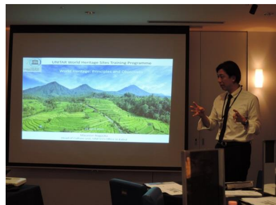
圖 1 Masanori NAGAOK 闡述世界遺產的意義

聯合國教科文組織(UNESCO)阿富汗喀布爾辦公室 文化部門主任 Masanori NAGAOK 先就世界遺產公約的內涵、世界遺產委員會、世遺中心及各世界遺產委員會的諮詢團體，以及申遺程序作一重點介紹。他強調，公約締約國申請登錄世界遺產的初衷應是維護保存具傑出普世價值的文化/自然遺產，並將之傳遞給下一世代，以締造永續發展為目的。因此，在準備世界遺產提名文本之時，必須思考：該遺產的管理維護計畫是否已就緒？其擬定的策略是否可行？是否已有研究調查記錄作為保存維護計畫之參考？這是非常重要的，唯有完善的保存維護計畫，該遺產的普世價值才得以延續。