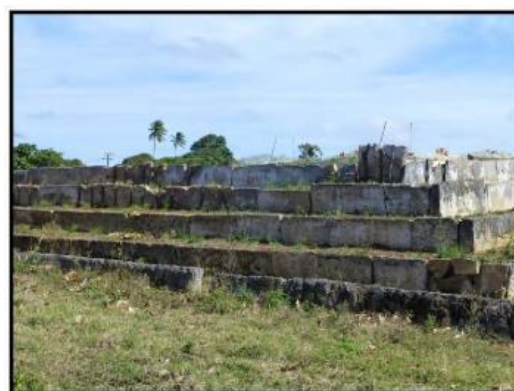
圖 16. 東加王國之文化遺址