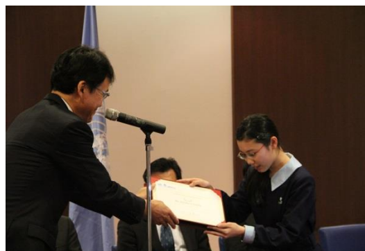
圖 21. UNITAR「和平青年大使」授證儀式

此外，4月21日下午安排所有學員出席見證二位UNITAR「和平青年大使」(UNITAR Youth Ambassador) 授證儀式。UNITAR的「和平青年大使」計畫 2 係提供廣島年輕學子認識、學習聯合國相關事務，包括出席UNITAR、日本外交部、聯合國東京辦公室等處舉辦之國際事務活動，行程遍及日本境內及國外。計畫經費主要來自廣島縣政府、廣島市政府、聯合國新聞中心、中國新聞社等單位。2位獲選的青年大使將代表廣島年輕學子們出席UNITAR在世界舉辦的重要國際事務活動，傳遞廣島世界和平的祈願。