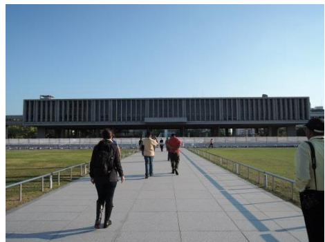
圖 9. 廣島和平紀念資料館外觀

此行同時參訪廣島和平紀念資料館，該館位於廣島和平紀念公園內。外觀成一直線的和平紀念資料館展示爆炸前和爆炸後廣島的實際歷史的照片、圖示板、動畫、全景立體模型；另也展示著犧牲者的遺留品和爆炸後的慘狀。廣島和平紀念資料館也是由設計廣島和平公園的丹下健三團體設計的。