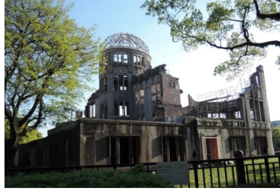
圖 8. 廣島原爆圓頂屋外觀

錄為世界遺產，廣島和平紀念公園呈現了全世界人們追求和平，最終全面銷毀核武器的願望。