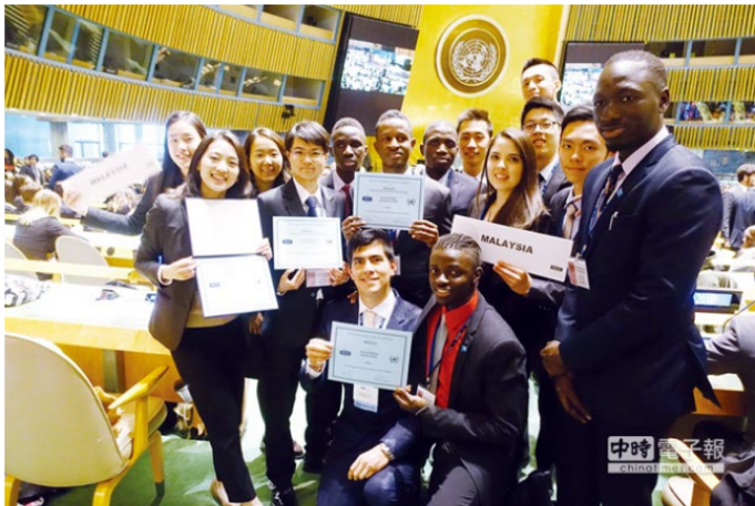
北科大代表隊創下台灣所有團隊參與模擬聯合國競賽歷年來最傲人成果。

分享至Facebook 分享至Google+ 分享至Twitter 分享至Weibo