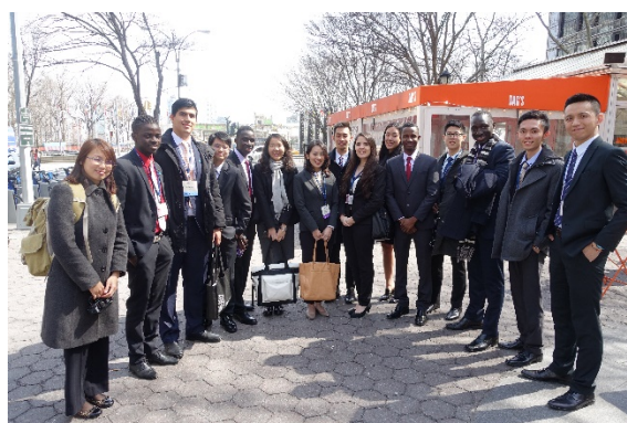
照片說明由左至右，上至下。圖一：GA1 最佳立場書獎。圖二：GA4 最佳立場書獎。圖三：本校榮獲之四大獎。圖四：本校團隊於紐約聯合國總部外合影。