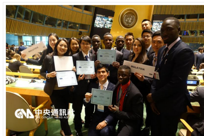
2016 模擬聯合國競賽日前在美國舉行，北科大團隊一舉拿下「代表團榮譽獎」、「安全理事會傑出代表獎」等 4 項大獎。 105 年 3 月 30 日

(中央社記者許秩維台北 30 日電) 2016 模擬聯合國競賽日前在美國舉行，北科大團隊一舉拿下「代表團榮譽獎」、「安全理事會傑出代表獎」等 4 項大獎，也是台灣團隊歷年參賽的最佳成績。