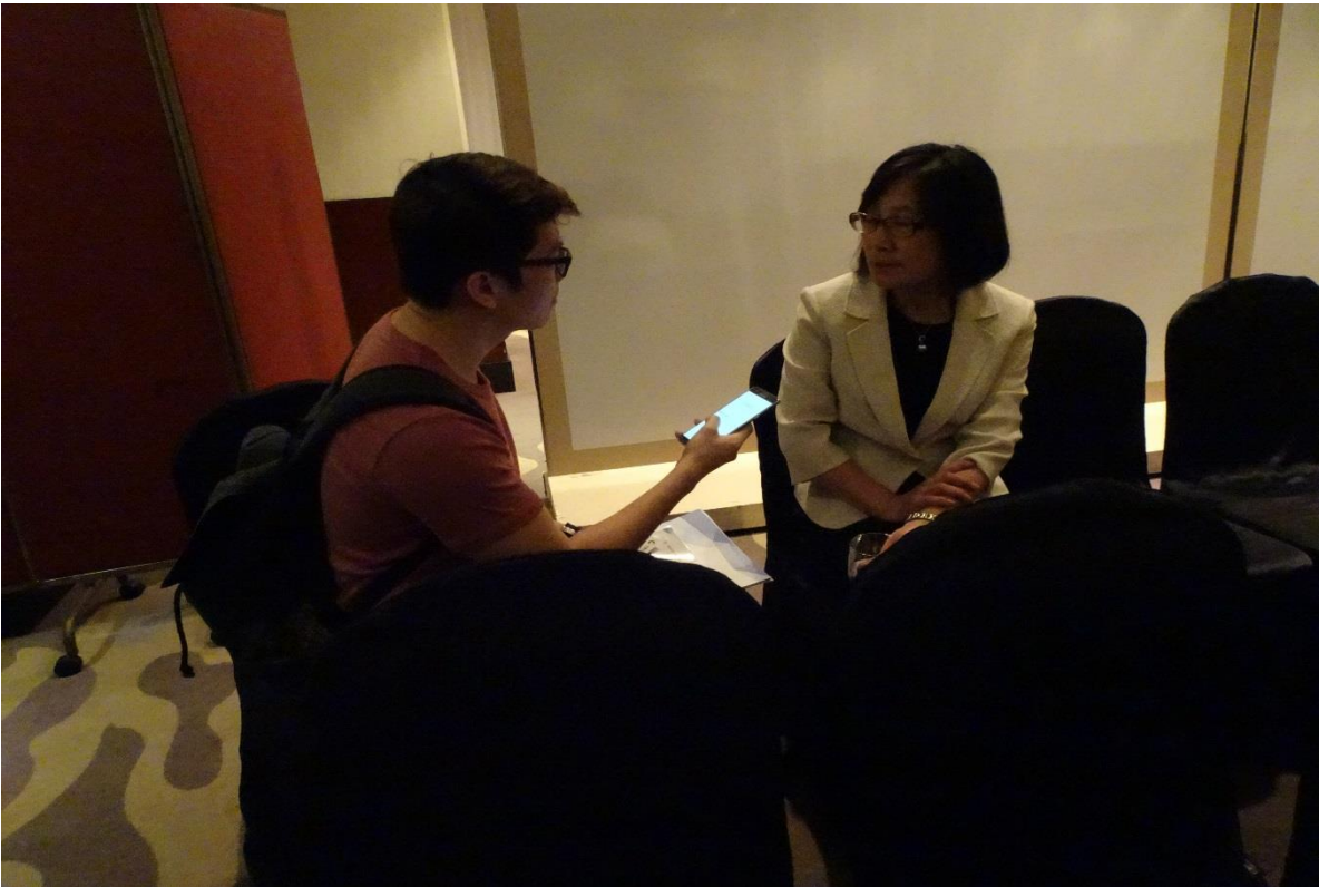
圖 8：本司於記者會後接受中央社駐馬來西亞特派員專訪