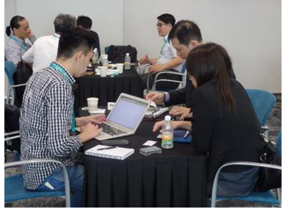
圖 5：與新加坡業者一對一商務媒合會洽商