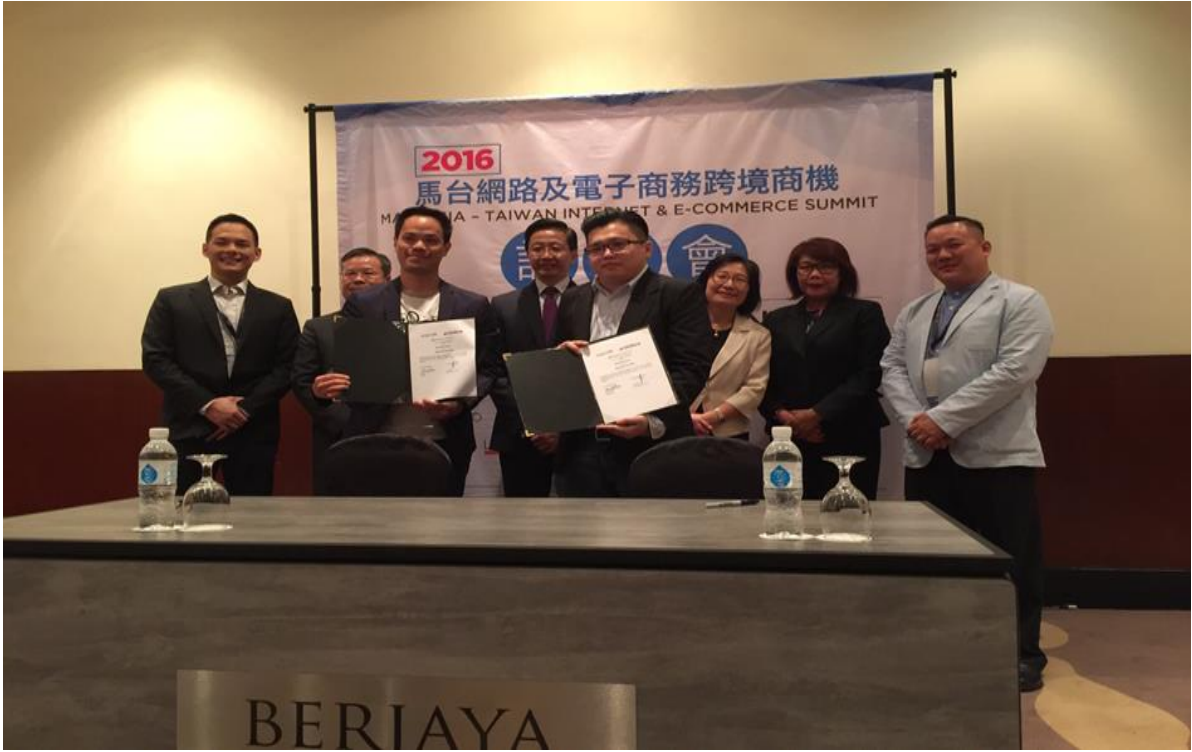
圖 7：為我國與馬來西亞業者簽署合作備忘錄