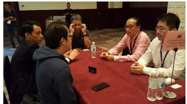
圖 6：於馬來西亞與當地業者進行一對一之媒合