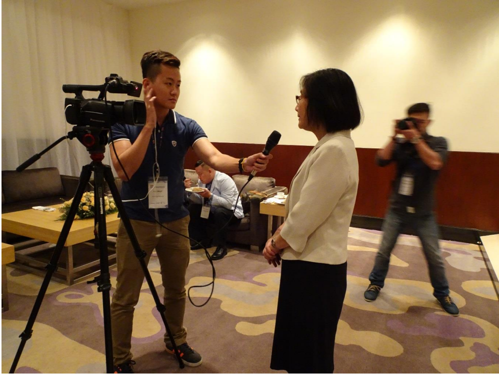
圖 9：本司於記者會後接受馬來西亞傳播媒體集團 FG MEDIA 專訪