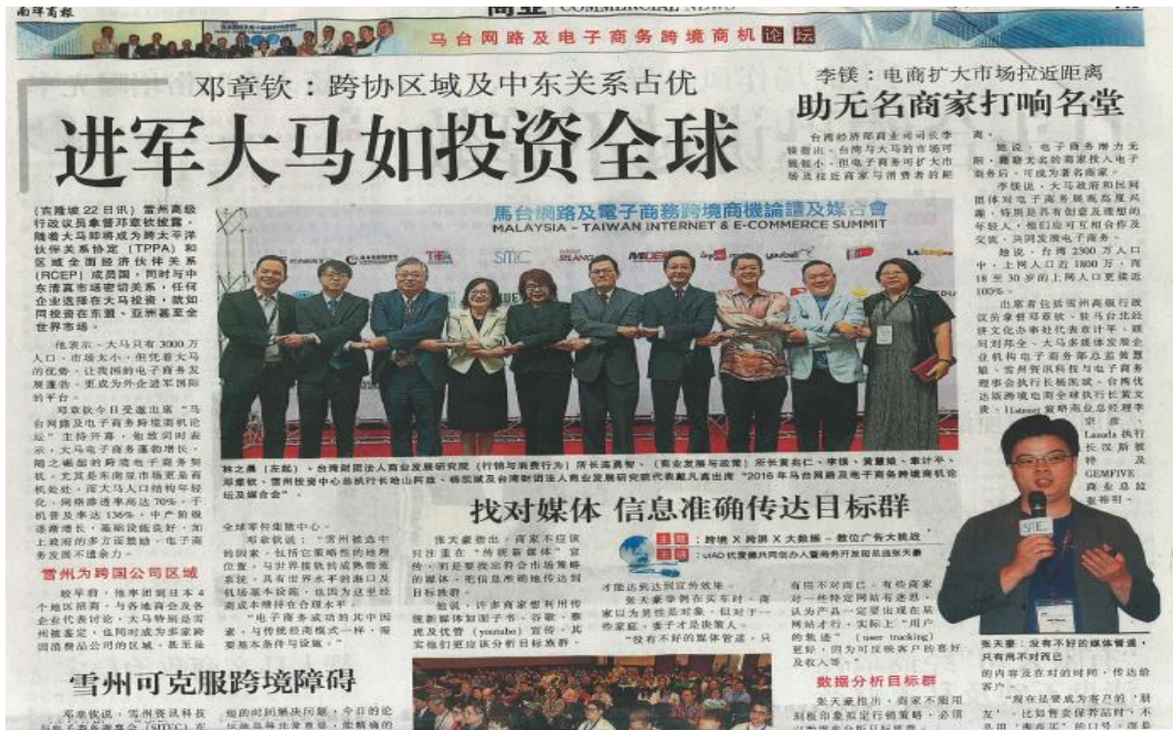
圖 10：馬來西亞媒體大幅版面報導