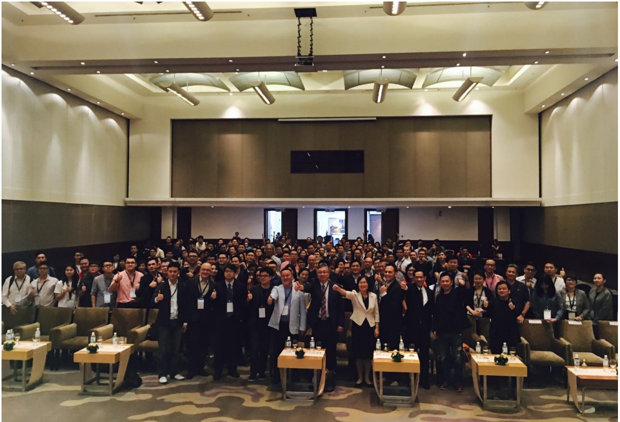
圖 11：本活動拓商團於臺馬網路及電子商務跨境商機論壇媒合會集體合影