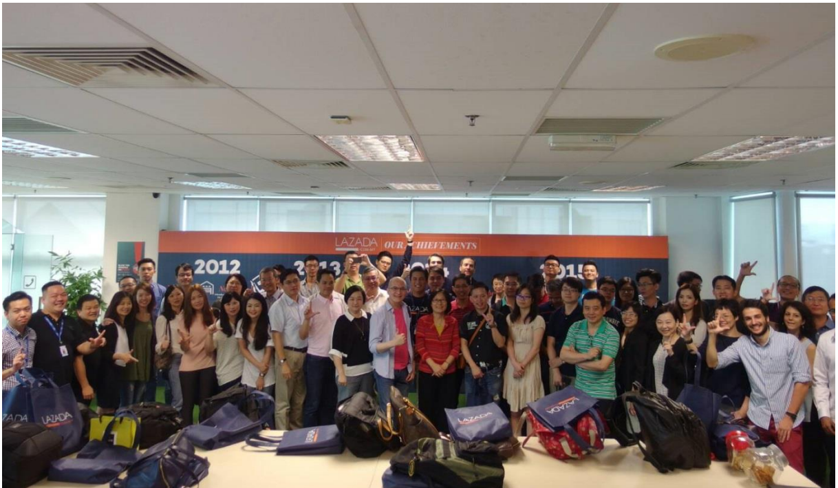
圖 12：拓商團團員於 Lazada 馬來西亞分部合影