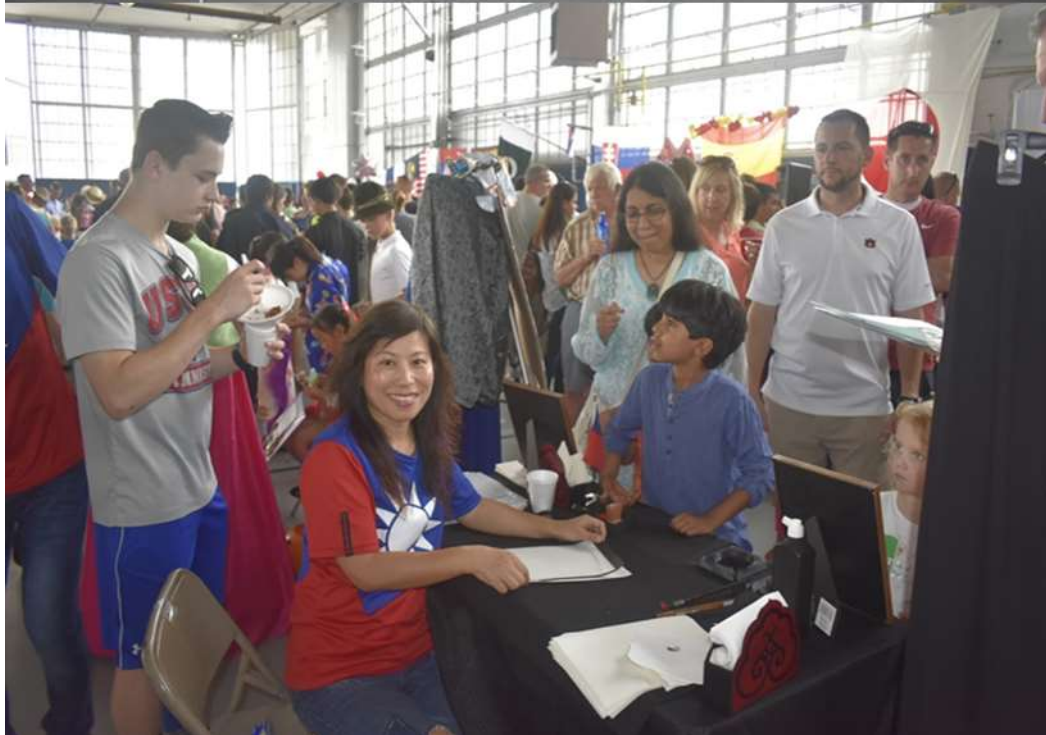
國際日活動(二)：臺灣美食與文化體驗