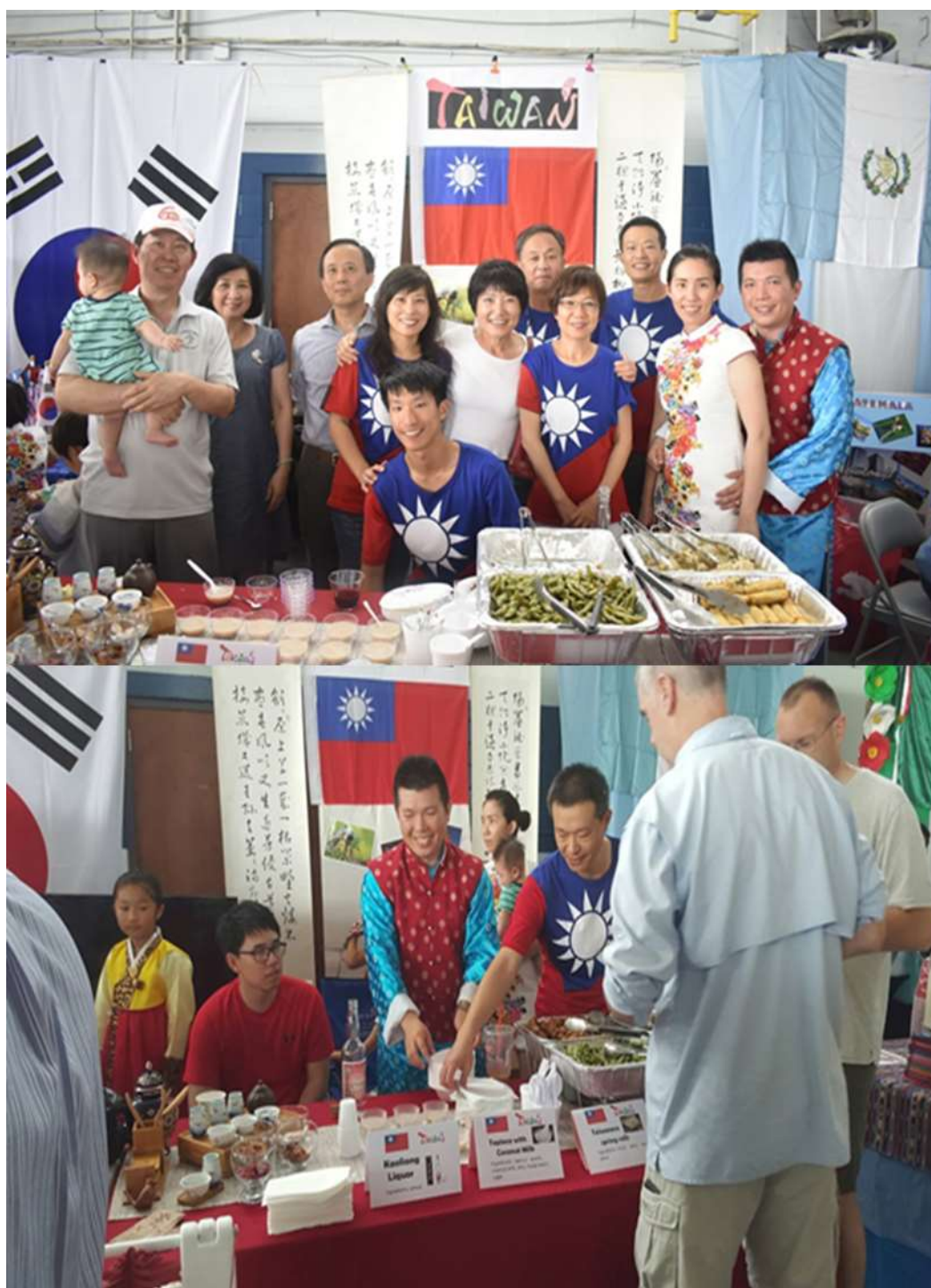
國際日活動(一)：臺灣美食與文化體驗