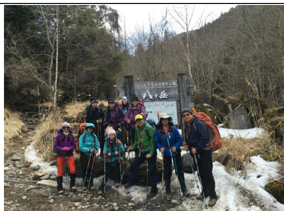
於八岳登山入口前合照