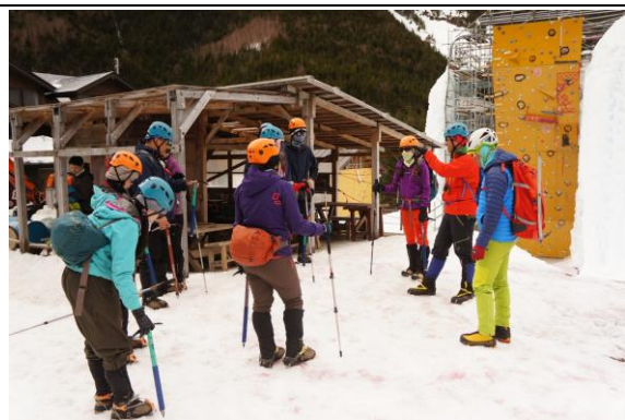
第二天，前往硫磺岳前，向學員叮嚀注意事項