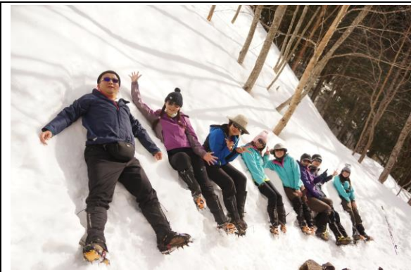
學員們開心的在雪中合照