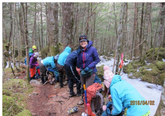
學員們準備穿著冰抓