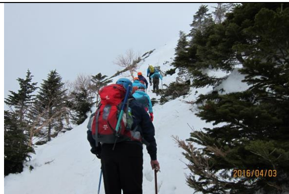
前往硫磺岳的路途