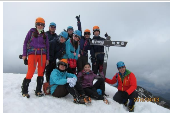
攀登至小山頭合照