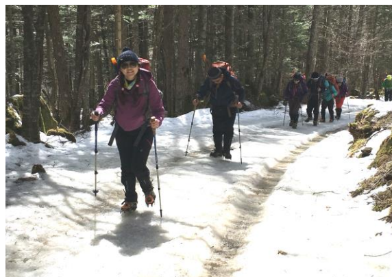
穿著冰抓後於結冰路面上行走