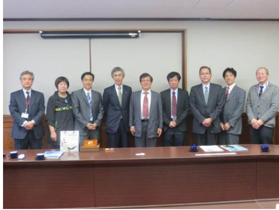
3/28 與福岡大學校長及其他師長合影