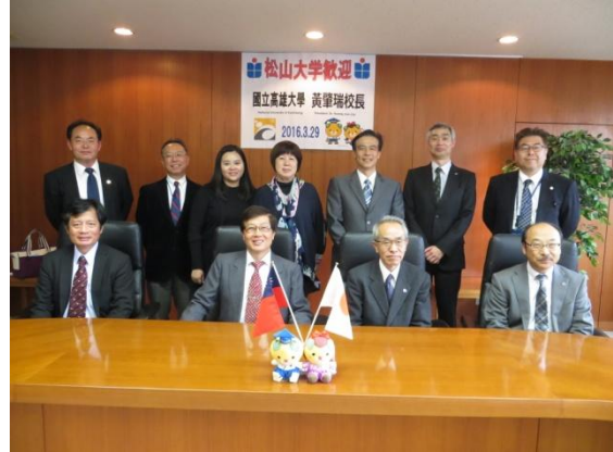
3/29 與松山大學校長及其他師長合影