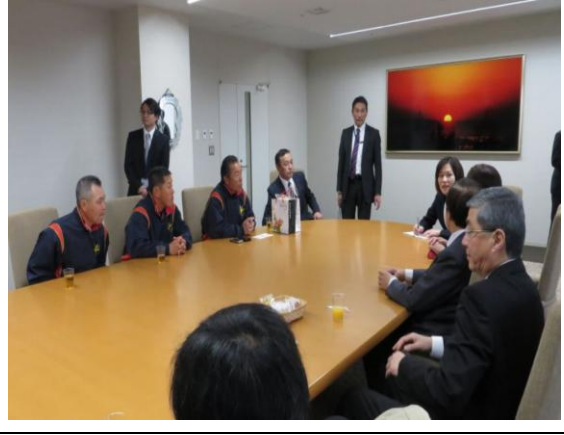
4/2 與創價大學野球教練群交流