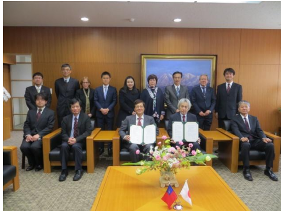
3/29 與愛媛大學續簽交換生協議