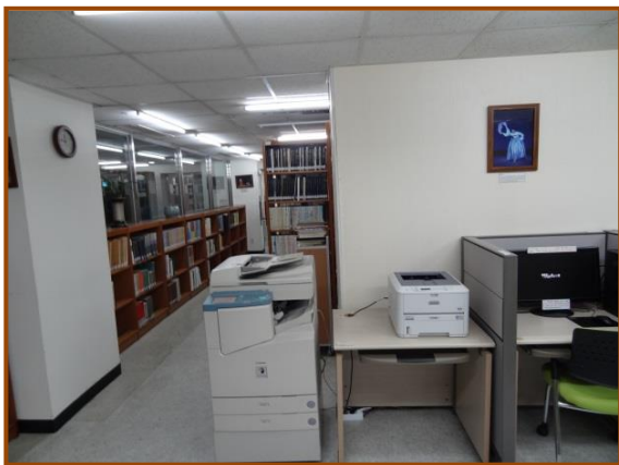
【圖 8】 韓國國立國樂院圖書館辦公區與藏書閱覽區 的廊道，如需使用影印機則要自備紙張。