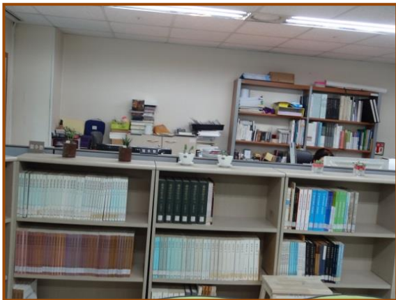
【圖 7】 韓國國立國樂院典藏書籍的隔間櫥櫃，將藏 書區與辦公室劃分二處。