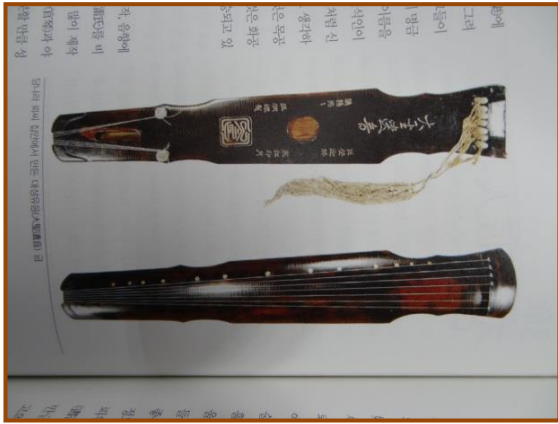
【圖 5】 韓國國立國樂院典藏書籍含有中國的音樂(古 琴)等相關資料一隅。