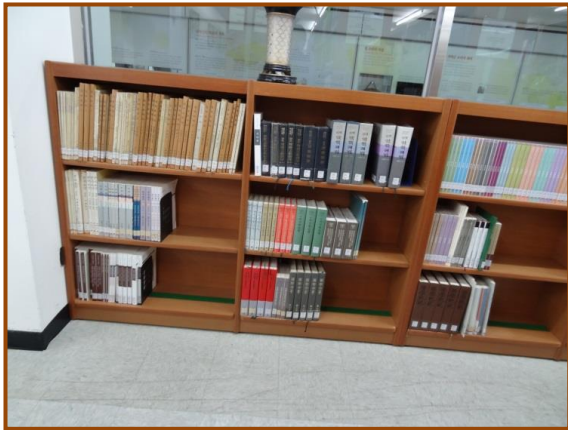
【圖 6】 韓國國立國樂院藏書於矮櫃一隅，主要置放 年鑑等書冊刊物。