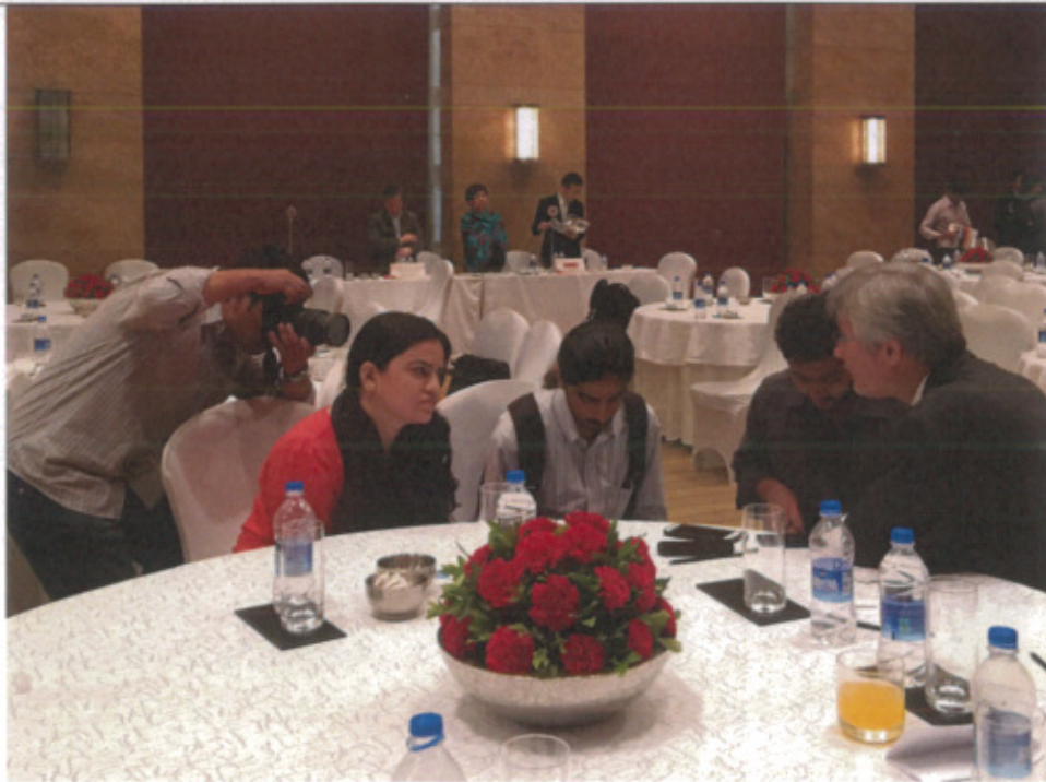
孟買媒體採訪交通部觀光局駐新加坡辦事處主任