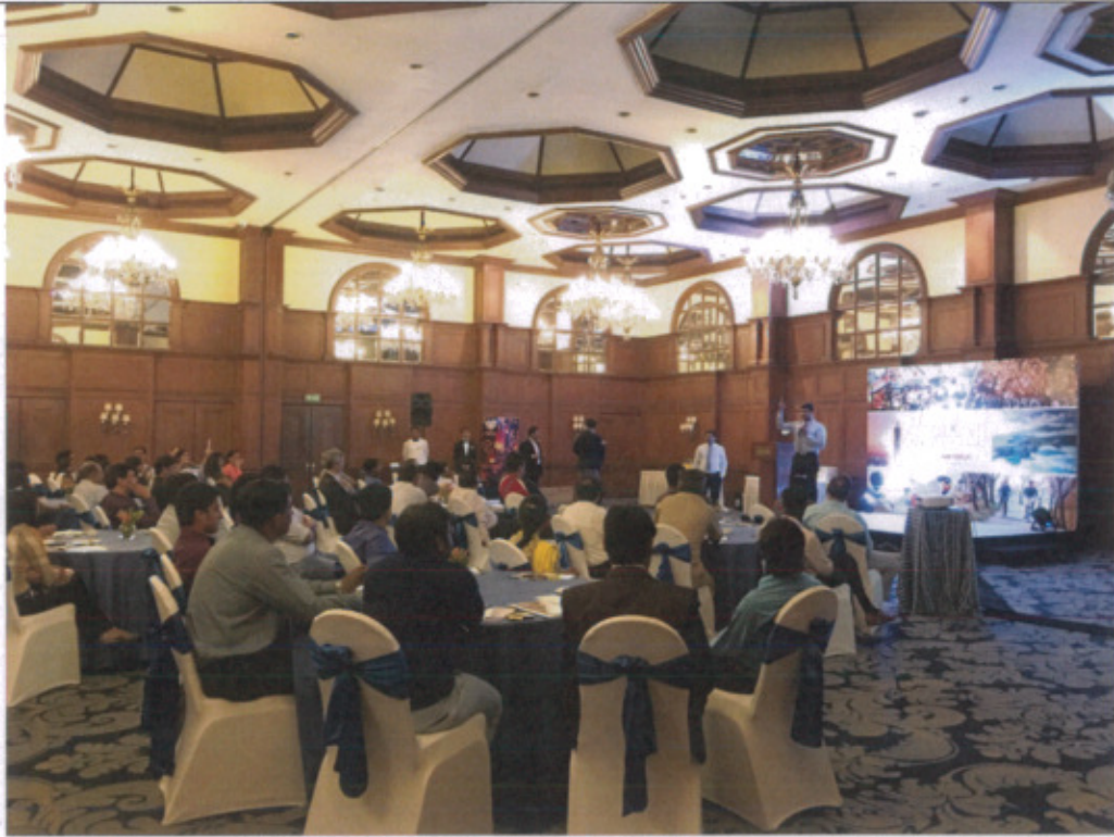
加爾各答場推廣會辦理情形