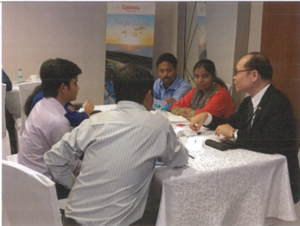
代表團之一及其印度代表向當地業者介紹該公司服務項目