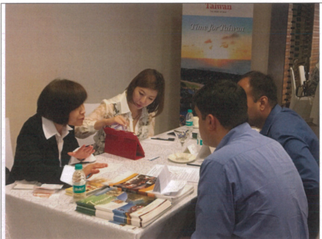
代表團之二利用報到時間至推廣會開始前的 B2B 時間與當地業者交流