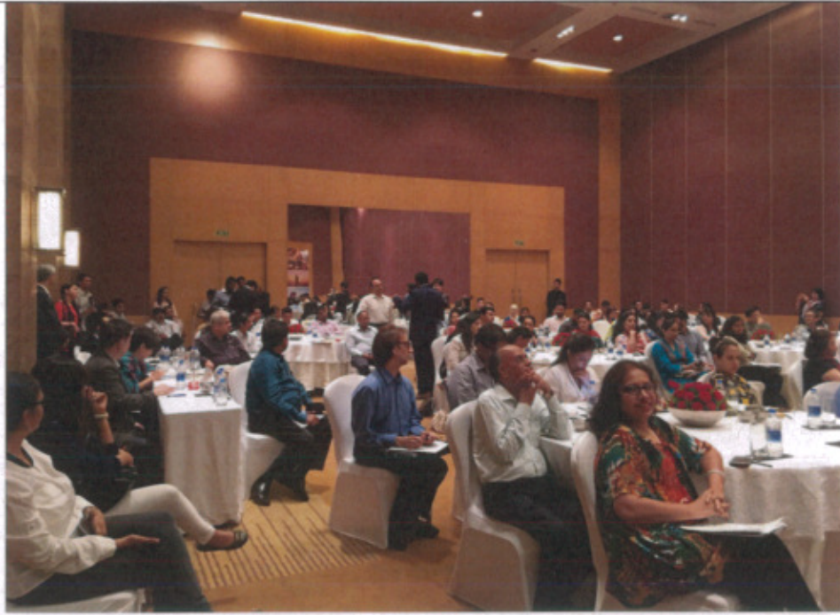
孟買業者踴躍出席臺灣觀光推廣會