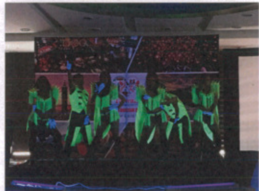
表演團體活力四射演出吸引當地業者目光