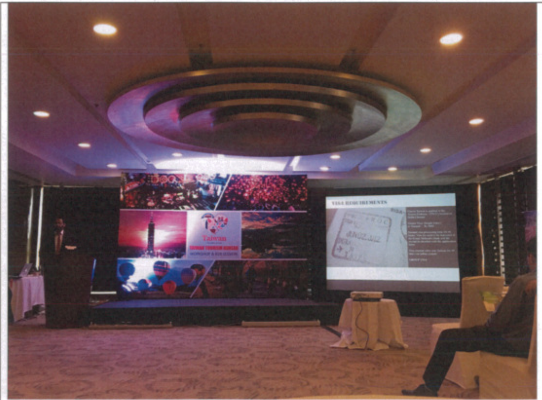
印度籍推廣會主持人介紹來臺申請簽證所需文件及觀宏專案內容