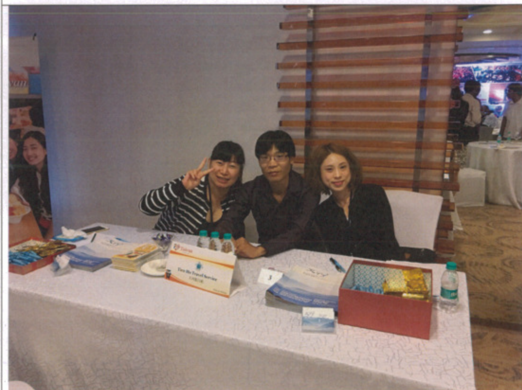
代表團之三請當地華僑擔任翻譯，增強與當地業者溝通能力