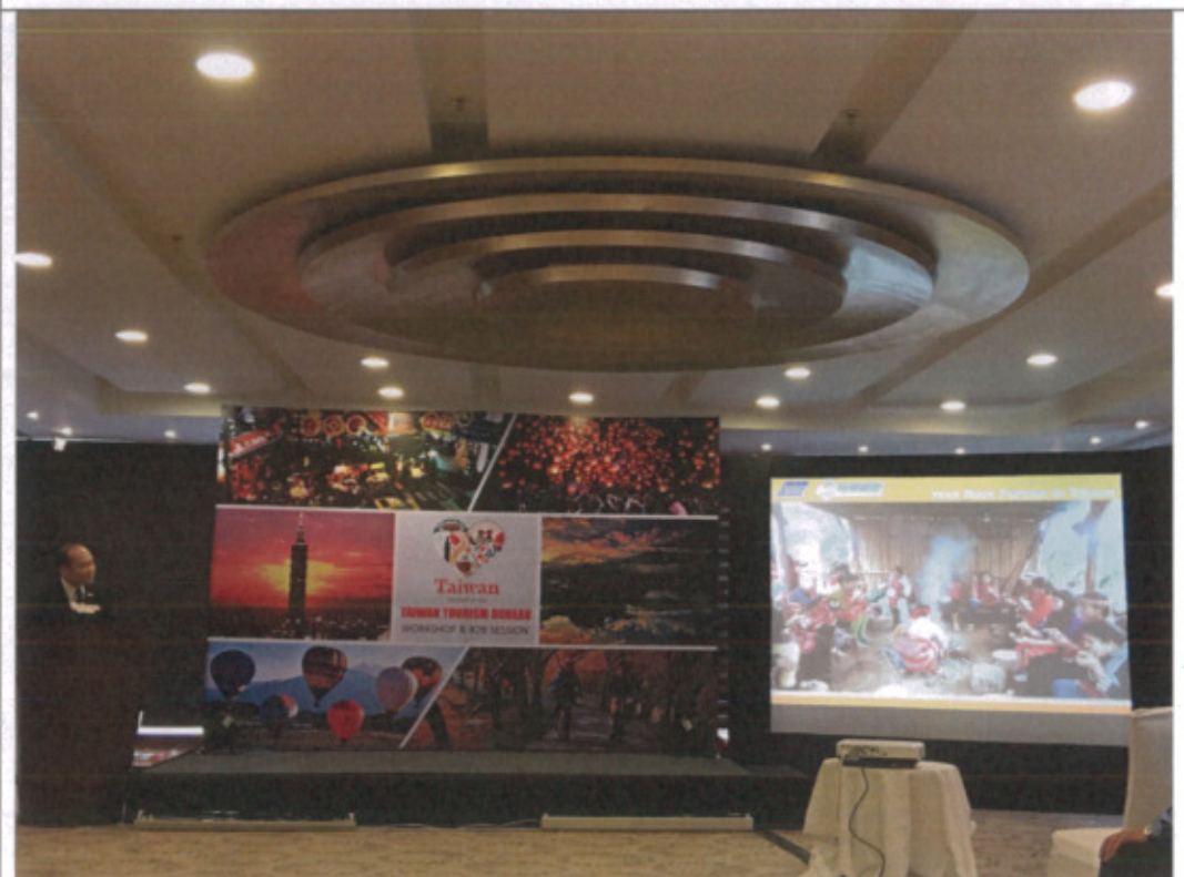
代表團之一簡報該公司接待印度團體成果