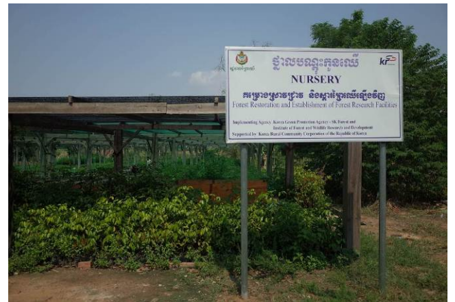
照片 8. 苗圃