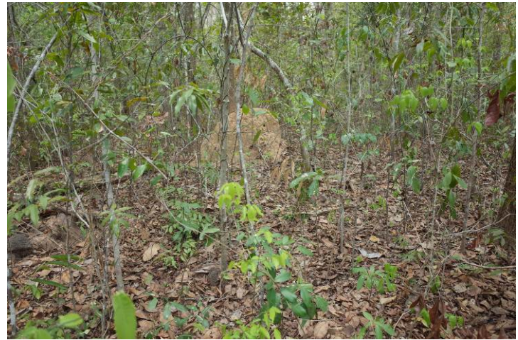
照片 18. 紅酸枝母樹林蟻丘眾多，為優良之發芽介質，惟為維持自然生態，並不加以採取。