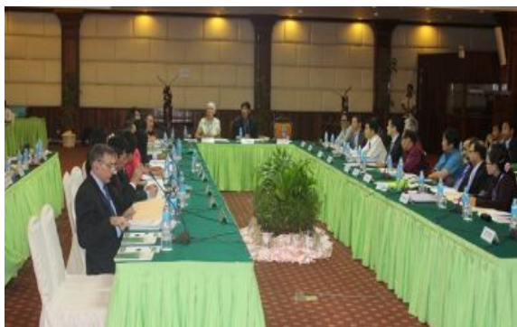
照片 1. 會議情形