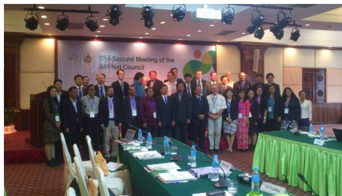
照片 4. 全體出席會員代表合影