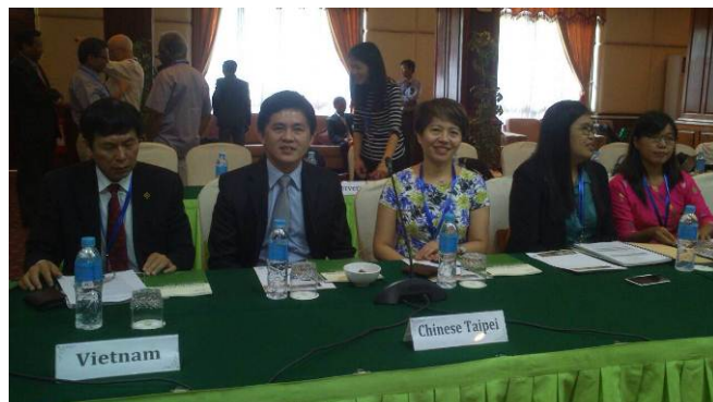
照片 2. 我國與會代表