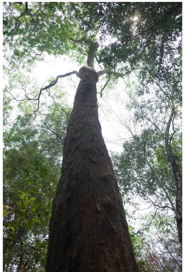
照片 20. 紅酸枝母樹