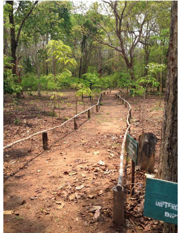
照片 14. 紅酸枝母樹林入口