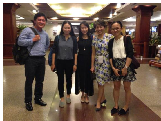
照片 6. APFNet 秘書處同仁與我國與會代表合影