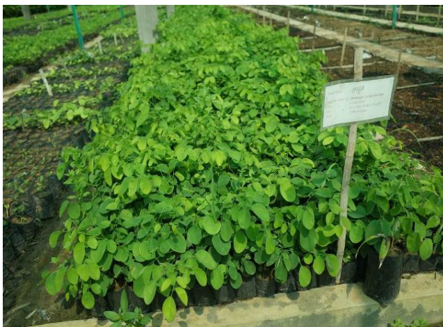
照片 9. 小苗