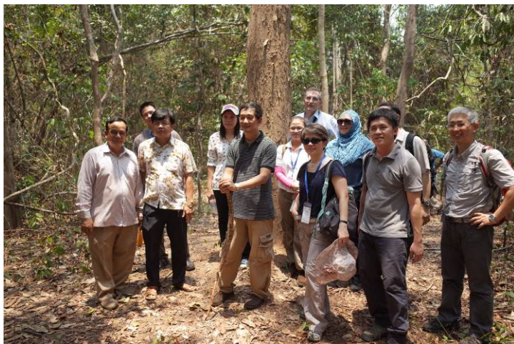
照片 19. 於林下合影