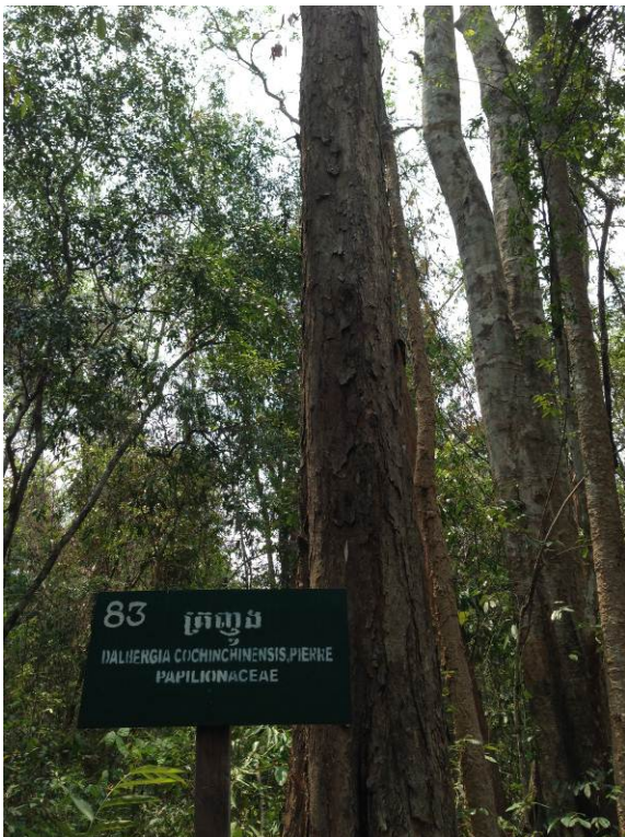
照片 15. 紅酸枝母樹