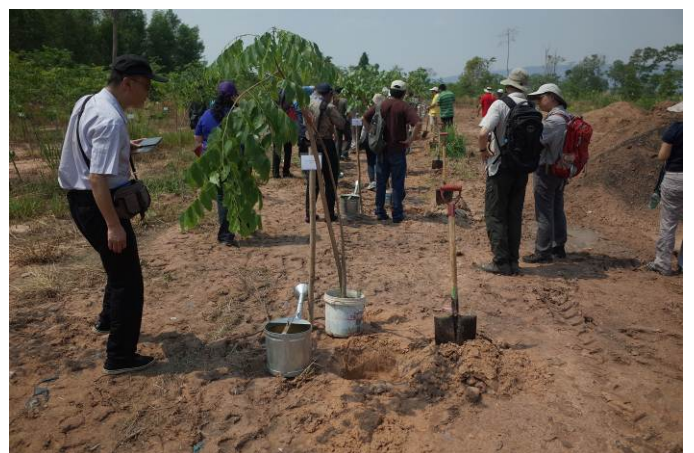
照片 12. 植樹活動