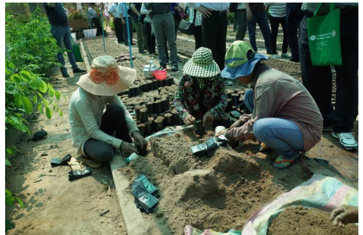
照片 10..工人育苗作業中