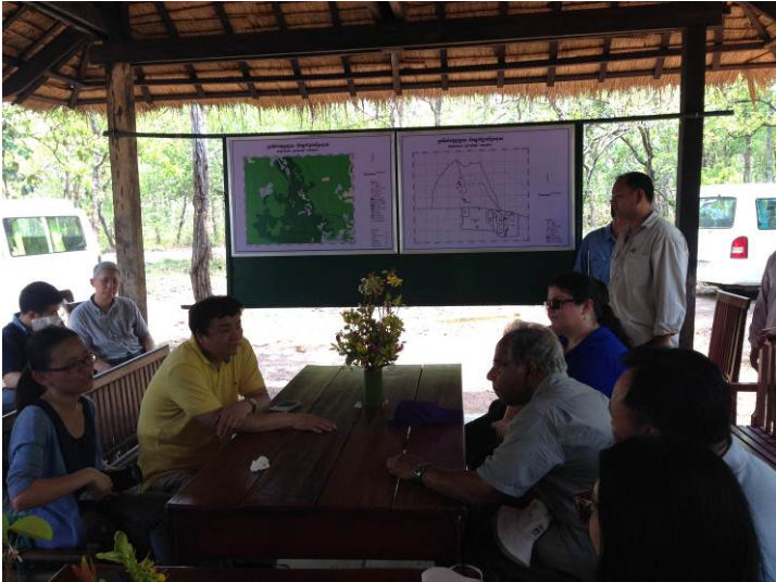
照片 13. 柬國官員(白衣立者)進行解說