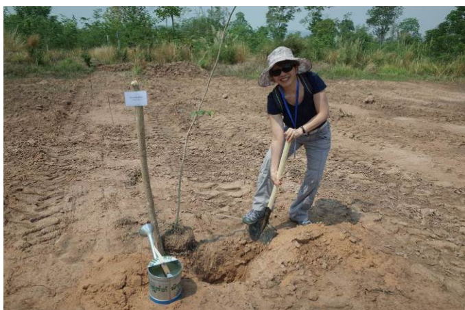
照片 11. 我國與會代表手植紀念樹