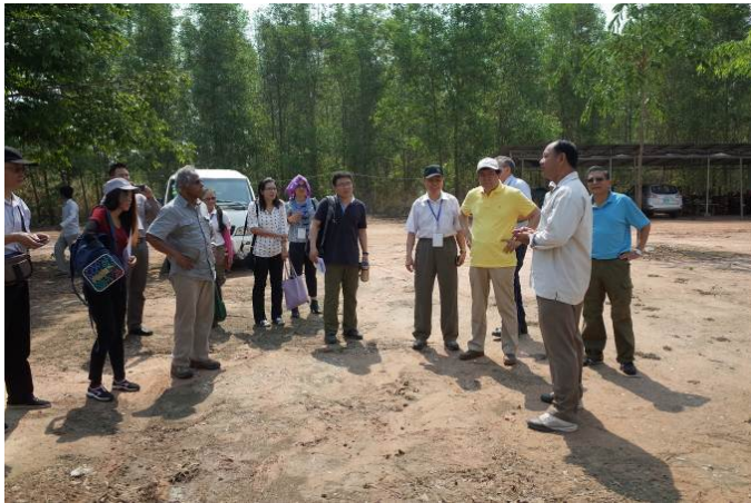
照片 7. 實地參訪柬國官員(白衣者)進行解說