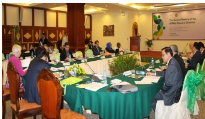
照片 5. 理事會隨後召開之董事會議