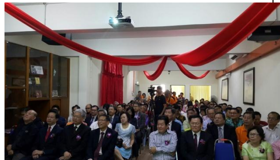
出席雪隆留臺同學會新會所開幕典禮與佳賓合影(1)