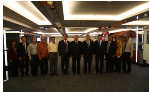
出席來西亞留臺校友會聯合總會感恩餐會(1)