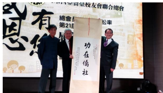
出席來西亞留臺校友會聯合總會感恩餐會(3)