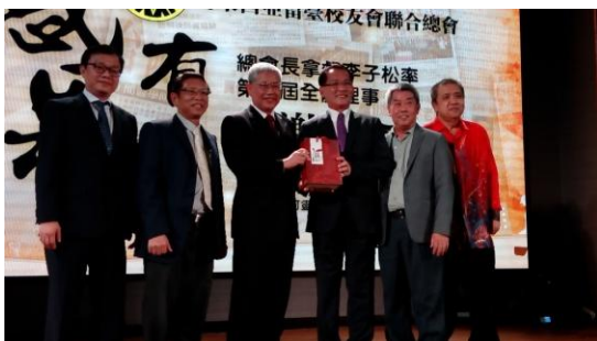
出席來西亞留臺校友會聯合總會感恩餐會(4)