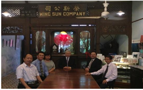
訪視檳城並參觀裕榮莊