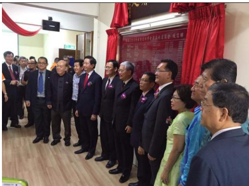
出席雪隆留臺同學會新會所開幕典禮與佳賓合影(2)