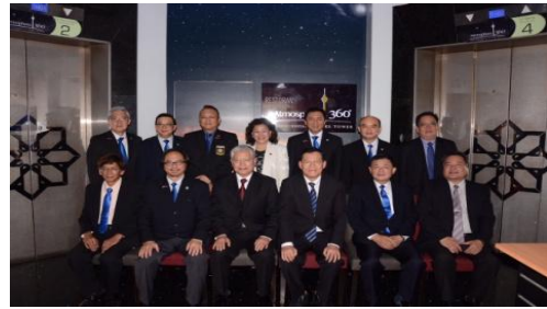
與馬臺經貿協會幹部交流合影(1)