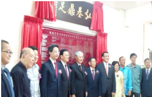
出席雪隆留臺同學會新會所開幕典禮與出席佳賓在本會所贈「弘基鼎足」牌匾下合影