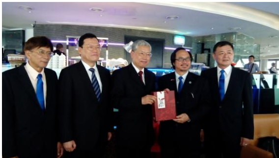
與馬臺經貿協會幹部交流合影(1)