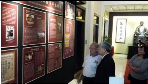
參觀孫中山紀念館