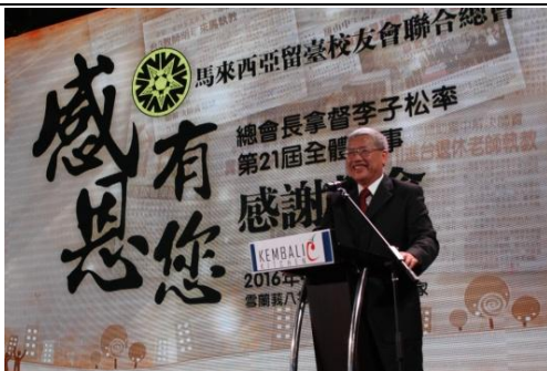
出席來西亞留臺校友會聯合總會感恩餐會(2)