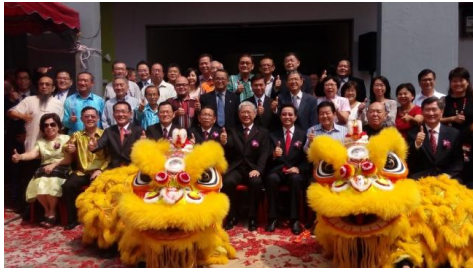
出席雪隆留臺同學會新會所開幕典禮與佳賓於新會所大門合影(2)