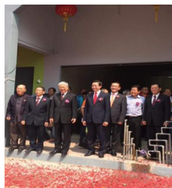
出席雪隆留臺同學會新會所開幕典禮與佳賓於新會所大門合影(1)