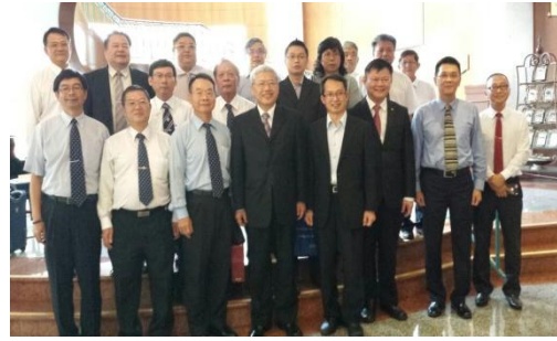
與檳城臺商會及檳城留臺同學會交流合影