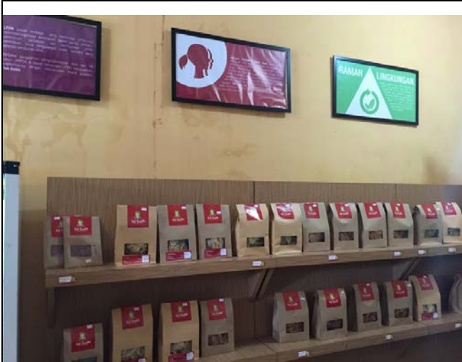
參訪當地婦女組織所創辦的合作社