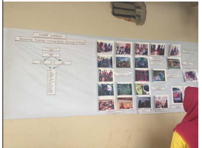
拜訪當地婦女組織-ICHIBAN