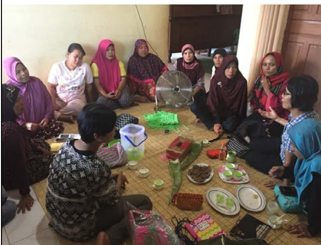
拜訪 Kelurahan Kuranji 農村，與村民們對談，認識他們的現況與了解他們期待於工作坊知道哪些方面的議題。