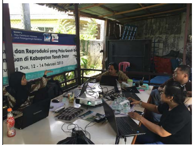
03/23 與合作單位 LP2M 以及 Bumi Ceria 的夥伴們共同討論計畫內容與預算表