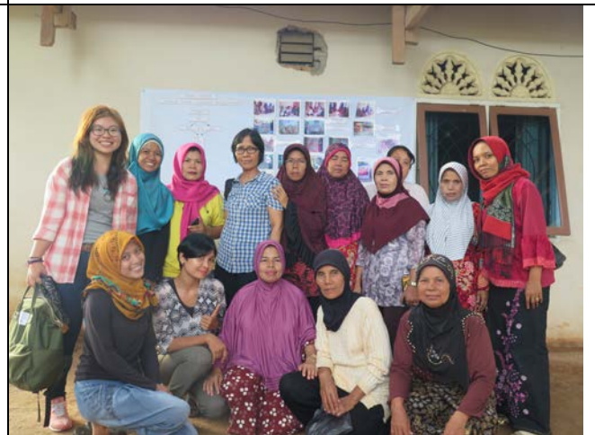
會後，與 Kelurahan Kuranji 農村村民們合照。