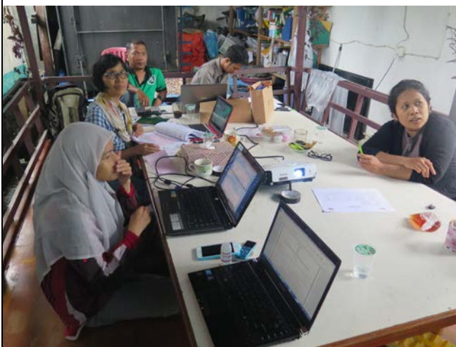
03/22 與合作單位 LP2M 以及 Bumi Ceria 的夥伴們共同討論及調整合作備忘錄