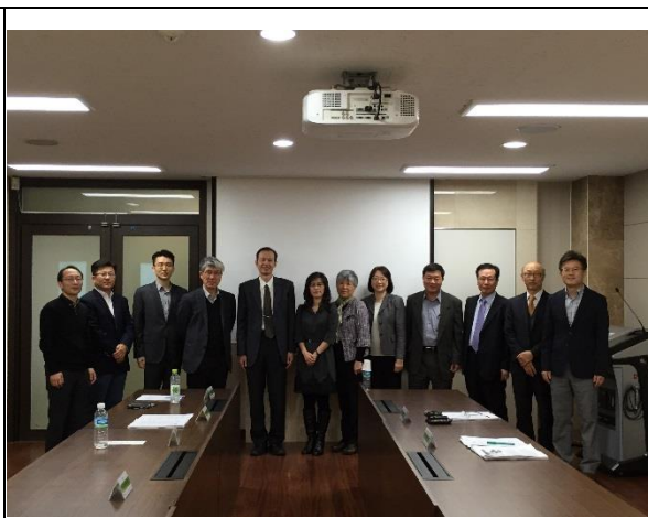
開幕全體教師合影