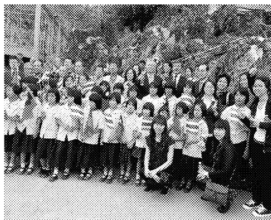
與振華小學師生合影