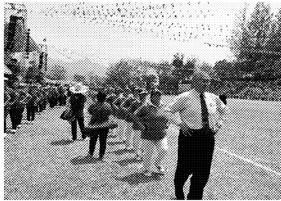
張主任秘書與大家同歡