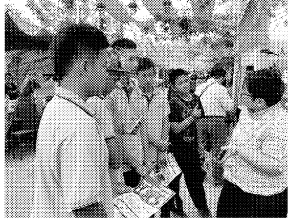
團員於攤位前說明招生科別