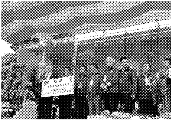
張主任秘書代表僑務委員會接受感謝狀