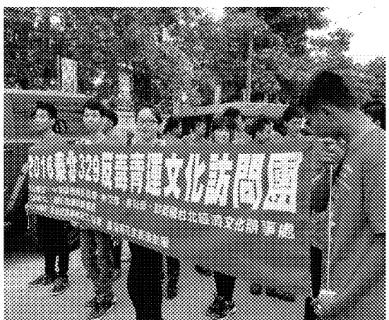
高雄市團康訓練協會代表於泰北 329 反毒青運會開幕典禮進場