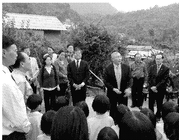
參觀振華小學興建中校舍