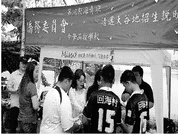
團員於攤位前說明海青班特色