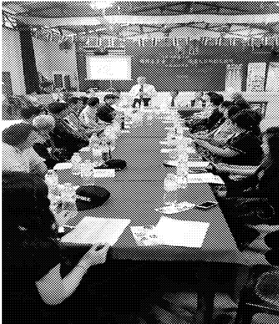
張主任秘書主持宣導說明會