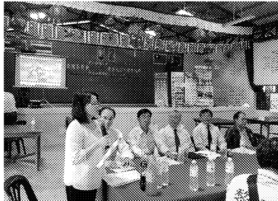
呂副處長說明此行目的 並介紹國內各校代表