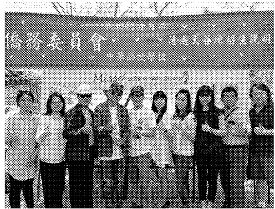
宣導團一行於攤位前合影