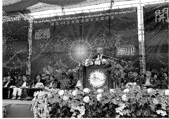
張主任秘書於泰北 329 反毒青運會開幕典禮致詞