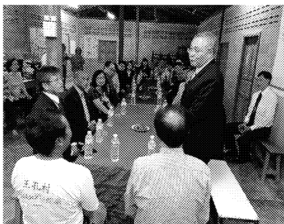
與王孔小學師長座談