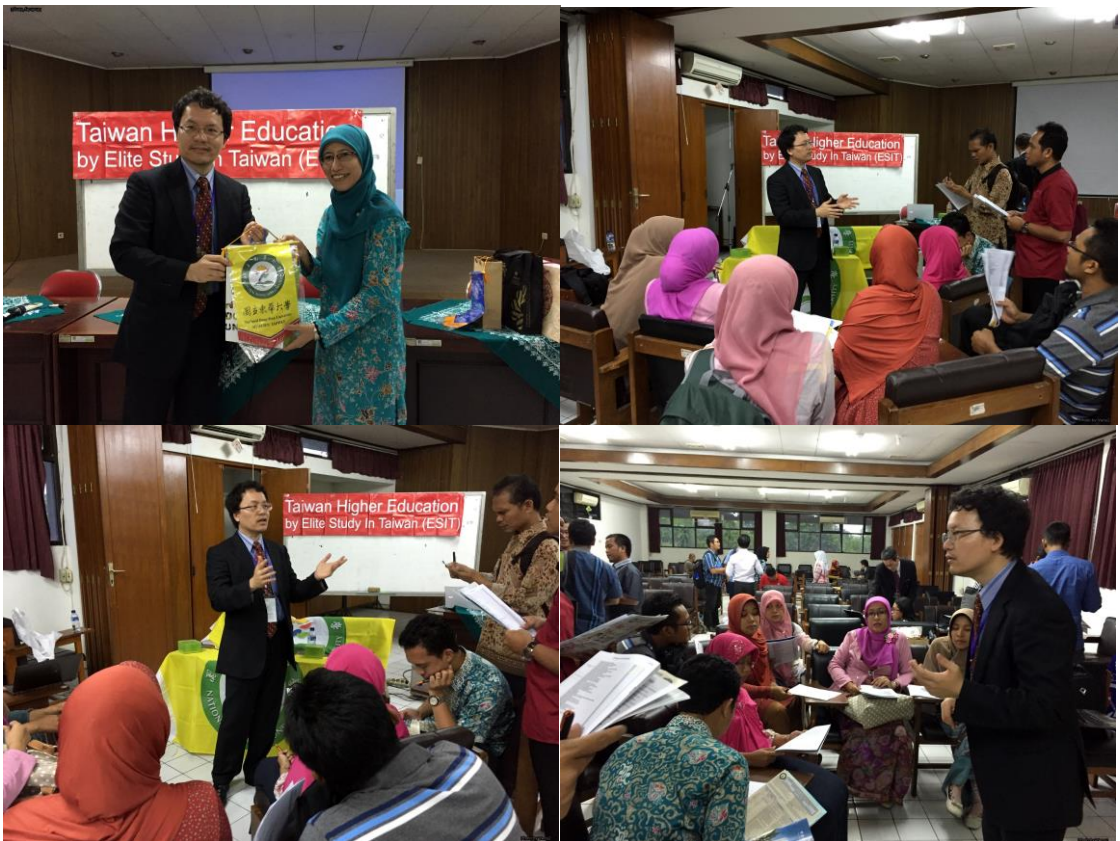
加查馬達大學，雖然人數略少於其他學校，但卻是最火熱的一場。