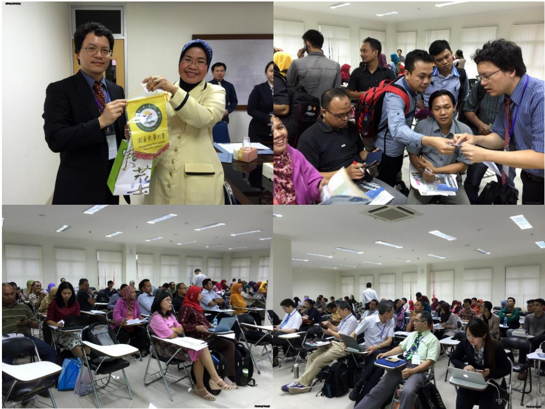
國立日惹大學，是此行唯一見到副校長層級的學校（左上圖）。