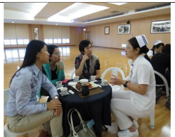
圖 4：護理實驗中心學生實習分享