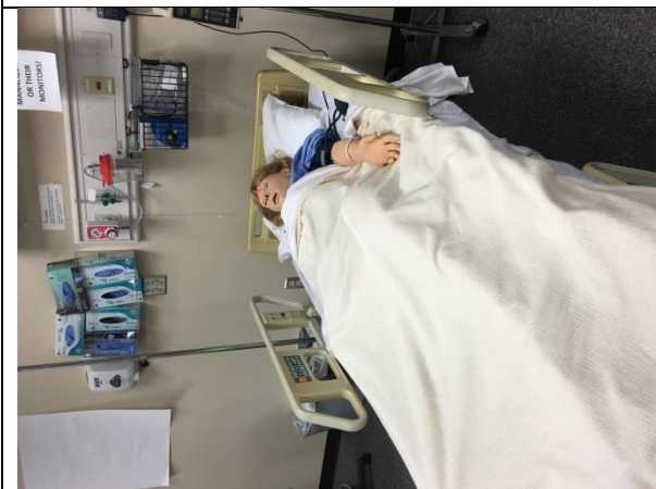
圖 5：香港護理實驗中心模擬病人