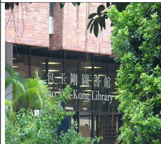
圖 3：香港理工大學校景