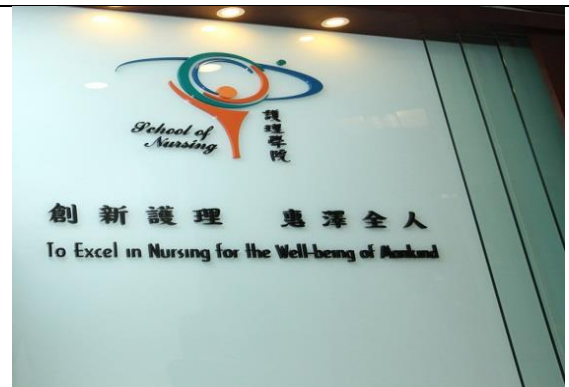
圖 2：香港理工大學護理學院入口