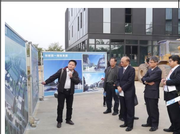
12/21 參觀廈門海滄區營運現況