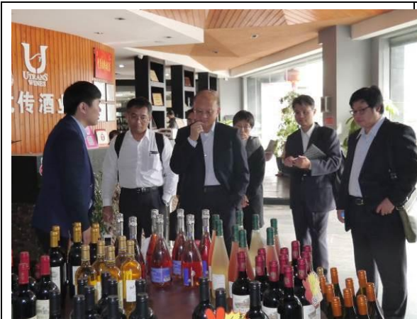
12/20 參訪廈門片區跨境電商保稅店