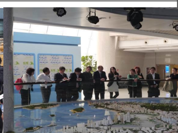
12/21 拜會廈門市商務局、福建自貿區廈門片區管理委員會