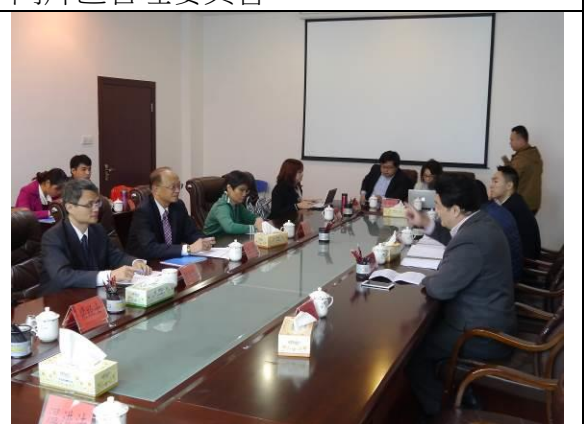
12/24 與管委會進行綜合座談