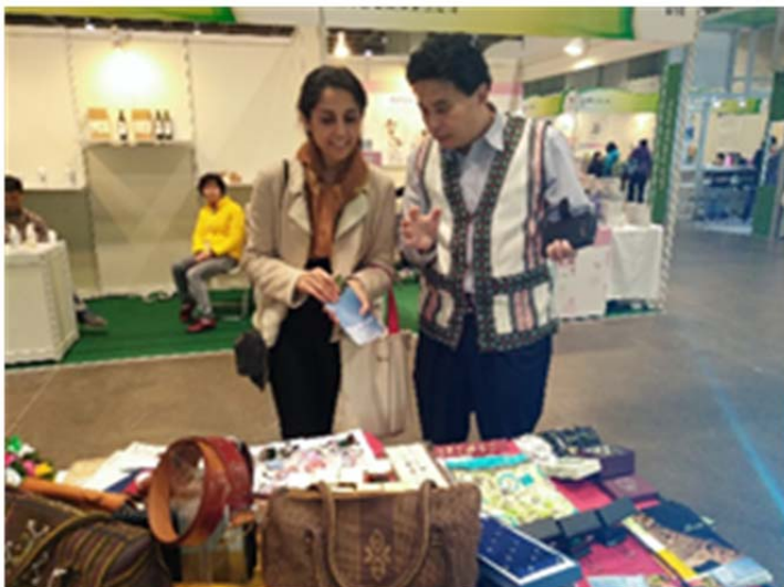
圖 5.向國外賓客介紹文宣品與參展物品