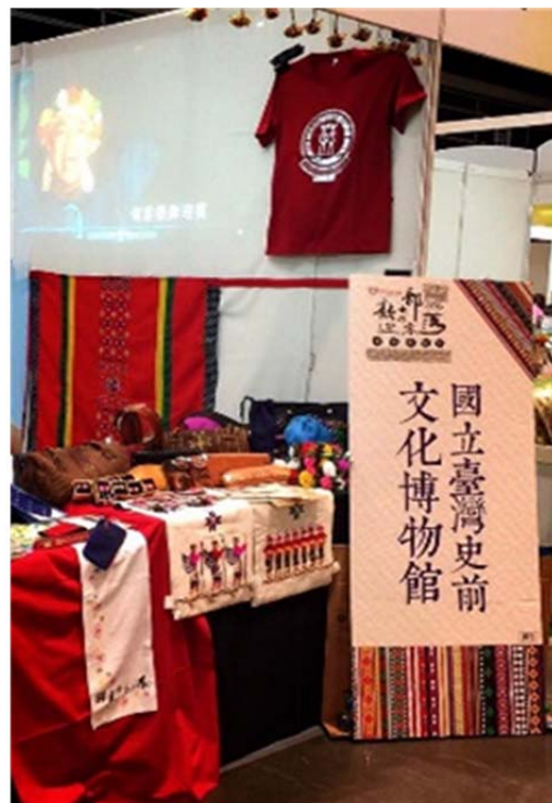
圖 4.本館(本示範區)參展物品與行銷影片