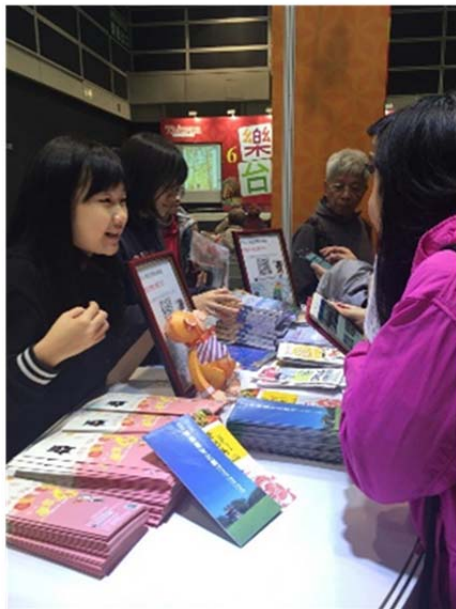
圖 10. 遊客詢問本館與本示範區之文宣內容