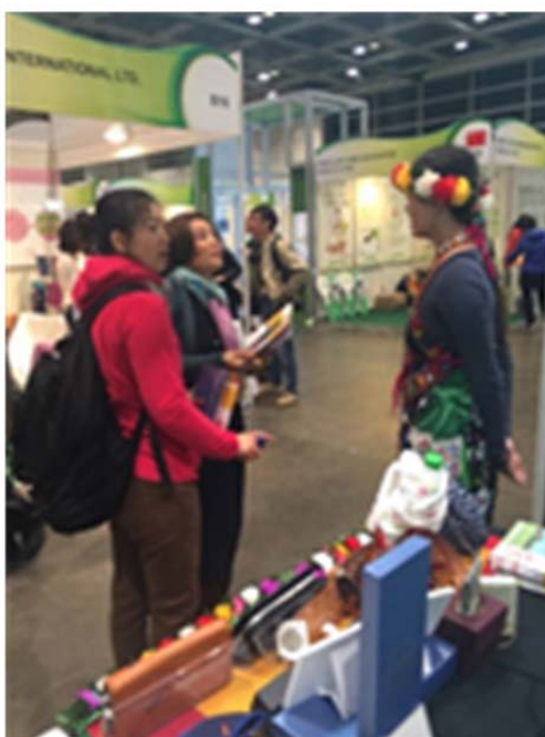
圖 7.向遊客解說本示範區計畫內容