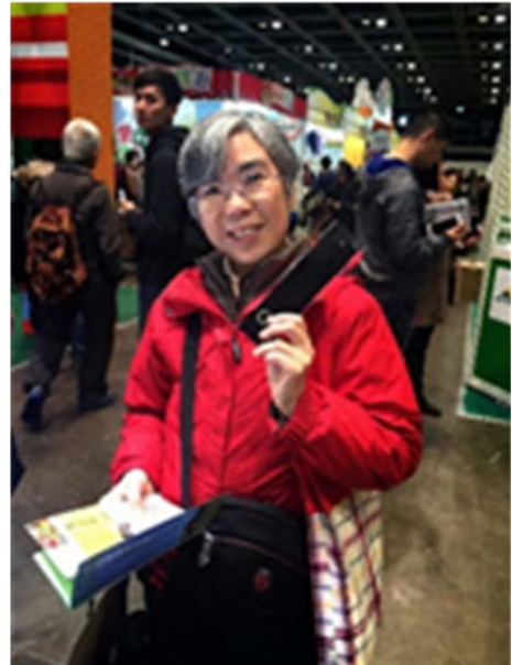
圖 11. 遊客索取本館與本示範區之文宣品