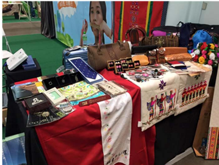
圖 3.本館(本示範區)參展物品

另外，財團法人中國生產力中心亦有從十三個未前往參展的產業示範區中挑選數項可攜至香港參展之物品、文宣等資料，以推展「推動原住民族知識發展創意經濟－產業示範區三年推動計畫」之行銷業務。原住民族委員會亦有派員參加及攜帶展示品與帶領樂舞表演團隊(如圖 8)，於展示會場中推廣介紹台灣原住民族文化及近年所發展之「部落心旅行」遊程。