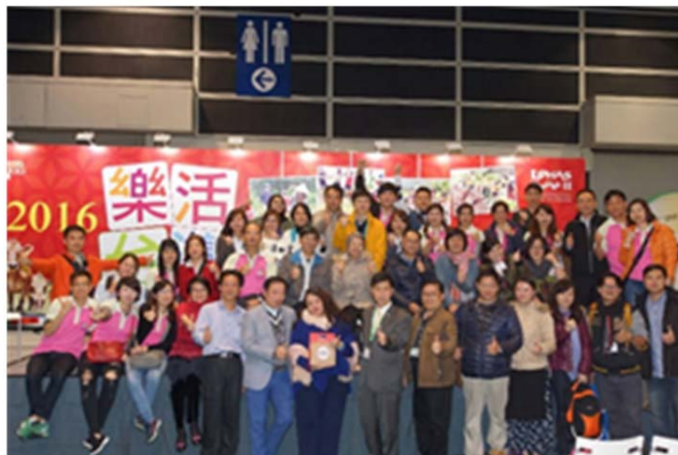
圖 12. 交通部觀光局駐香港辦事處與臺灣廠商拍攝團體照