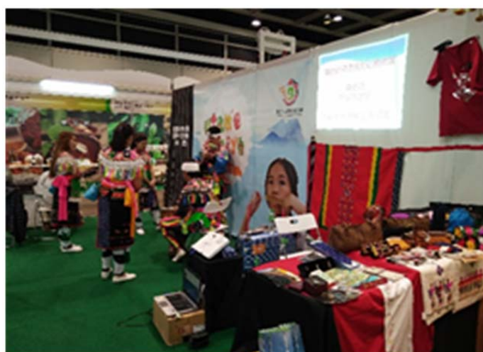
圖 8.新世紀文化藝術團於現場展演樂舞(圖片左側)