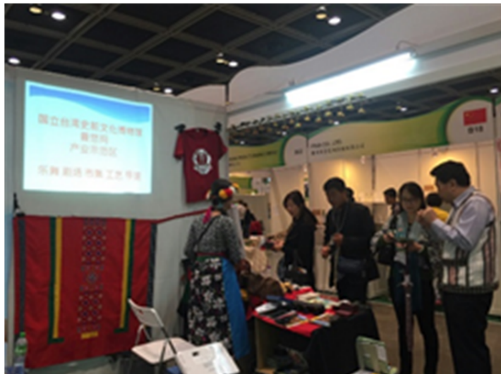
圖 6.向遊客介紹與展售參展物品