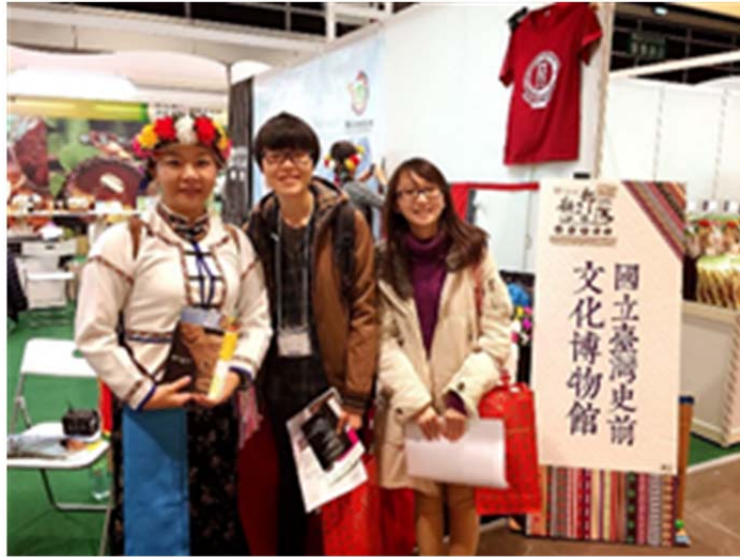
圖 9. 遊客與身穿傳統服飾之工作人員合照