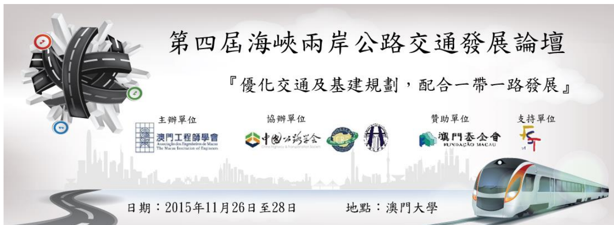
圖 1 論壇主軸

本次論壇係於澳門大學劉佐德伉儷演講廳舉行，該次論壇係隨著「亞投行」的成立，「一帶一路」將進入另一個新階段。各地區與地區之間的交通及相關的建設另將會陸續增加，在中國大陸、臺灣、香港及澳門不斷完善各地區之交通網絡之餘，各地亦積極地籌劃能配合「一帶一路」之交通計劃。為有助海峽兩岸之業界能更直接和深入地在交通發展方面交流，故澳門依此規劃重點來辦理本次海峽兩岸公路交通發展論壇。