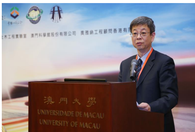
圖 7 石院長演講實況

該報告係以智慧交通系統是解決現代社會交通供需重要解決方式，透過城市交通智慧控制是實施智慧交通系統工程的首要任務，也是目前中國大陸交通控制工程領域研究的熱點問題。因此，該議題主要係透過需求引導為出發點，透過系統間調整及統籌運用管理，與城市空間結構相互結合，藉以解決城市間交通熱點問題。另外，藉由土地利用規劃，針對建設用地只減不增的策略，調整公路等級與研究複合式運輸系統(如公路、鐵路及捷運等)，藉以提高公路運輸效率。