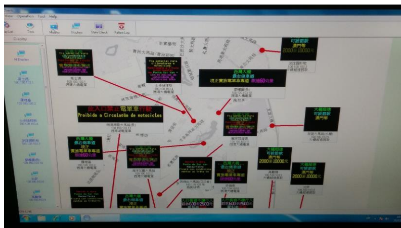
圖 21 交通資訊發佈實況