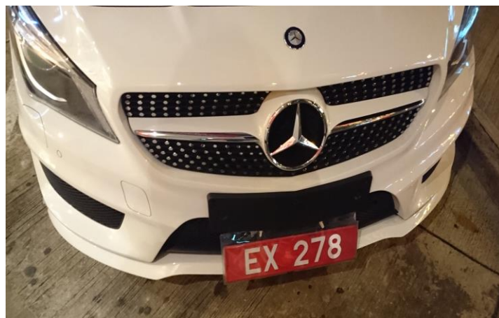
圖 24 澳門車輛懸掛臨時車牌案例

另外，澳門汽車車牌是以「M」字為首，再加以一個英文字母配以一組4位數字，而其陳列方式可以採單一直排或上下陳列方式，並無限制。另筆者於參訪過程中亦看到懸掛臨時車牌之車輛，澳門臨時車牌是採紅底白字方式，與正常車牌採黑底白字不同，另車牌形式以塑膠為材質，外頭並加上透明封套，同時懸掛位置與一般車牌相同，置於車牌應懸掛處。此外，因香港及深圳可開車進入澳門特別行政區，故路上可看到同時懸掛澳門車牌與其它地區車牌之車輛，據交通事務局人員表示，該項懸掛方式並不合法，但通常執法人員並不會嚴格執法。