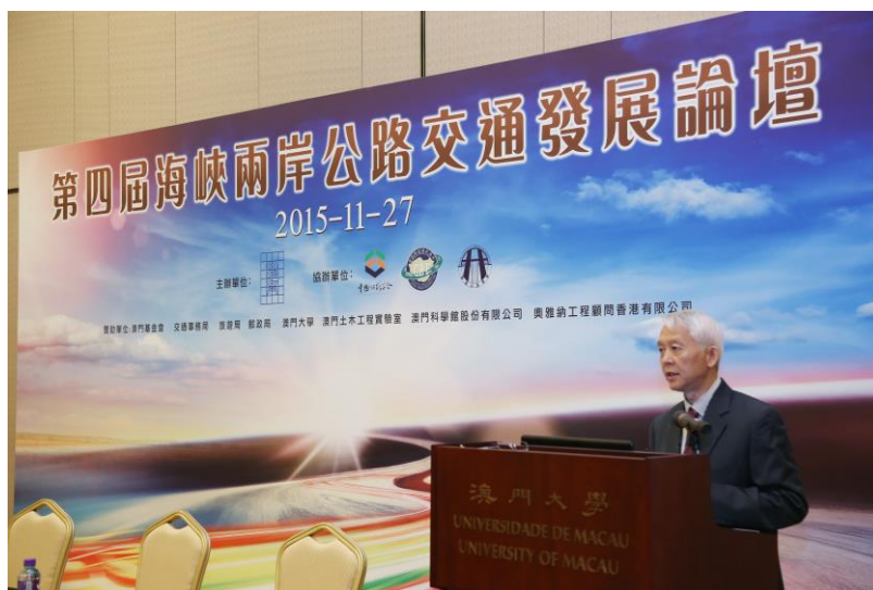
圖 8 張副局長演講實況

因為有前述各項工法的創新及突破，使得該項計畫獲得國際道路協會(IRF)年度設計類首獎肯定，借此機會與兩岸四地工程師進行經驗分享。