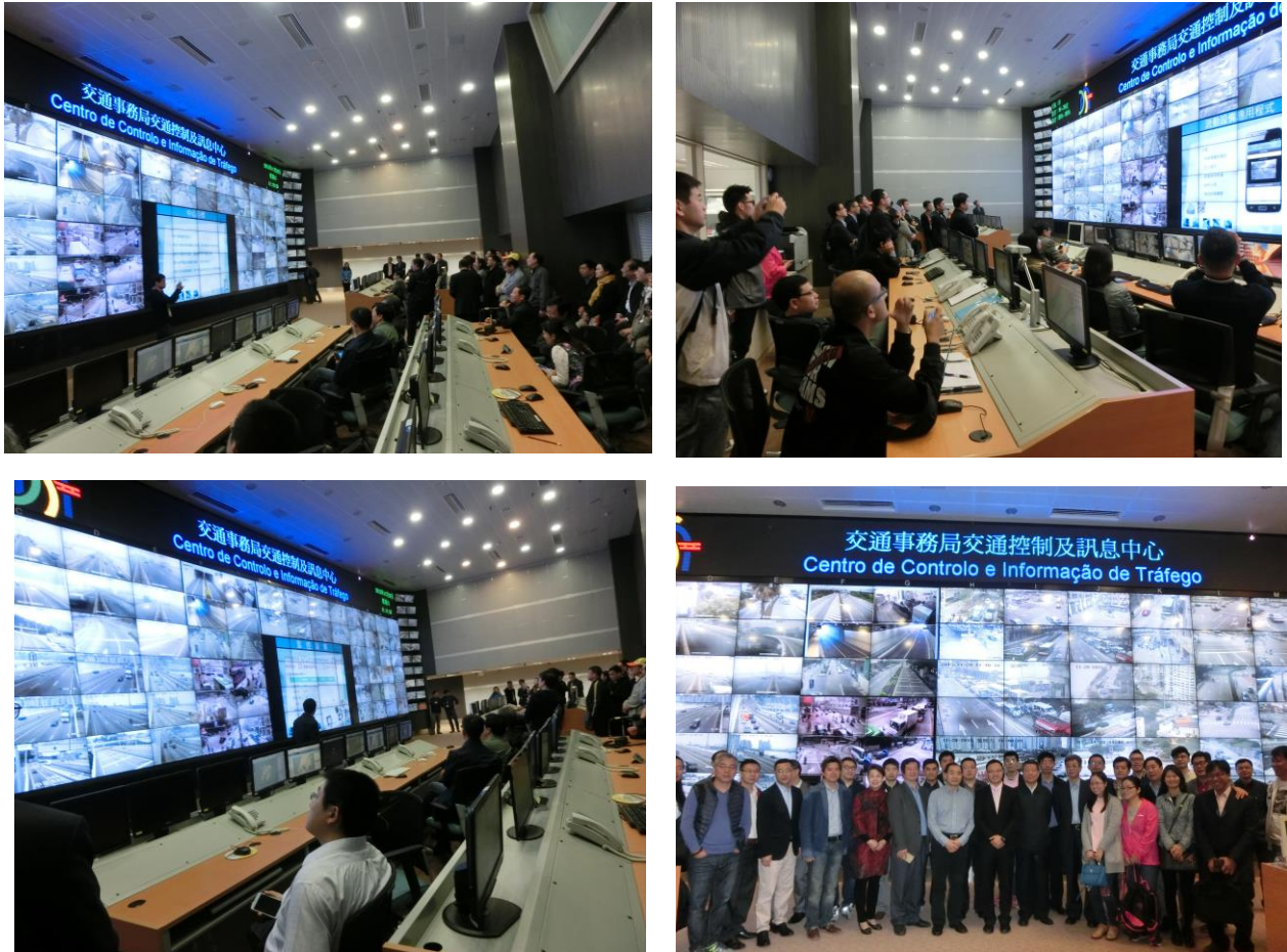
圖 20 參訪交通控制中心

目前該交通控制中心主要發佈之交通資訊包含施工資訊、交通管制措施及惡劣天氣提示。另外，當遇有突發事件時(如交通意外、事故影響等)，亦會配合發佈資訊。