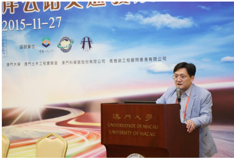
圖 18 毛高級技術員演講實況