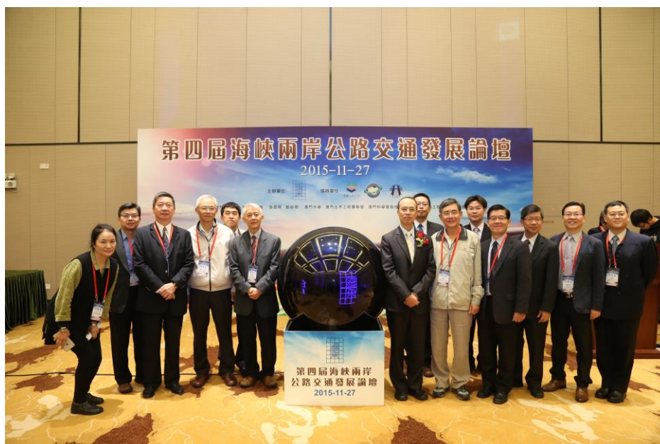
圖 4 臺灣代表團人員合影