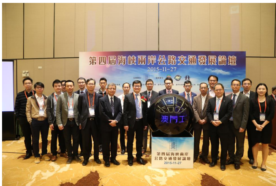
圖 3 香港代表團人員合影

陸正積極推動「一帶一路」政策，該政策橫跨三大洲及60多個國家，引起國際社會廣泛討論，而香港於過去數十年均是採對外開放政策，擁有國際接軌經驗及專業資源，有助於大中華地區的公路運輸相關企業，參與亞非歐沿線的基礎建設發展，透過今天論壇更可加強交流與合作。