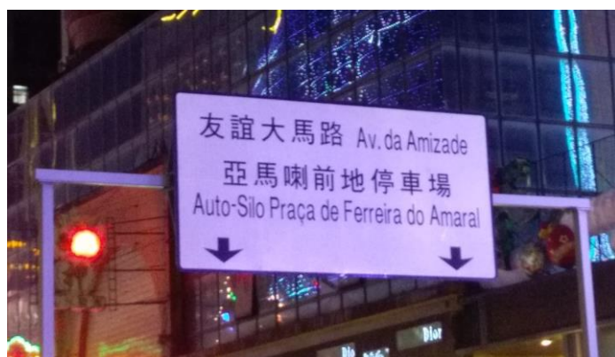
圖 27 澳門交通宣導廣告及停車場指示標誌