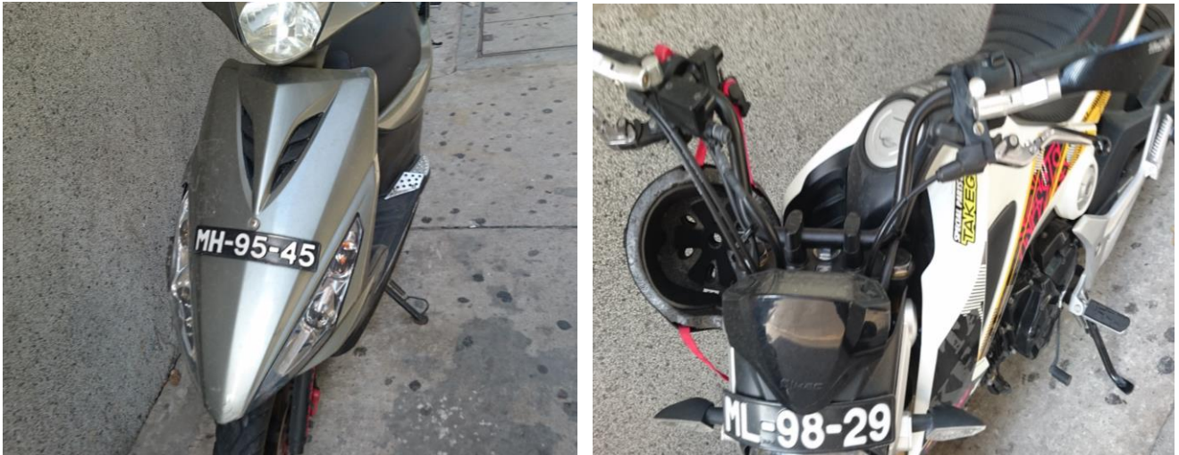
圖 23 澳門機車懸掛前車牌案例

另外，澳門汽車車牌是以「M」字為首，再加以一個英文字母配以一組4位數字，而其陳列方式可以採單一直排或上下陳列方式，並無限制。另筆者於參訪過程中亦看到懸掛臨時車牌之車輛，澳門臨時車牌是採紅底白字方式，與正常車牌採黑底白字不同，另車牌形式以塑膠為材質，外頭並加上透明封套，同時懸掛位置與一般車牌相同，置於車牌應懸掛處。此外，因香港及深圳可開車進入澳門特別行政區，故路上可看到同時懸掛澳門車牌與其它地區車牌之車輛，據交通事務局人員表示，該項懸掛方式並不合法，但通常執法人員並不會嚴格執法。