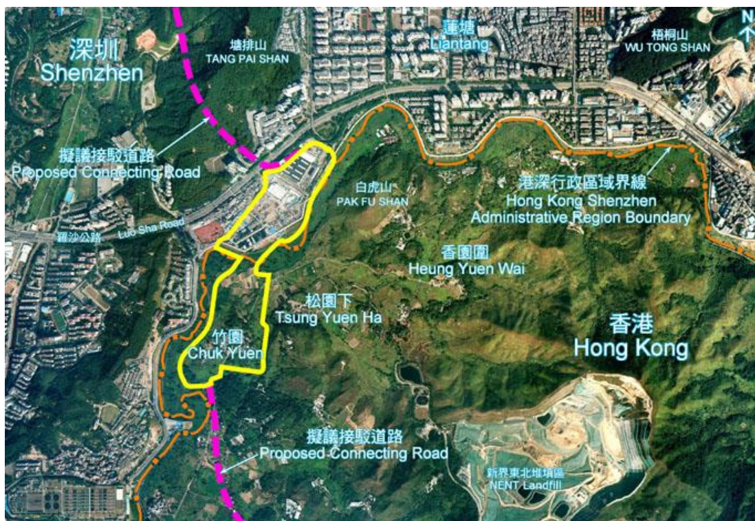
圖 9 蓮塘/香園圍口岸建設區域

該項工程主要是香港平整約23公頃土地，建造一條全長約11公里的雙程雙線分隔連接路，以連接口岸與粉嶺公路，以便建設口岸大樓及相關設施，同時改善介於平原河和白虎山間之邊界巡邏通路，同時搭配各項環境美化工程。因該項工程涉及河流整治作業，故相對工程複雜度及環境保護議題，為該工程施工之重要挑戰。目前該項工程預計2018年完工。