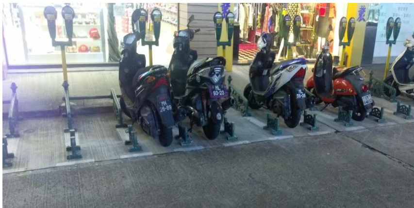
圖 26 澳門機車路邊停車格