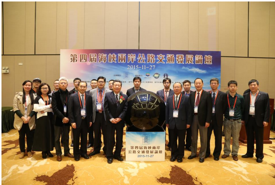
圖 5 中國大陸代表團人員合影

兩岸四地代表結束致詞後，隨即由大會針對今日發表主題報告及專題報告的報告者，致贈紀念品並留影合照。