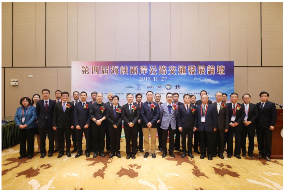
圖 6 主題報告及專題報告主講人合影

兩岸四地代表結束致詞後，隨即由大會針對今日發表主題報告及專題報告的報告者，致贈紀念品並留影合照。