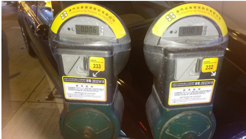
圖 25 澳門路邊停車計費器

澳門汽車及機車路邊停車付費方式，係採行投幣計費器之管理方式，由車主按停車時間需求預先投擲費用。另比較特別的是，澳門機車停車格因採收費方式，故並非採繪製標線方式，而是設立實體分隔方式，其用途與臺灣採標線繪製方式不同。