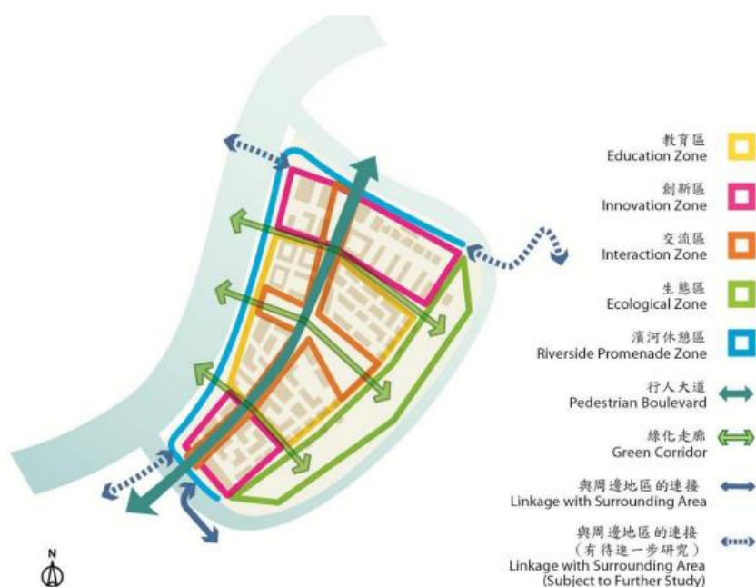
圖 12 落馬洲河套地區未來規劃區域

境，以促進「產學研」交流互動。整個研究報告已於2014年2月完成，目前正由香港特別行政區政府及深圳市政府就後續政策進行研議中。