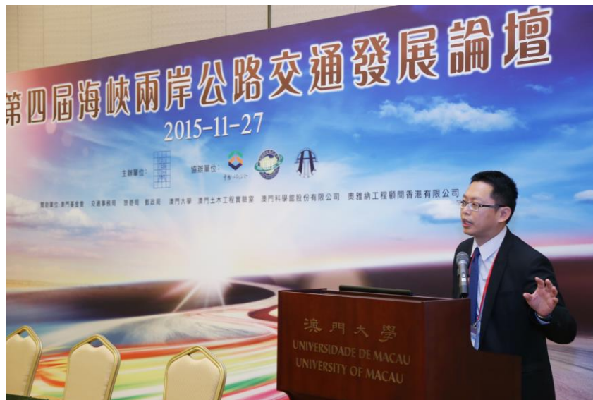
圖 16 筆者演講實況

為了使兩岸四地工程師瞭解臺灣高速公路ETC系統建置計畫發展過程，同時落實行政院所訂定之ETC整廠輸出推廣政策，筆者獲邀就該計畫發展過程進行說明。演講主軸係從ETC發展目的及政策推動內容，提到目前營運狀況，同時特別加註說明本計畫甫獲得國際橋梁隧道及收費公路協會(IBTTA)頒發「2015年收費系統卓越獎-服務及推廣類」及大會唯一年度首獎。藉由這個場合的參與及發表，成功宣導臺灣ETC系統。