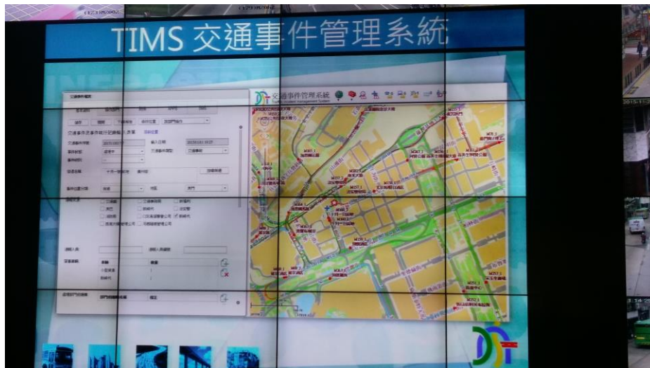
圖 22 交通事件管理系統

該交通控制中心設有事件管理系統，其中心主要統合彙整來自執法部門、公車單位及民眾通報之相關事件資訊，並統一透過App及資訊可變標誌發佈事件資訊，此點值得國內學習。另外，該中心配合颱風或暴雨等天氣，亦設有緊急應變小組，其目的係透過資訊交換及協調控制設備，協助儘快處理各停車場可能出現之淹水狀況，同時採取相關措施維持公共運輸，以利儘快修復交通設備，將用路人財產損失減至最低。