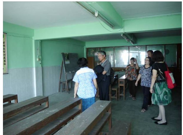
於仰光中正學校參觀教室環境