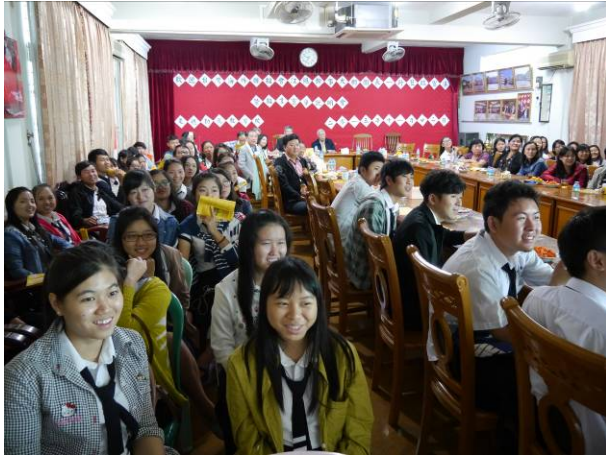
曼德勒宣導-學生正觀賞宣導短片