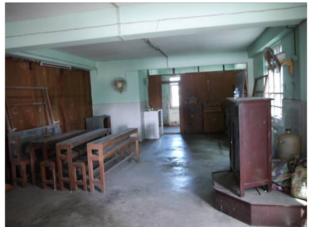
仰光宣導-中正學校上課環境