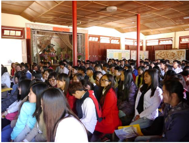
眉苗宣導-學生正在觀賞宣導影片