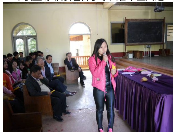
臘戍宣導-學生大方於臺前提問