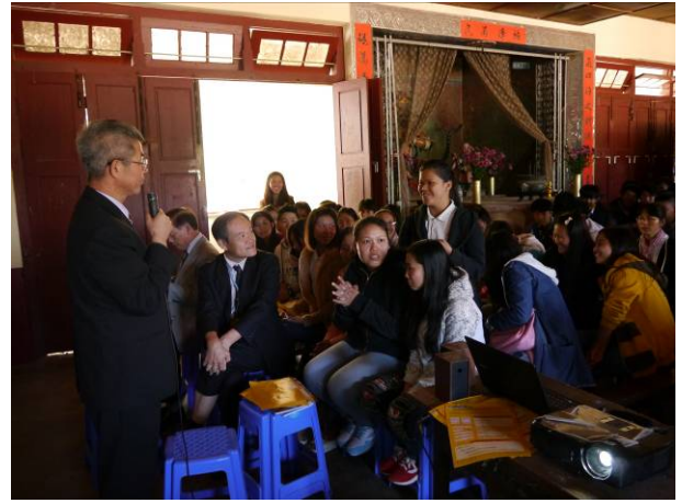
眉苗宣導-學校老師提問