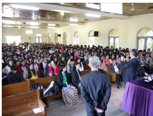
臘戍宣導-學生正認真聽講