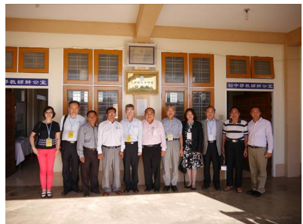
與臘戍果文學校師長合影