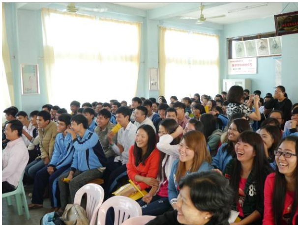
密支那宣導-學生正觀賞宣導短片