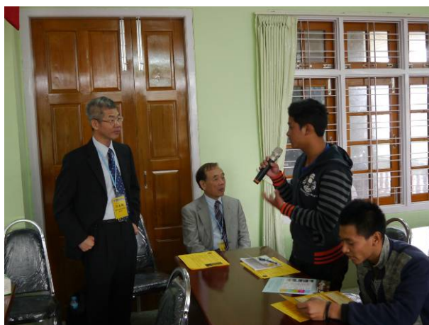
東枝宣導-學生提問