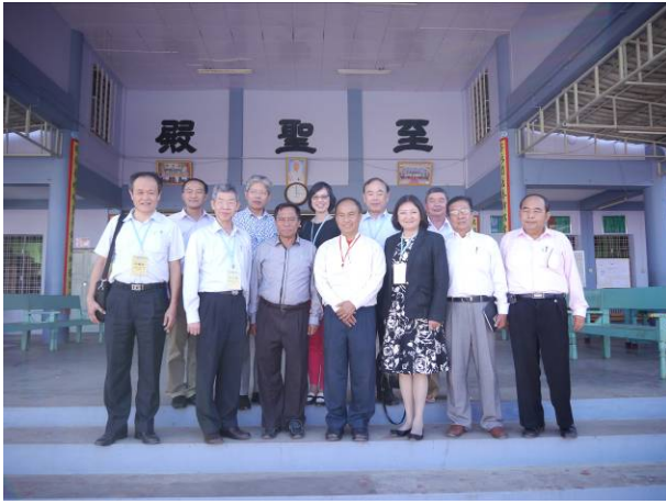
與臘戍明德學校師長合影