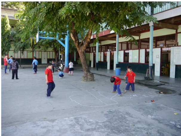
育成學校幼小部學生下課後正在跳格子