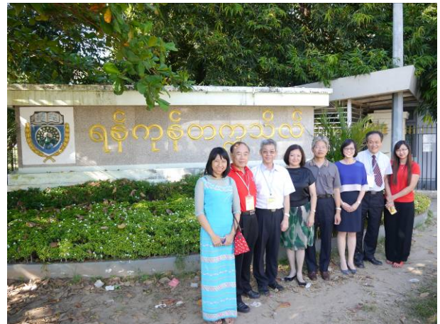
仰光大學校門前合影