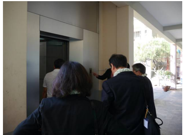
孔教(東區)學校新建的電梯