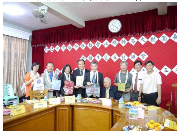
於曼德勒宣導後與當地校董、校長合影