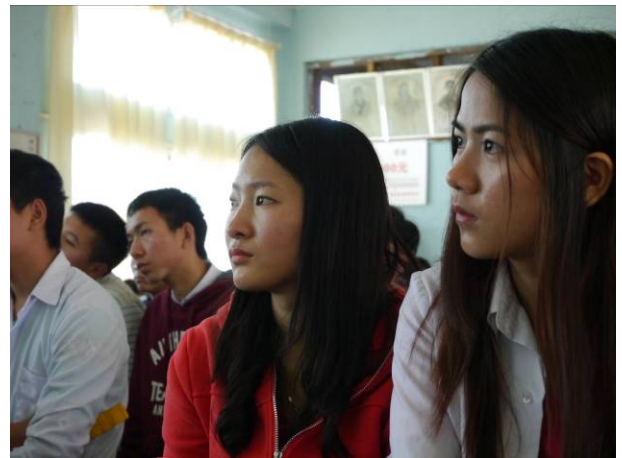
密支那宣導-學生正認真聽講