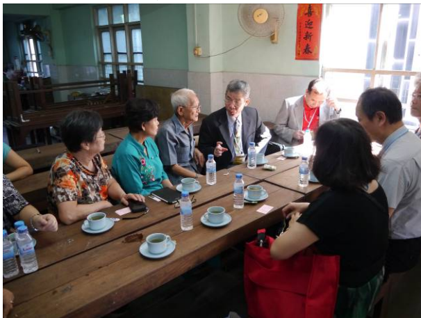
仰光宣導-與師長會談