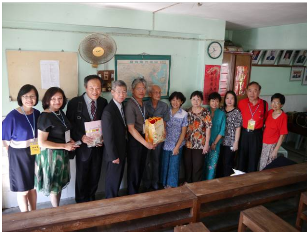
於仰光宣導後與當地校董、校長、老師合影