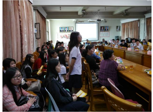
曼德勒宣導-學生提問