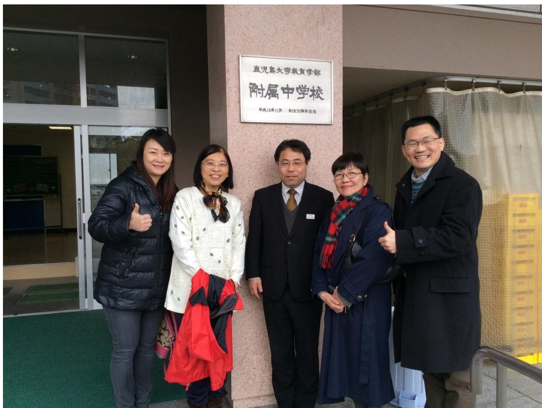
本團老師與鹿兒島大學附屬中學中崎新一郎副校長合影