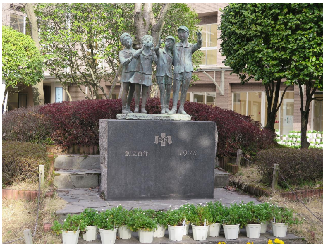
(鹿兒島大學附屬小學)

老師透露小學著重科學，參觀班級正在進行認識校園，副校長及行政團隊迎接我校教師，在確認整日參訪行程、觀看學校介紹影片後，我們一行人隨著副校長及兩位英語老師參觀各年級教室及專科教室。普遍觀察教室氣氛，由老師引導問題，小組討論並由學生主動發言。參觀了理科教室，阻及導電實驗。