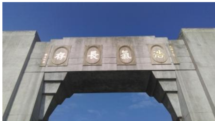
圖 8:出席代表參觀黃花崗七十二烈士墓園

於12月15日上午主辦單位安排前往參觀黃花崗公園，公園位於廣州市先烈中路，占地約13萬平方公尺，正門高13公尺的牌坊上雕刻著孫中山先生親筆提詞「浩氣長存」，園內200多公尺長的層級主幹道兩旁蒼松翠柏排列有序，崗陵上安放著七十二烈士之墓，幕後的紀功坊上屹立著自由女神像。