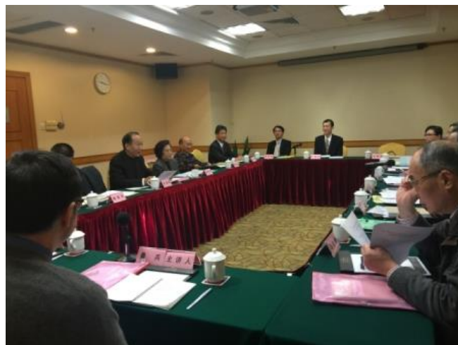
圖 1：2015 中山思想學術研討會現場

為推動兩岸孫學研究與實踐之學術文化交流活動，2011年8月本館、廣東孫中山基金會及上海中山學社在上海所舉行的孫學研討會時達成共識，未來每年輪流異地召開學術研討會，期透過學術交流活動，達到推廣孫學研究及兩岸學術交流之目的。2012年在廣州以「從孔夫子到孫中山：傳統文化與當代社會」為主題召開，2013年在本館以「紀念孫中山：華人文化與當代社會發展」為主題舉辦，2014年在