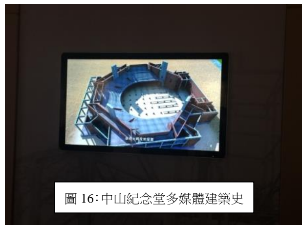
圖 16: 中山紀念堂多媒體建築史

此次參訪廣州中山紀念堂，該紀念堂目前展出一系列「中山紀念堂建築史料展」，係多年來研究的成果，透過歷史文獻、照片的展出，重現該紀念堂的歷史風華，尤其該紀念堂將建築過程透過 3D 動畫呈現，讓本館人員印象深刻。本館也可規劃利用現代多媒體科技，呈現當年王大閎先生擘建本館的建築工法，讓參觀民眾能夠領會本館歷史建築的風貌。