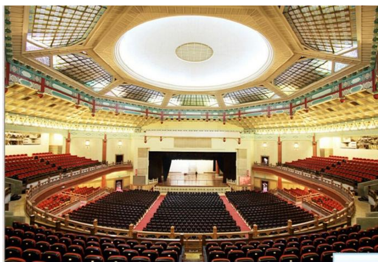
圖7：廣州中山紀念堂劇場一隅

該紀念堂展出一系列的「中山紀念堂建築史料展」，展出內容為與該紀念堂建築有關之史料，展出方式則以文字圖片及多媒體呈現，尤其將該紀念堂建築之歷程透過3D動畫呈現，讓本館人員印象深刻。在旅遊服務方面，所提供之遊客導覽服務，主要係該紀念堂建築特色之解說，並採取進入參觀即收取人民幣10元門票之措施。另演出服務方面，該紀念堂不定期提供音樂會、電影欣賞、表演藝術等演出，為一多功能之藝文聚會表演場所。