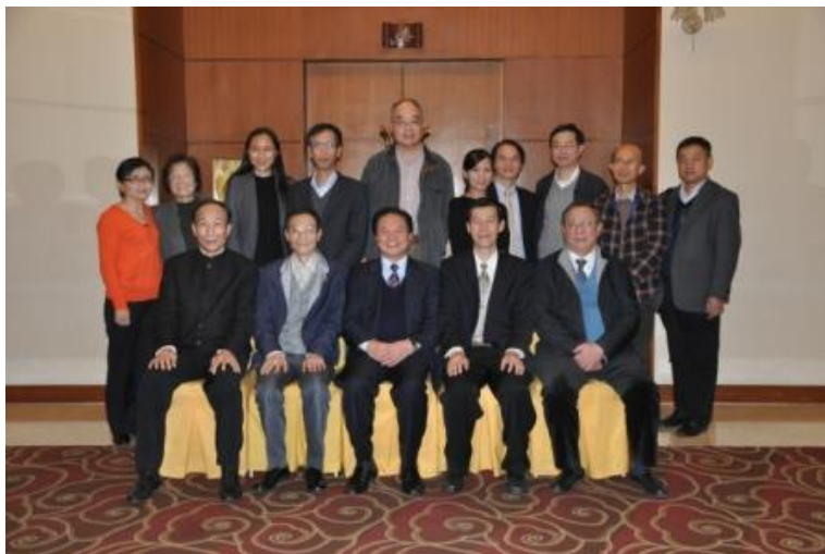
圖 3：2015 中山思想學術研討會全體出席代表合影

為擴大參與，本館於本次研討會之工作會議中，提案邀請「財團法人中山學術文化基金會」加入成為主辦單位之一。「財團法人中山學術文化基金會」係我國各界為紀念國父孫中山先生百年誕辰及闡揚中山思想學說與獎助學術研究為目的，於民國 1965 年 11 月 12 日國父百年誕辰紀念日所成立的基金會，現任董事長為許水德先