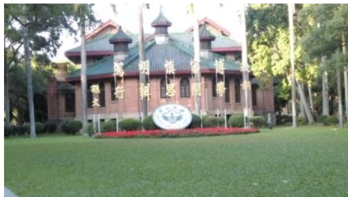
圖 12:出席代表參觀廣東中山大學

科學研究、文化學術與人才培養的重鎮。當時的校名為國立廣東大學，並由國父孫中山先生親筆題寫校訓：「博學、審問、慎思、明辨、篤行」。1926 年孫中山先生逝世後，為紀念孫中山先生遂改名為國立中山大學。