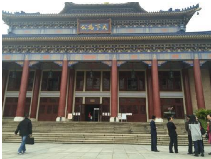
圖 5：出席代表參觀廣州中山堂

於 12 月 14 日下午，透過主辦單位的安排，前往參訪廣州市中山紀念堂，該紀念堂位於廣東省廣州市越秀區東風中路 259 號，曾是明代廣東督司、清出巡府院署、清末撫標箭道位址。辛亥革命後為廣東省督軍署，廣州軍政府之所在。1921 年 5 月 5 日孫中山先生在廣州就任非常大總統時，就將總統府設於此。後因陳炯明叛變，