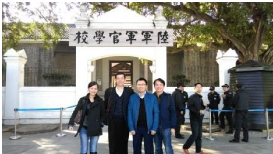
圖 10：本館人員與黃埔軍校舊址紀念館合影

於 12 月 17 日上午主辦單位安排前往參觀黃埔軍校舊址紀念館，該館位於廣州市黃埔區長洲島。該紀念館成立於 1984 年 6 月，是依託黃埔軍校舊址，以陸軍軍官學校發展歷程，為展示中心內容的紀念館，目前隸屬廣東革命歷史博物館。