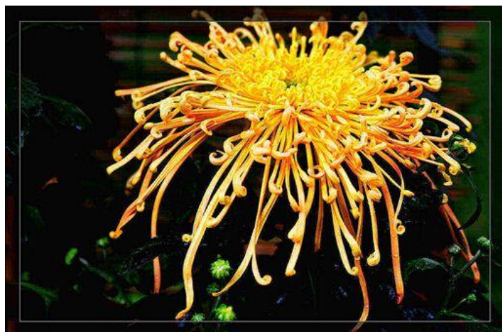
圖 9：廣州 2015 首屆黃花節黃花展

目前該園區為免費參觀，提供民眾休閒娛樂，本館同仁拜訪當日為週一上班日，於園區內民眾扶老攜幼遊客如織，花卉的佈置也讓園區生氣盎然。由於該園區甫辦理完畢黃花節，從留下來的布景規模中，仍可一窺當時辦理活動時之盛況。由於「黃花」即「菊花」，辦理花卉展不但可提供民眾緬懷革命先烈，亦可美化環環境，值得本館借鏡。