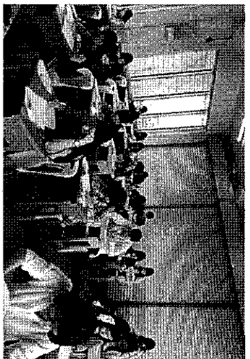
曼德勒考區第一考場 試場情形