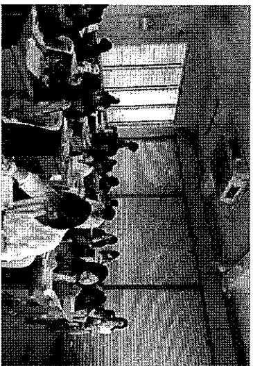
曼德勒考區第一考場 襄試人員巡查考場