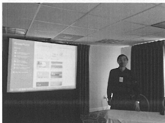
於邁阿密經濟與金融國際研討會中進行論文發表