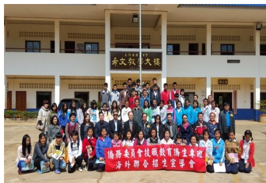
團員及與會人員在興華中學操場合影