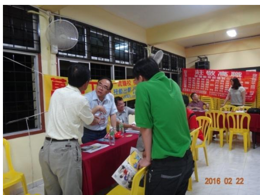
學生及家長至萬能工商攤位洽詢