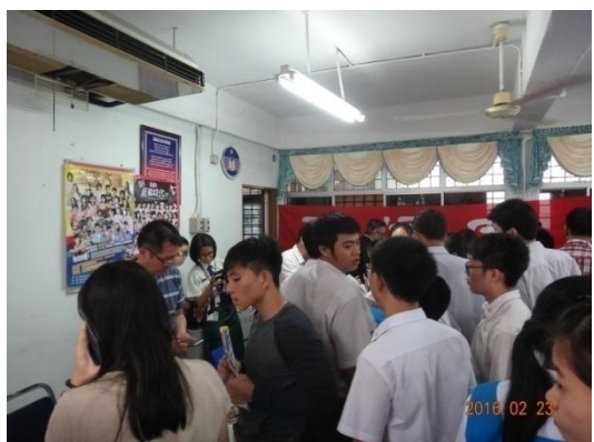
師生及家長至各校攤位洽詢