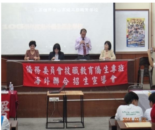
南華國民型中學黃校長說明本團來訪目的