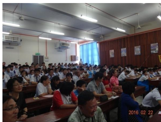
學校師生出席踴躍