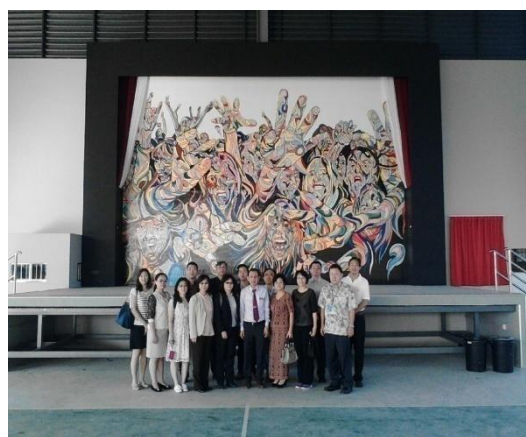
南華國民型中學黃校長引領本團於校園合影