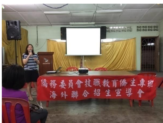
海外信用保證基金解說就學貸款方案