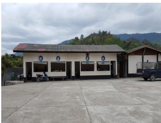
聖心中學校園一隅