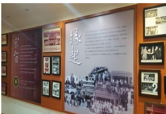
馬來西亞留臺聯總一隅