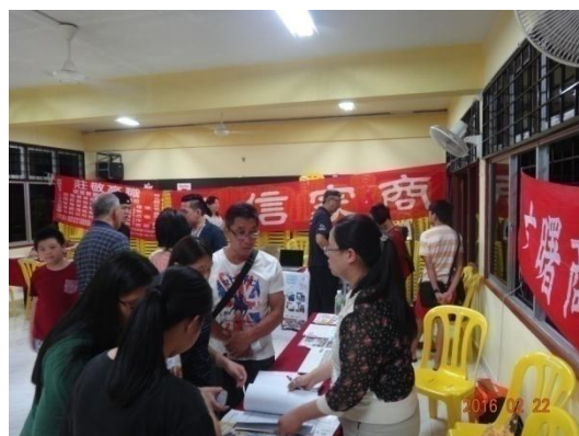
學生及家長至各校攤位洽詢