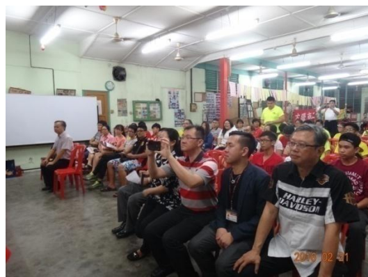
道鵝慈善劇社現場坐無虛席