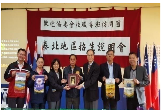
本會及各校與楊校長互換紀念品後合影