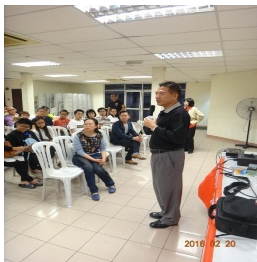
莊敬高職招生宣導