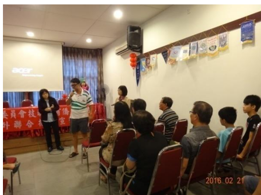
家長詢問就讀專班問題