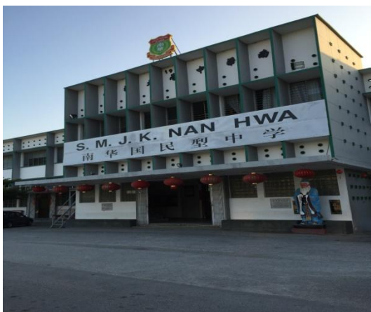
南華國民型中學校園一隅