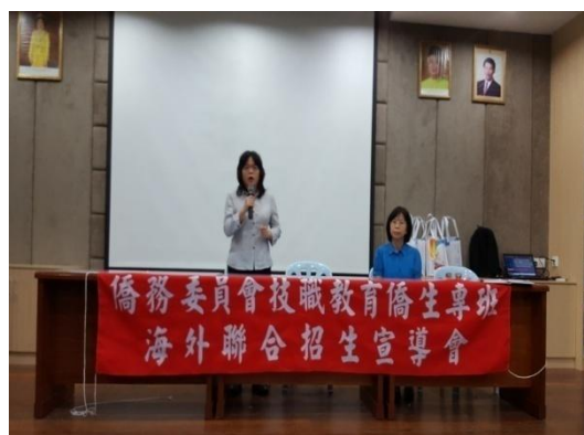
本會僑生處科張長說明僑生專班辦理資訊