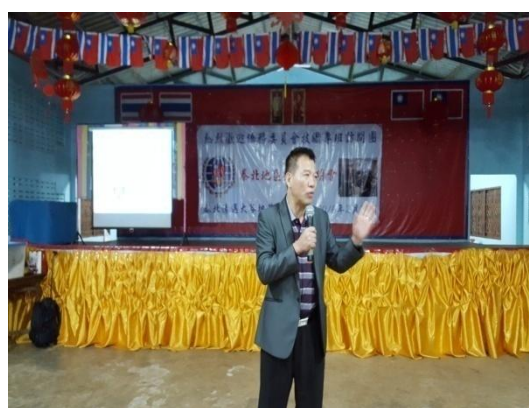
莊敬高職招生宣導