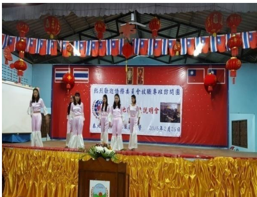
華興中學安排迎賓舞歡迎本團蒞臨