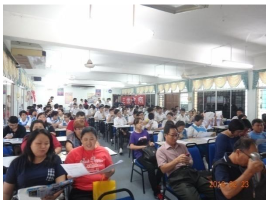
師長、學生研讀宣導摺頁