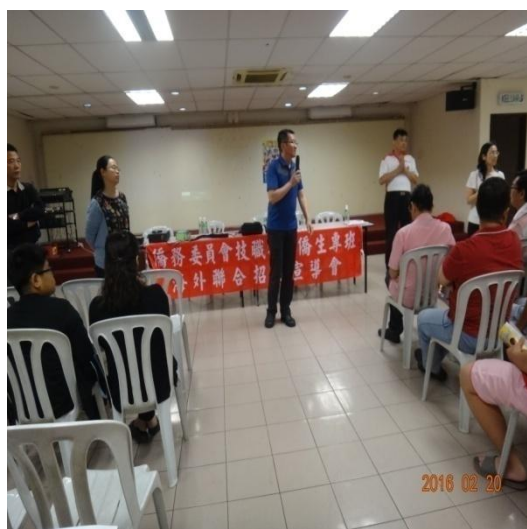
萬能工商招生宣導