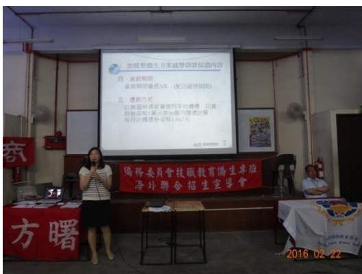
海外信用保證基金代表解說本專班就學貸款方案