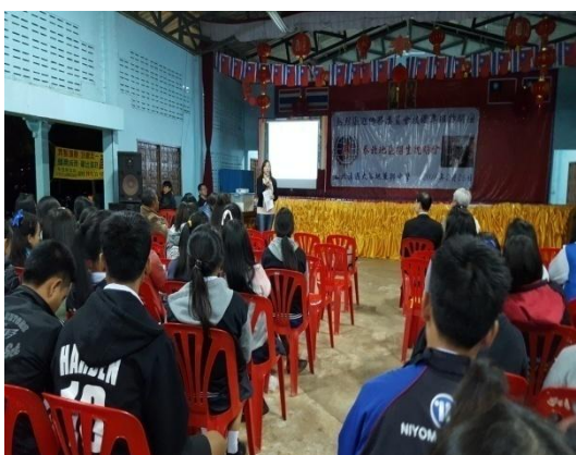
海外信用保證基金說明本專班就學貸款內容