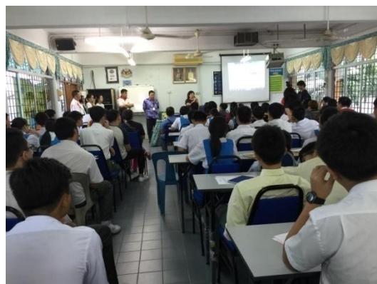
方曙商工招生宣導