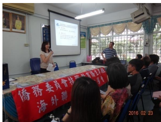
海外信用保證基金代表解說本專班就學貸款方案