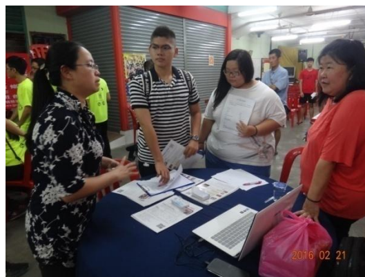
師生及家長至方曙工商攤位洽詢