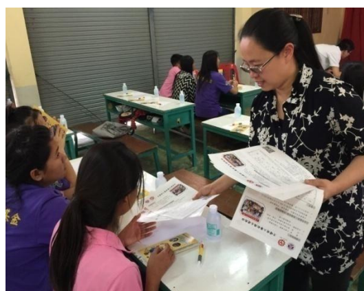
方曙商工招生宣導