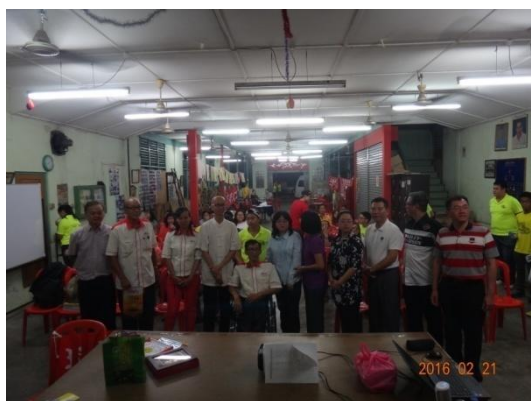
本團成員與道鵝慈善劇社宣導說明會出席人員合影