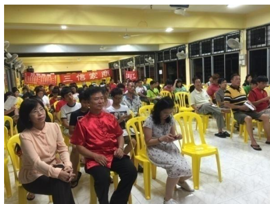
與會人員仔細觀看宣導短片