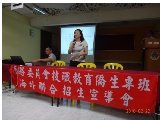
海外信用保證基金代表解說本專班就 學貸款方案