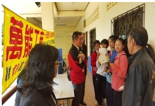
師生至萬能工商攤位洽詢