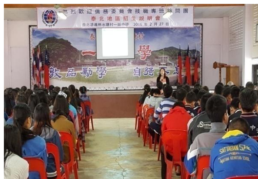
海外信用保證基金說明本專班就學貸款內容