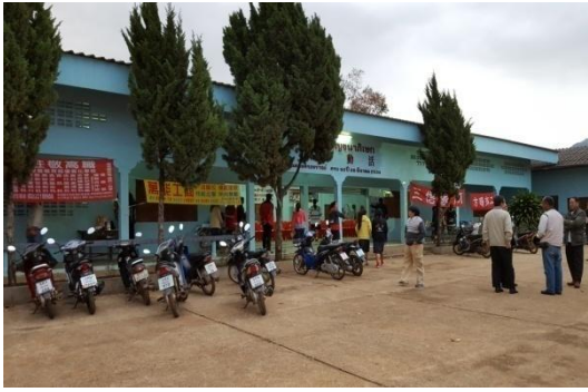
大谷地村活動中心外觀