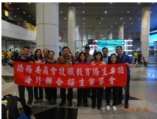
駐馬來西亞處林秘書與留臺聯總代表 前來接機