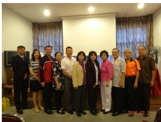
本團成員與霹靂留臺同學會成員合影