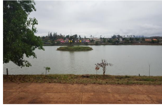
大谷地村活動中心前水池