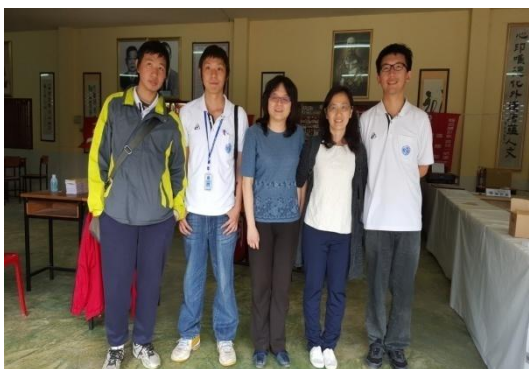
本會人員與替代役男合影