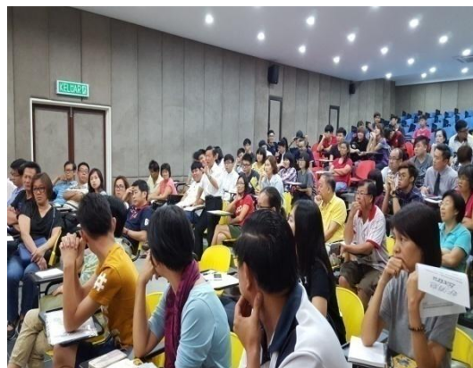
與會人員仔細聆聽家長提問