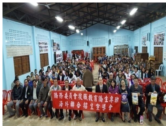
團員及與會人員在大谷地村活動中心合影