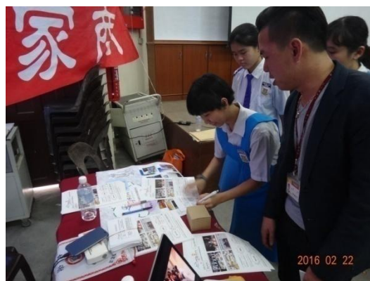
學生至三信家商攤位洽詢