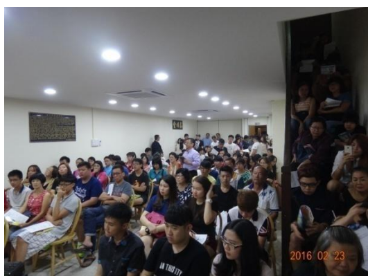
宣導會場人潮爆滿