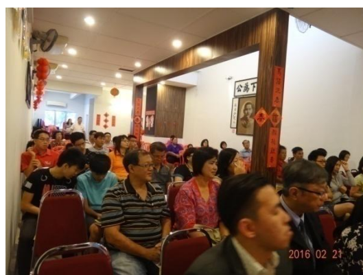
與會人員觀看宣傳短片