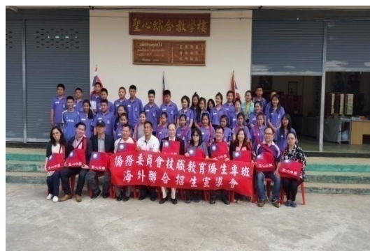
團員及與會人員在聖心中學廣場合影