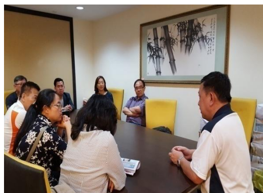
團員及留臺聯總代表於會議室交換意見