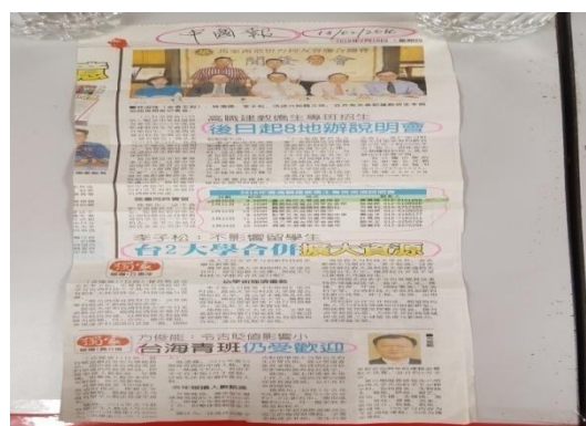
當地媒體報導本次宣導時間及地點