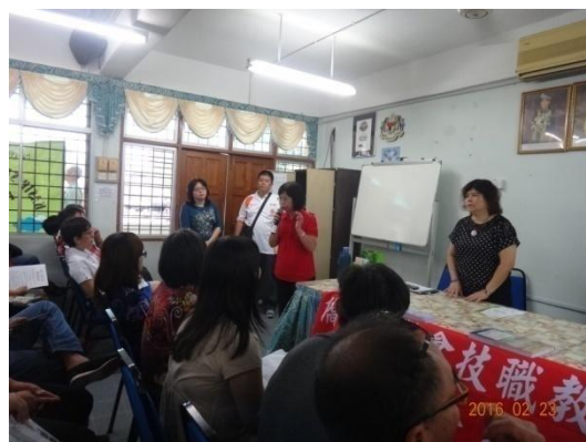
駐馬來西亞代表處林秘書回復提問