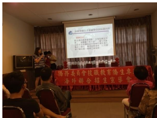
海外信用保證基金解說就學貸款方案