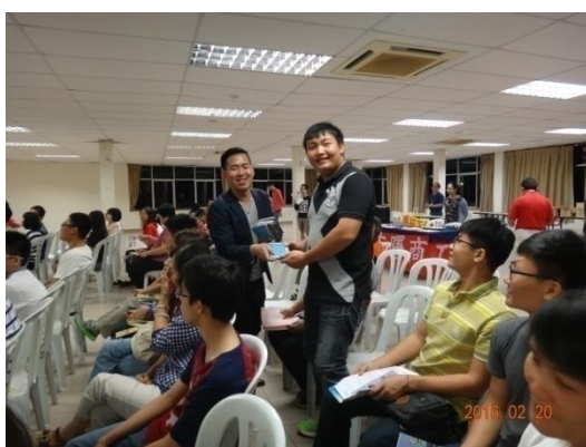
現場舉辦有獎徵答，得獎人獲贈僑委 會精美贈品