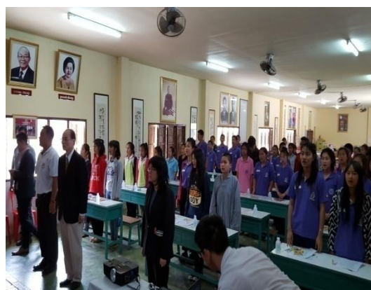
宣導會前唱中華民國及泰國國歌