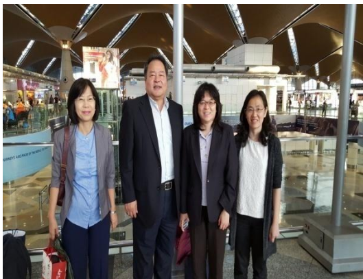
駐馬來西亞代表處林組長及林秘書前來送機