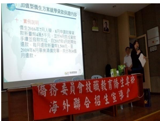
海外信用保證基金代表解說本專班就學貸款方案