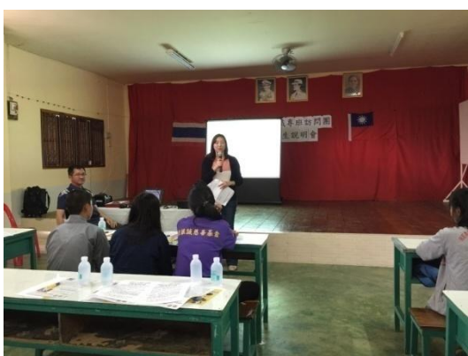
海外信用保證基金說明本專班就學貸款內容