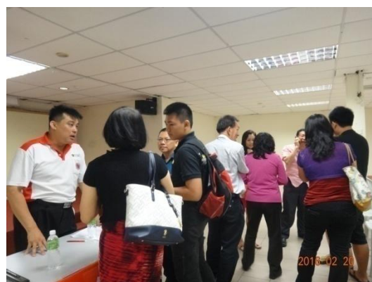
師生及家長紛至各校攤位洽詢