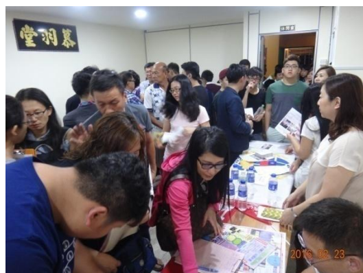
各校攤位萬頭鑽動