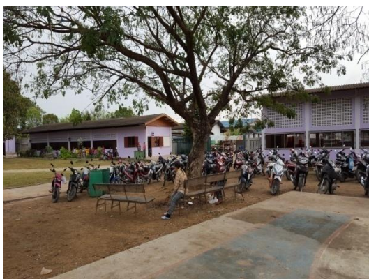
一新中學校園一隅