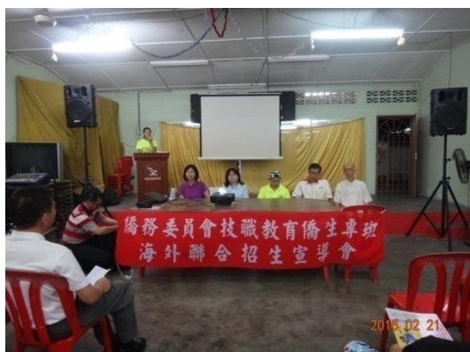
道鵝慈善劇社司儀解說宣導說明會目的