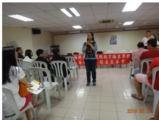
方曙商工招生宣導