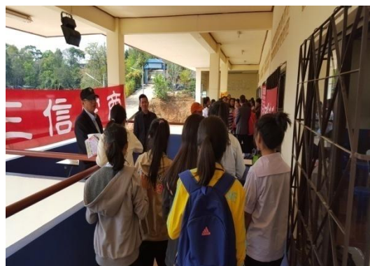
師生至三信家商攤位洽詢