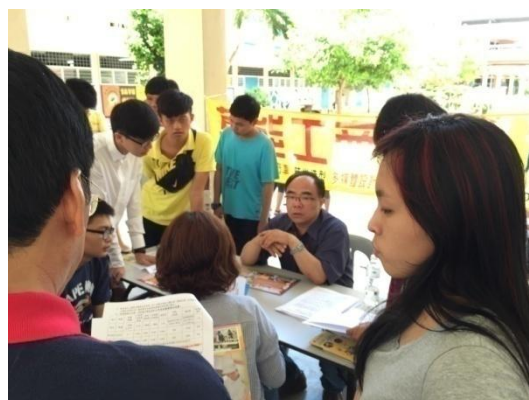
師生及家長至萬能工商攤位洽詢