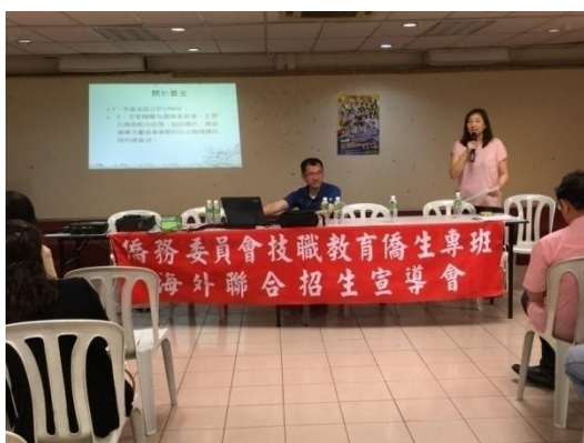
海外信用保證基金解說就學貸款方案