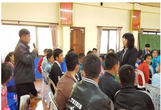
升學輔導老師提問