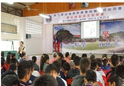
莊敬高職招生宣導