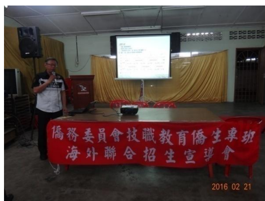
三信家商招生宣導