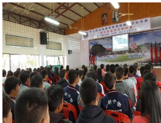
出席人員仔細觀看宣導影片