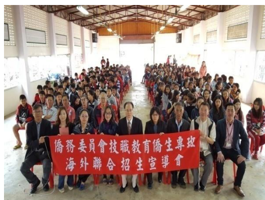
團員及與會人員在一新中學禮堂合影