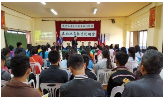
泰華文教服務中心盧主任介紹與會人員