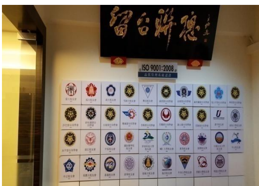
赴馬來西亞留臺聯總參訪