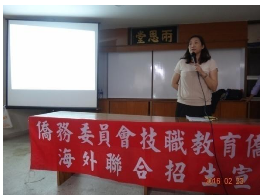
海外信用保證基金代表解說本專班就學貸款方案