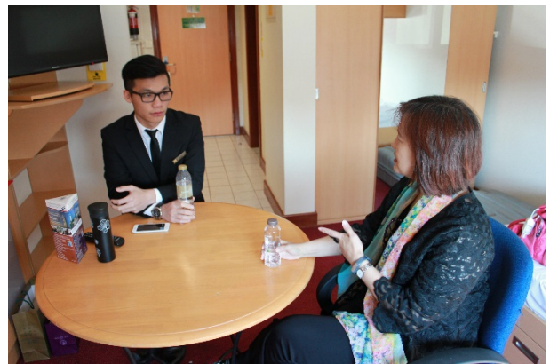
學生宿舍並與學生個別談話