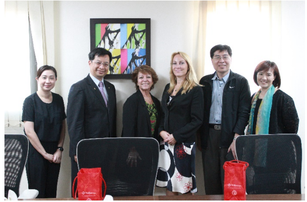
與英文及旅館專業老師合影