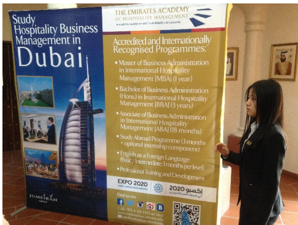
航運系學生英文導覽校園參觀