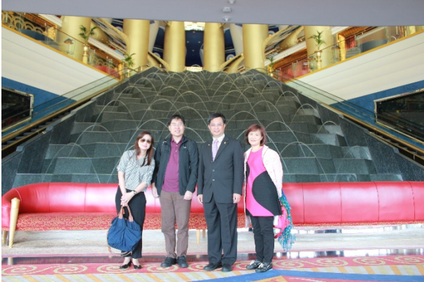
一行人在帆船酒店大廳合影