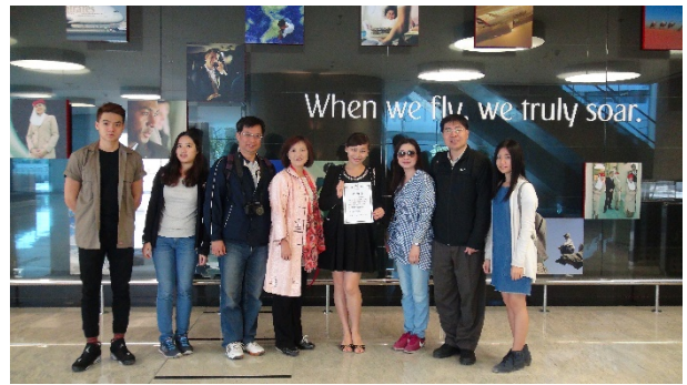
參觀阿聯酋航空總部並與校友合影