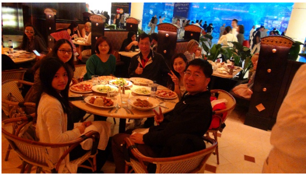
與 EAHM 研修學生共進午餐