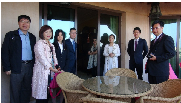
參觀 Madinat Jumeirah Hotel