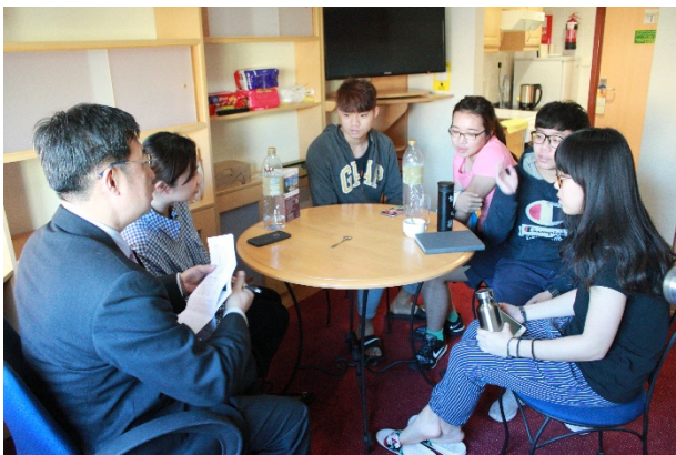
與學生團體座談會