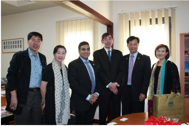
拜訪院長及副主任合影