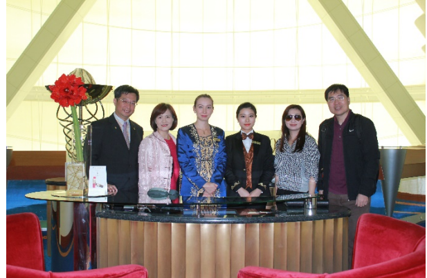
與帆船酒店客房管家合影