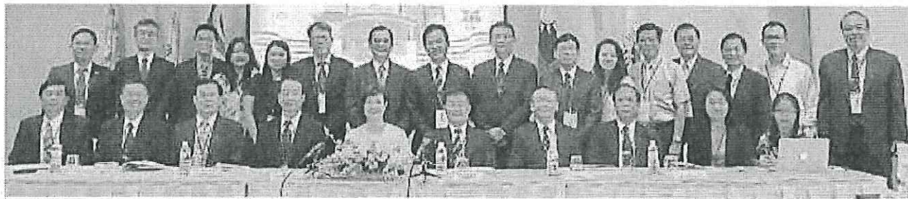
第 16 届海外台湾学校董事长、校长、家长会长联系会议全体代表。

他说，三长会议是东南亚 3 国 5 校与台湾教育部的沟通平台，也是唯一的联系与交流管道，在此大家不仅能分享各校的教学成果，也能商讨学校永续发展的对策。