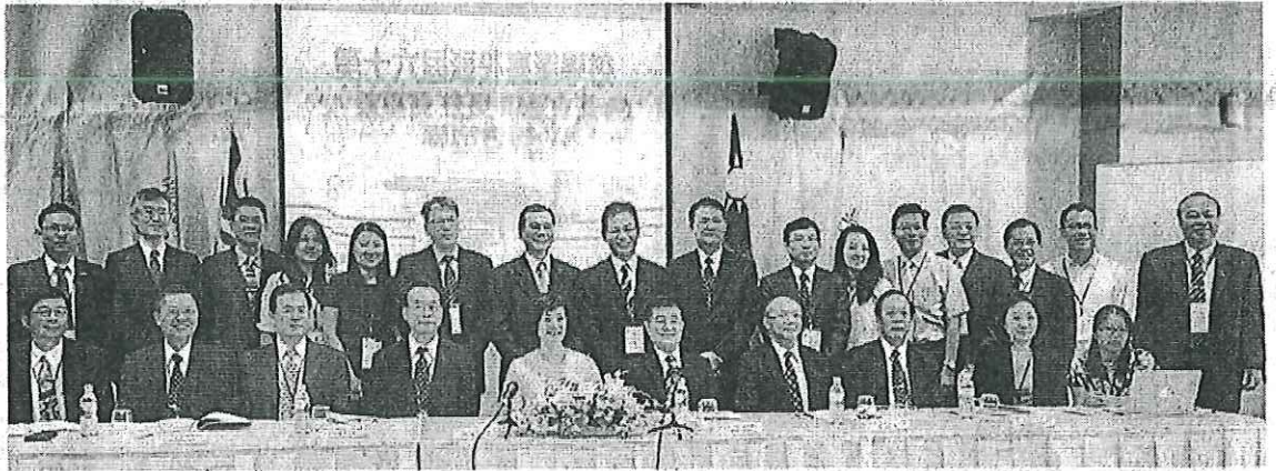
■3个国家5所台校及台商代表，齐聚在北海进行联席会议。

(北海12日讯)台湾驻大马代表处程祥云公使指出，台校是因台商而成立，由于受到收生条件的约束，若没有新一波的台商入驻大马，就会直接冲击台校的学生人数。