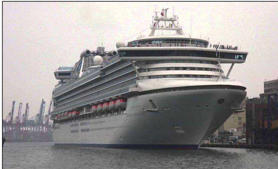
藍寶石公主號靠泊基隆港

此外，航行亞洲地區的亞洲船隊，如藍寶石公主號、鑽石公主號及黃金公主號等，船舶噸位介於 10.8 ~ 11.6 萬噸之間，約可搭載 2,600 人。