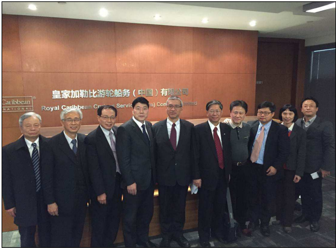
與皇家加勒比於會後合影