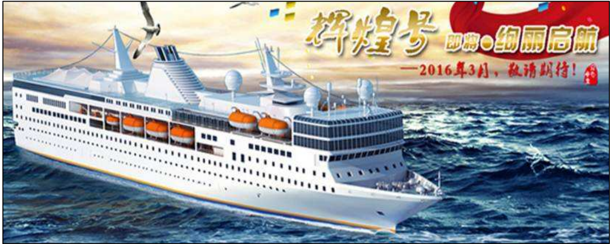
太湖國旅旗下的輝煌號郵輪將投入營運