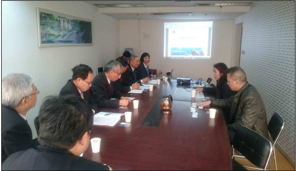
參訪團與太湖國旅有限公司進行業務拜會