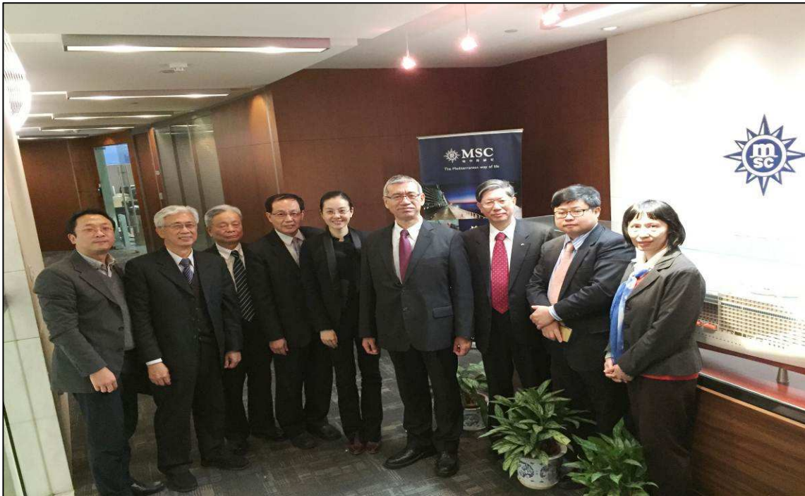
與地中海郵輪於會後合影