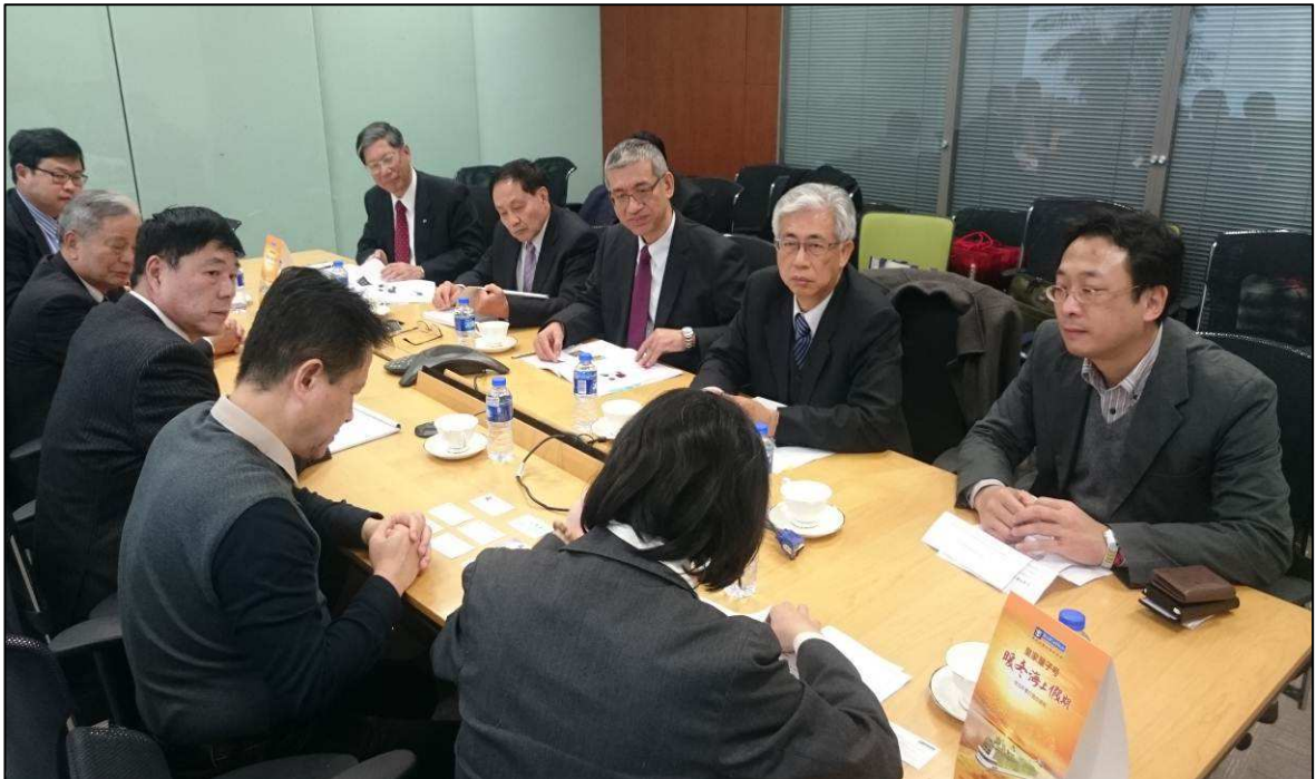
拜會皇家加勒比遊輪公司