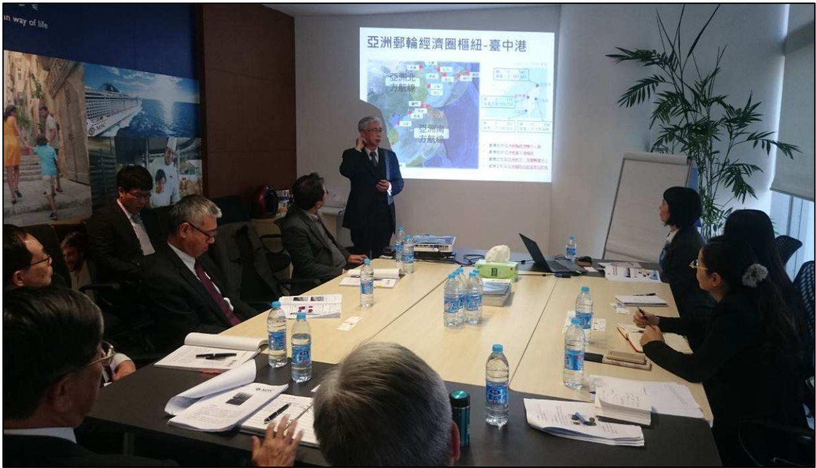
向地中海郵輪公司進行臺灣觀光業務簡報