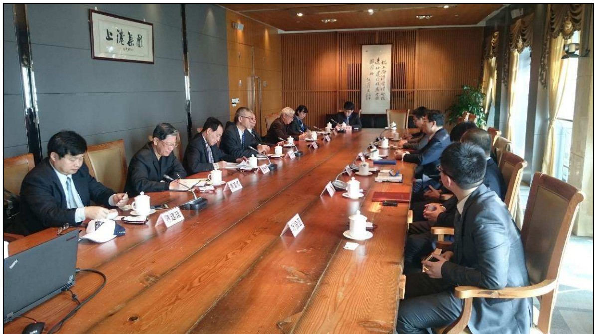
與上港集團進行業務拜會