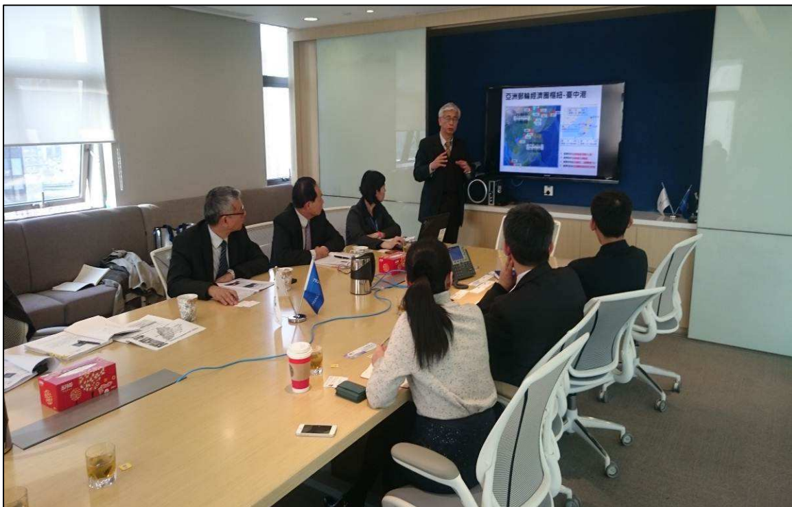
向公主郵輪簡報臺灣觀光資源