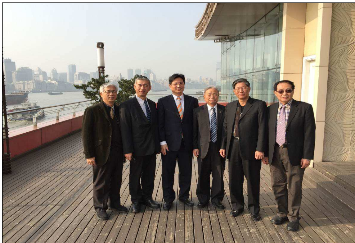
與上港集團嚴俊總裁(左三)合影