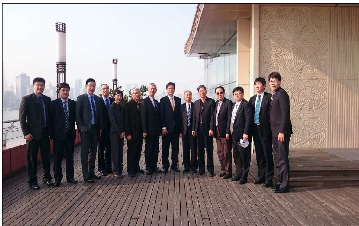
本次參訪團成員與上港集團一同合影