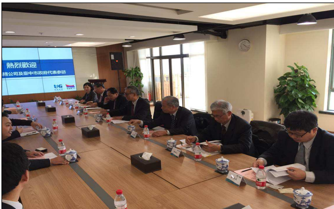
與中聯運通集團進行業務拜會