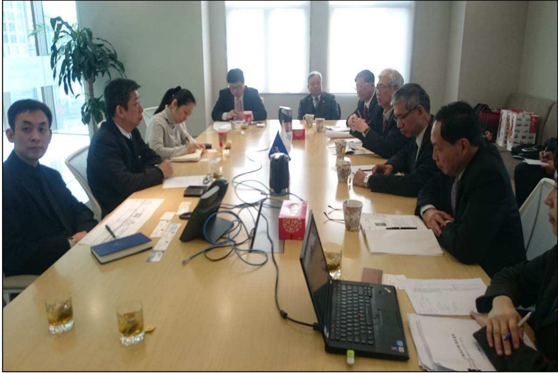
與公主郵輪進行業務會談