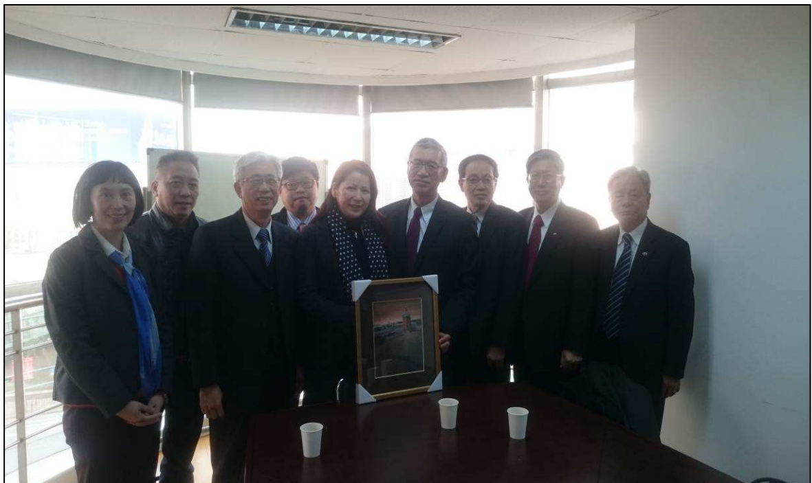
與太湖國旅於會後合影