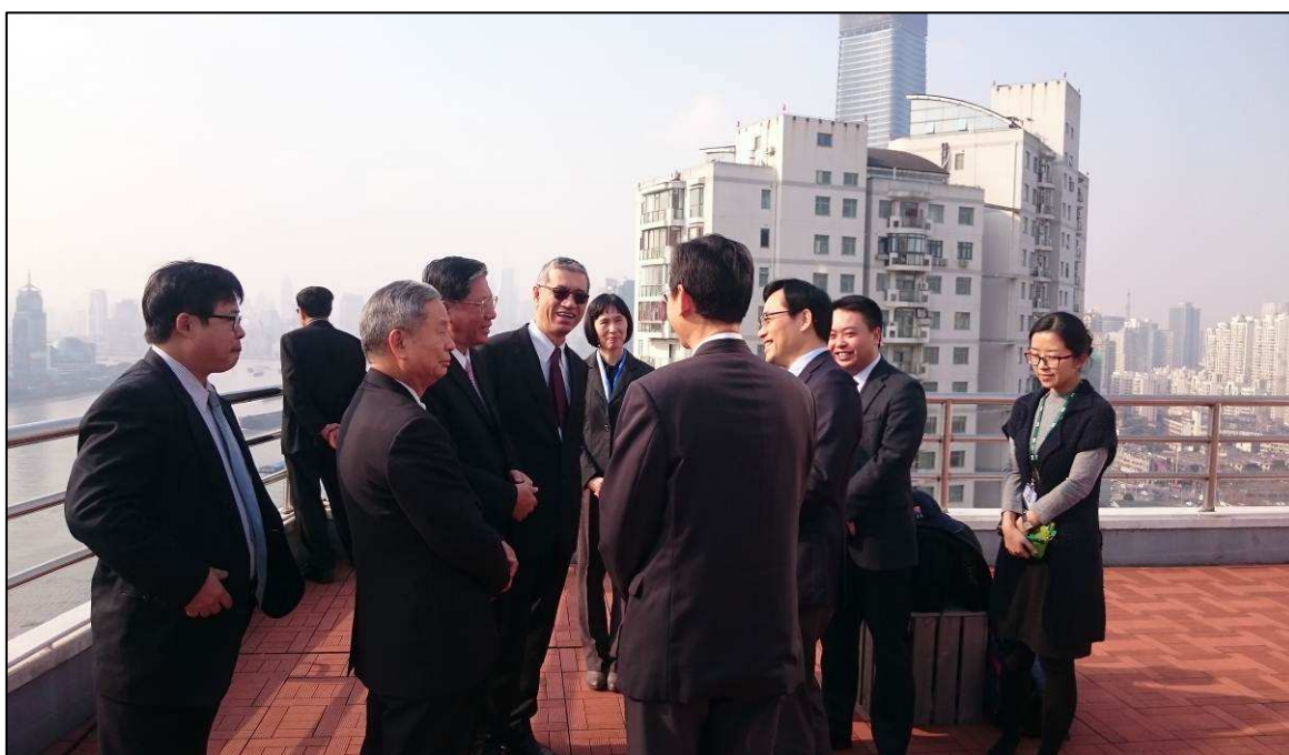
參訪團與中聯運通集團意見交流