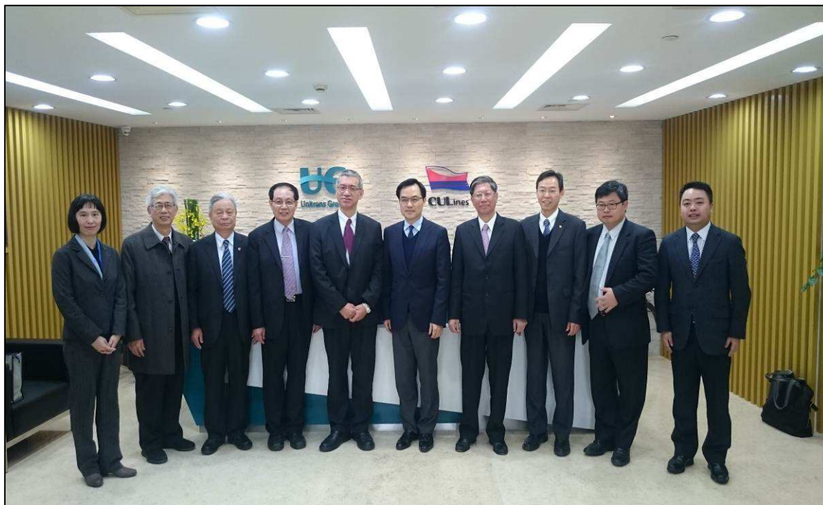
與中聯運通集團於會後合影