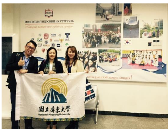
與蒙古姐妹校民族大學師長合影