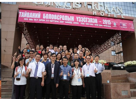
臺灣參展學校人員合照