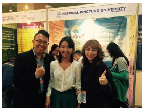
與本校蒙古校友朝倫合影