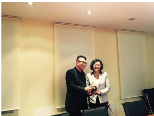
與蒙古姐妹校人文大學互贈禮品