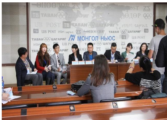
電視臺訪問介紹學校特色