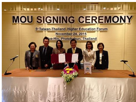
與 BSRU 簽署合作備忘錄