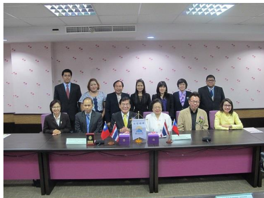
參訪 BSRU 洽談合作事宜