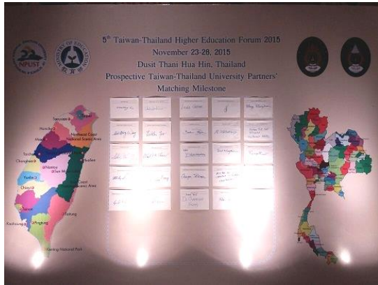
臺泰高等教育論壇合作學校簽名