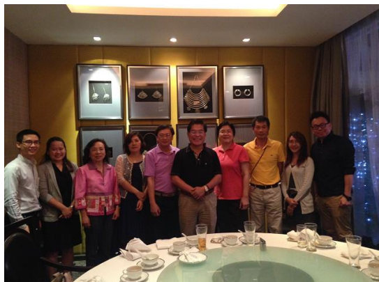
本校代表團宴請泰國高教代表洽談未來研究與交流合作計畫