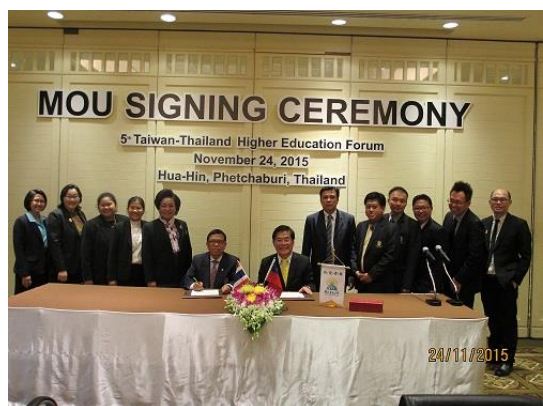
與臺泰高等教育論壇泰方主辦國 PBRB 簽署合作備忘錄