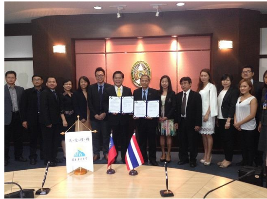
與 SSRU 簽署合作備忘錄