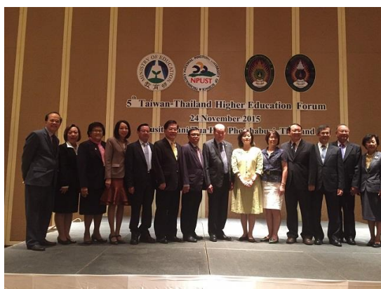
臺泰高等教育論壇參與校長合影