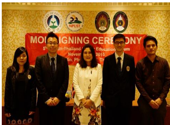
與 RBRU 簽署合作備忘錄後於臺泰高等教育論壇上合影留念