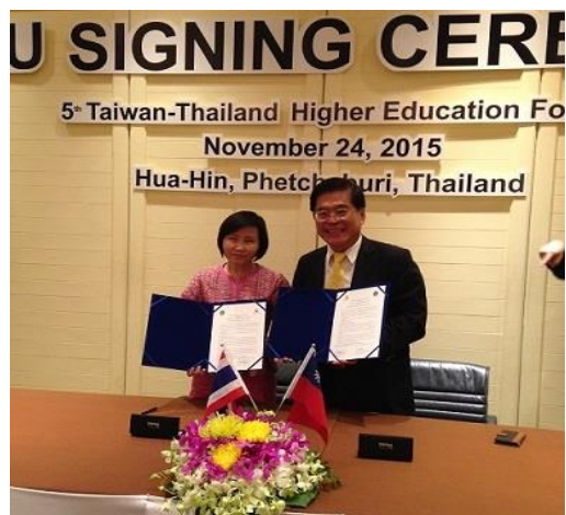
與 DRU 簽署合作備忘錄