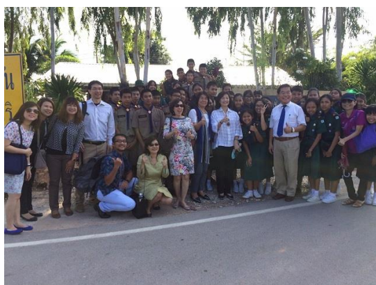
古源光校長參訪他央縣皇室花園計畫