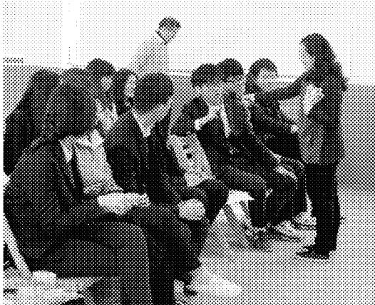
學生積極提問並踴躍參與有獎徵答