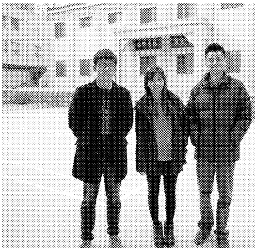
訪視 104 年 8 月派赴釜山華僑中學之第 153 梯替代役役男服勤狀況