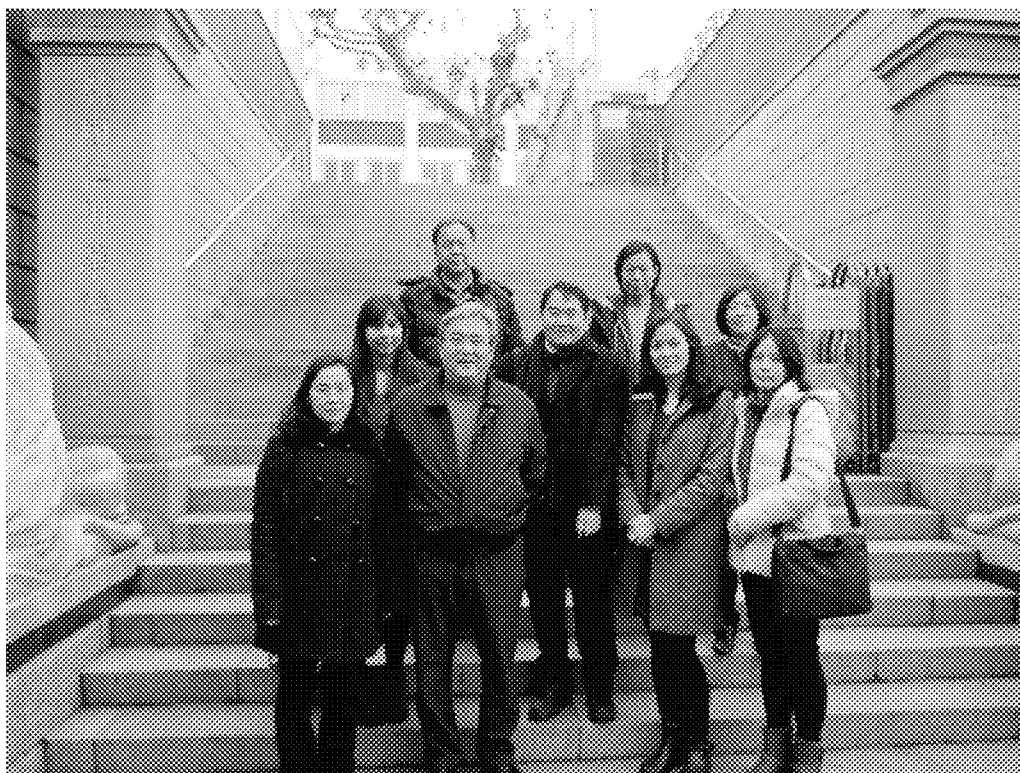
12月7日本會僑教及僑生處同仁於韓國仁川華僑中山中小學校校門前與校長(前排左二)及該校師長合影。