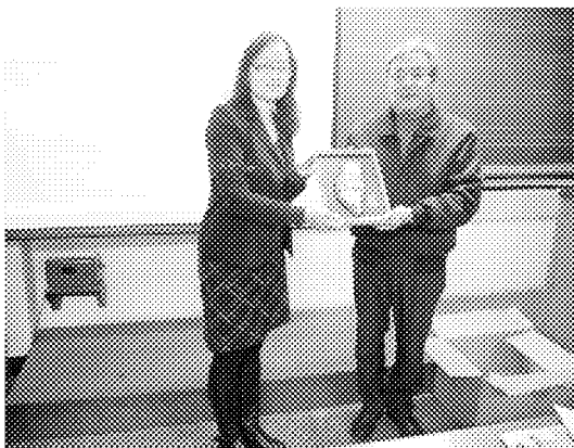
陳柏琴科長(左)致贈臺灣皮雕(舞獅)予仁川華僑中山中小學校長