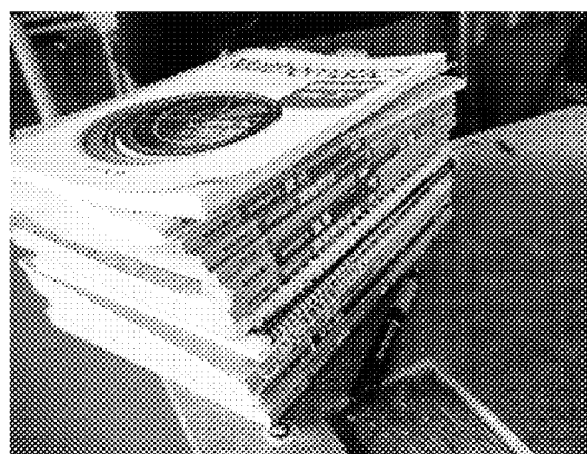
該校學生所使用之教材為本會核贈之 國內教科書(圖為高中南一版教材)