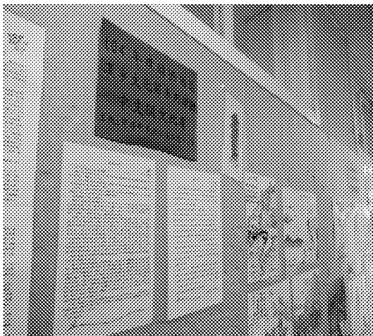
該校公布欄張貼當年度漢字文化節(本會專案補助之系列活動)得獎作品