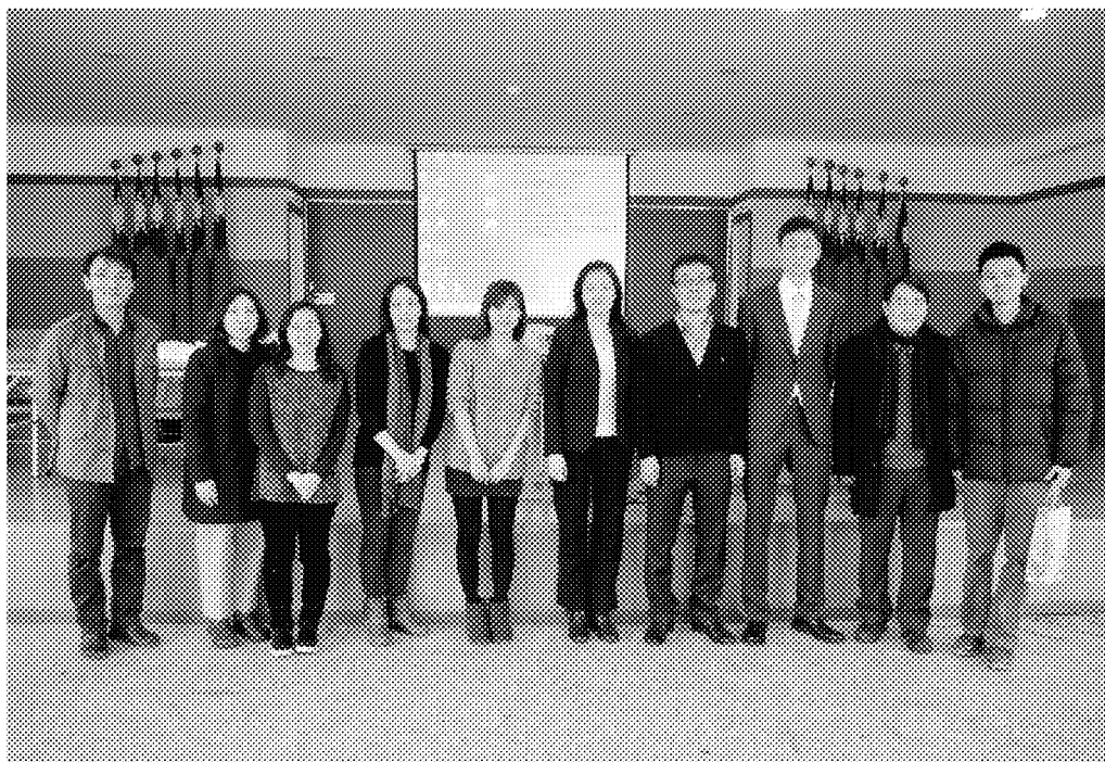
12月9日本會僑教僑生處同仁於釜山華僑中學大禮堂與校長(前排右四)及董事長(前排右三)及僑校師長們合影