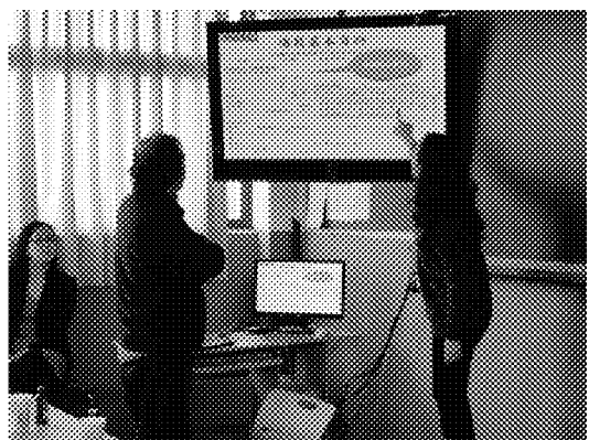
說明來臺升學流程 師長對簡報內容積極提問