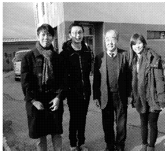
訪視替代役役男服勤狀況，並與漢城華僑中學校長(右二)合影