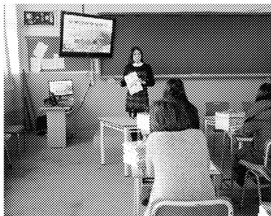
進行「中華函授學校」海外招生推廣， 宣傳 2016 學年函校新校務措施、新課程 特色暨中華函授學校新版學習網站 及學習平臺