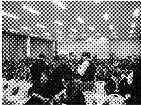
漢城華僑中學師生踴躍參與說明會