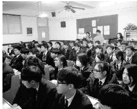
仁川華僑中山中小學學生仔細聆聽升學流程說明