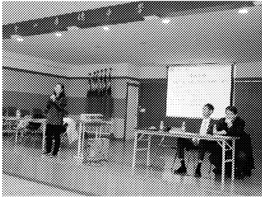
釜山華僑中學於禮堂舉辦本次座談會，講臺後方擺放數根中華民國國旗，顯示該校友我及認同之程度