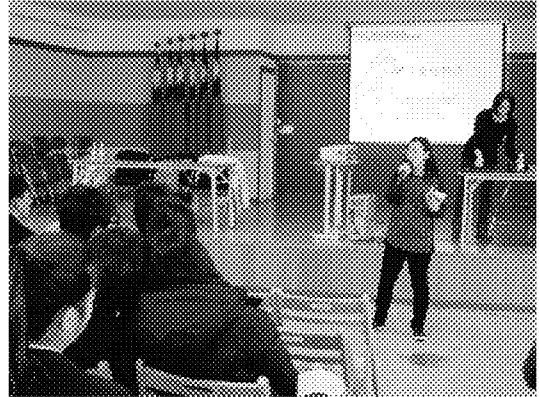
本會同仁進行業務說明宣導並與學生互動