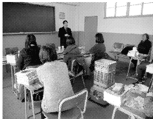
劉僑務秘書俊男說明本次來訪目的