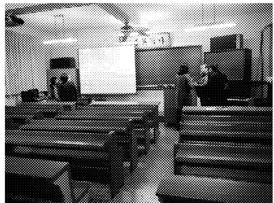
會後華僑青年會會長續與本會同仁洽詢僑教及僑生相關問題