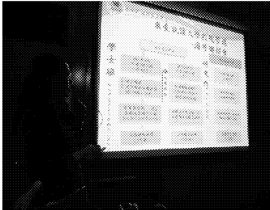
於仁川華僑中山中小學說明來臺升學輔導措施及申請就讀大學校院之流程