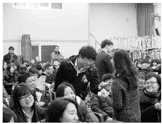
座談會之有獎徵答-學生答復提問並獲贈本會文宣品