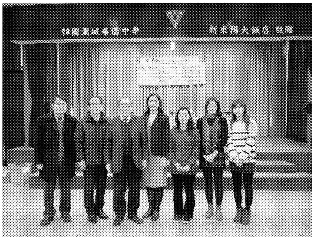
12月8日上午本會一行人於漢城華僑中學大禮堂與校長(前排左三)及首爾華僑青年會會長(前排左二)合影