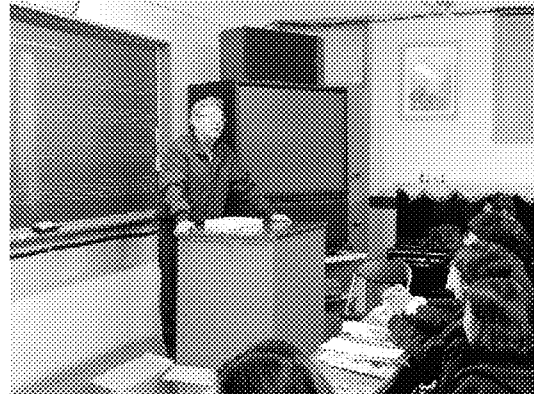
仁川華僑中山中小學校長對高二高三同學說明本團來訪目的