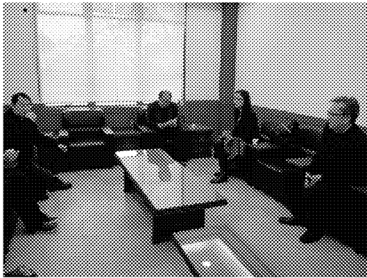
會前與漢城華僑中學師長溝通交流僑教及僑生業務