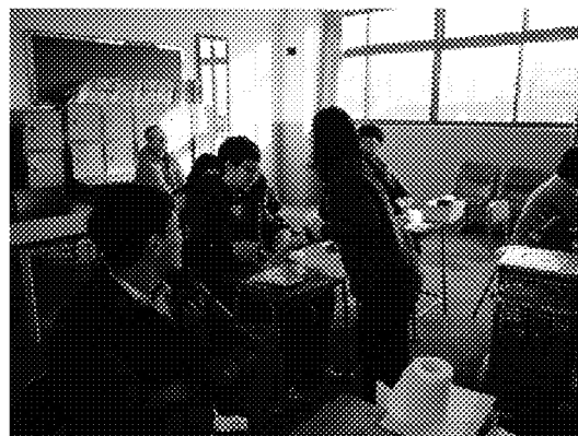
學生積極討論發問並於會後進行有獎 徵答-致贈本會文宣品