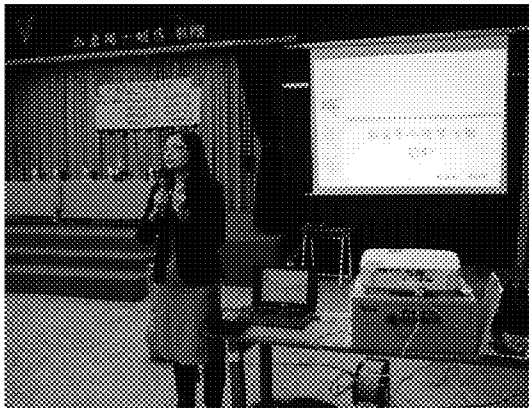
於漢城華僑中學介紹宣導本會華裔青年返臺研習活動及觀摩團業務