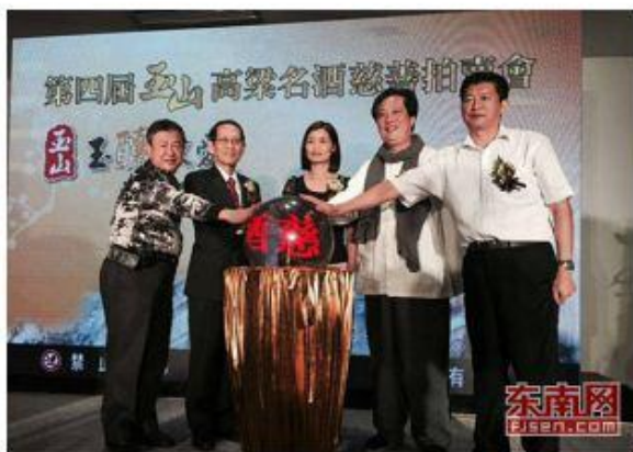
第四届玉山高粱名酒慈善拍卖会

声明: 本文由入驻搜狐媒体平台的作者撰写,除搜狐官方账号外,观点仅代表作者本人,不代表搜狐立场。