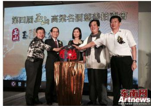
第四届玉山高粱名酒慈善拍卖会

东南网10月22日厦门讯(本网记者 陈新宇)22日下午,第四届玉山高粱名酒慈善拍卖会新闻发布会在厦门举行。记者从会上获悉,该活动将于12月3日亮相台北。届时,将拍卖36件由台湾及大陆著名的画坛名家同步投入创作的盛有陈年佳酿的瓷瓶精品,为慈善活动增添了两岸文创新交流的意涵。