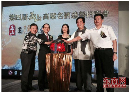
第四届玉山高粱名酒慈善拍卖会

2015-10-22 16:15:47 陈静宇 来源: 东南网 责任编辑: 陈静宇 我来说两句 分享到: 0 0