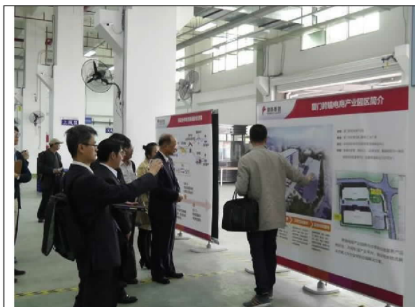
參訪象嶼快件中心倉庫（104/12/21）

至今該快件中心營運仍處虧損狀態（據業者表示預估 2015 年虧 600 萬元人民幣），為拓展業務，該公司過去 2 個月以固定包櫃模式鼓勵貨量較少的貨主使用快件服務，並與大陸東方及臺灣東立所成立的台北港國際物流公司合作，但因海空港快遞執法方式不同，貨主對不同運輸管道選擇及成本的考量，以及對原有供應鏈難以改變（固化）等因素，以致成效不彰。未來兩岸雙方除維持海運快遞的運能穩定外，如何找出市場區隔並提供誘因（如較低費率）來吸引其他渠道（方式）的運量，為後續努力的重要課題。