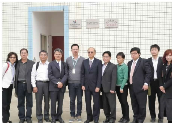
象嶼快件中心倉庫前合影（104/12/21）