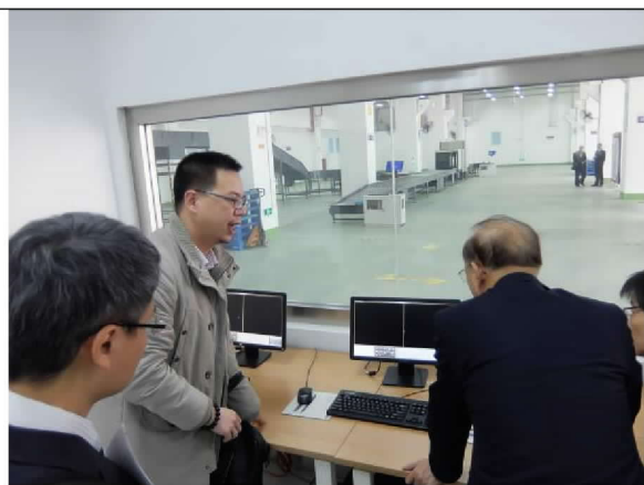
參訪象嶼快件中心倉庫（104/12/21）