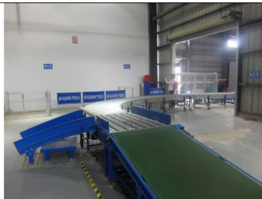
快件中心倉庫內一隅(104/12/24)