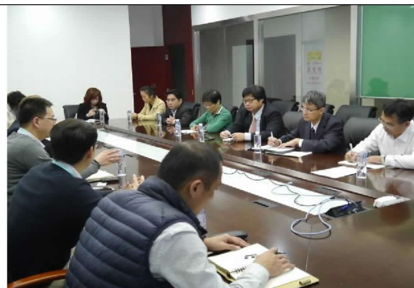
與易象通公司進行洽談（104/12/21）