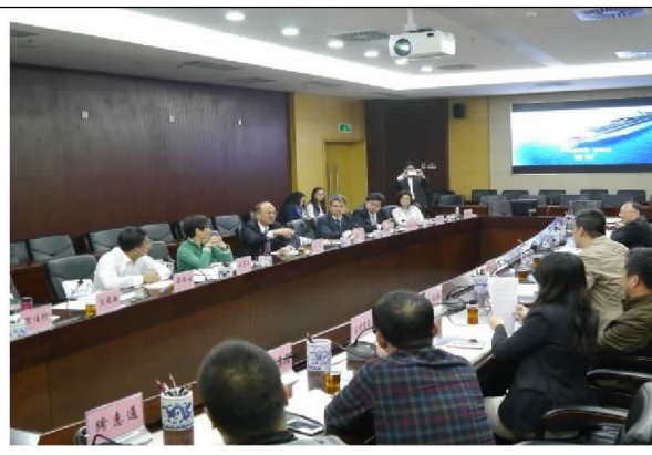
與廈門市商務局、廈門海滄區經濟貿易發展局及中國福建自貿區廈門片區管理委員會等進行座談(104/12/21)