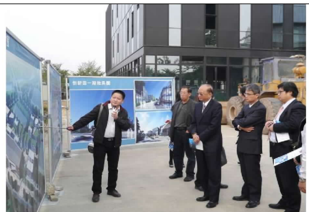
參觀廈門海滄區營運現況(104/12/21)