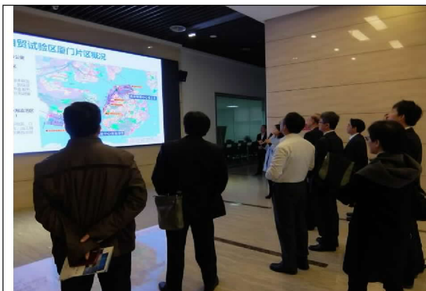
參觀廈門片區海滄區新創園(104/12/21)

廈門片區向下扎根的思惟，考量年輕人的特質及經濟條件，為青年創業家所規劃設置的新創園，以及所提供的優惠政策，值得台灣深思與借鏡。