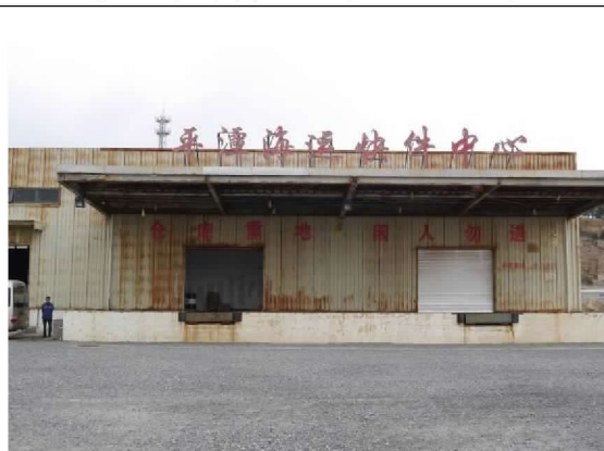
平潭海運快件中心(104/12/24)