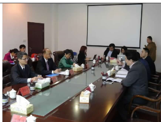
與管委會進行綜合座談(104/12/24)