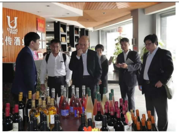
參訪廈門片區跨境電商保稅店 (104/12/20)