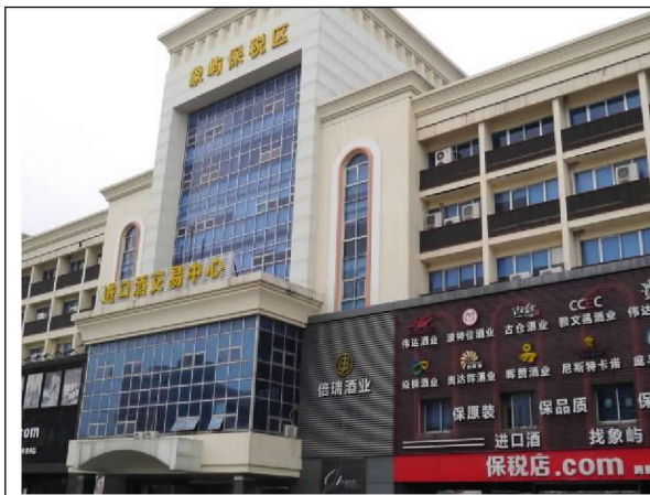
參訪廈門片區跨境電商保稅店 (104/12/20)