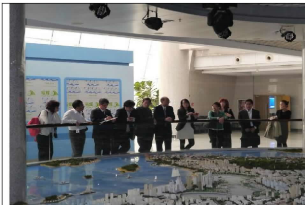
拜會廈門市商務局、廈門海滄區經濟貿易發展局及中國福建自貿區廈門片區管理委員會(104/12/21)