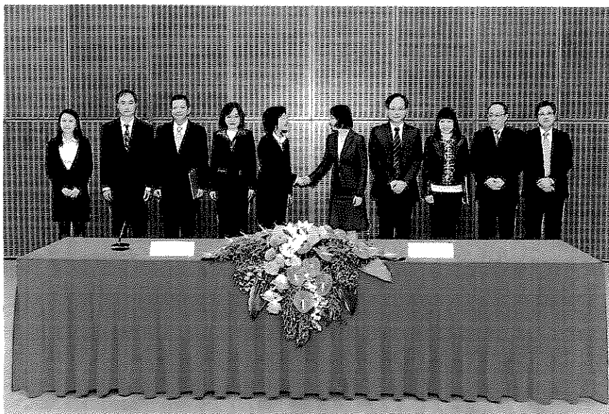
臺澳雙方簽署人及出席人員於簽署後合影