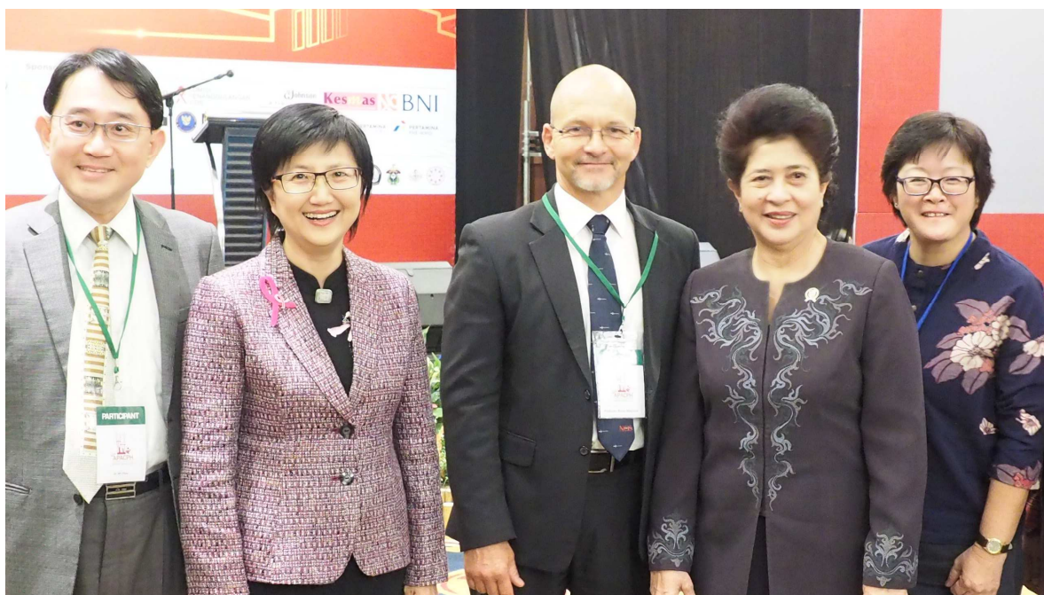
健康署邱淑媿署長(左 2)與印尼衛生部部長印尼衛生部部長 Nila Farid Moeloek(右 2)、台北醫學大學副校長邱弘毅(左 1)及與會專家學者合影

與會者認為臺灣有清楚的架構與嚴謹的成效評估，但大家感到好奇的是，為何臺灣不到 500 家醫院，能有約三成加入成為國際會員，而印尼有 2000 多家醫院，卻僅有不到 20 家(少於 1%)參與，到底臺灣是怎麼做到的？以及醫院是否需要增加很多人力與經費等。邱署長淑媿表示，印尼推動 HPH 才剛開始，已擁有這樣的積極度，只要持續推動，必會大幅拓展；她認為，推動過程中，要有醫院院長以及政府雙方面的支持；政府要提供方法以及提供小額計畫經費，讓醫院提出計畫、加速轉型並達到品質提昇，最好也能加強補助民眾接受預防醫學服務，以及將民眾健康促進與員工健康等項目納入醫院評鑑中，讓努力的醫院獲得肯定。