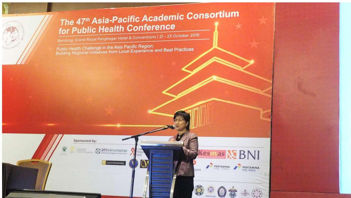
健康署邱淑媿署長於「The role of Public Health Professional in Health Development」場次演講，題目為「Promoting partnership and value-adding healthcare」