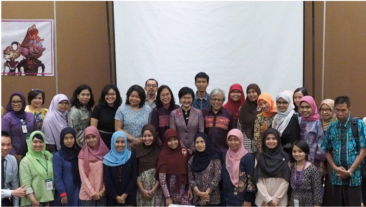
健康署邱淑媿署長(中立者)於演講後與參加人員合影

四、第4日（2015年10月23日）：返程由程研討會舉辦地點之萬隆市（Bandung）由陸運交通工具轉車抵達印尼雅加達(Jakarta)國際機場，搭機返回台灣。