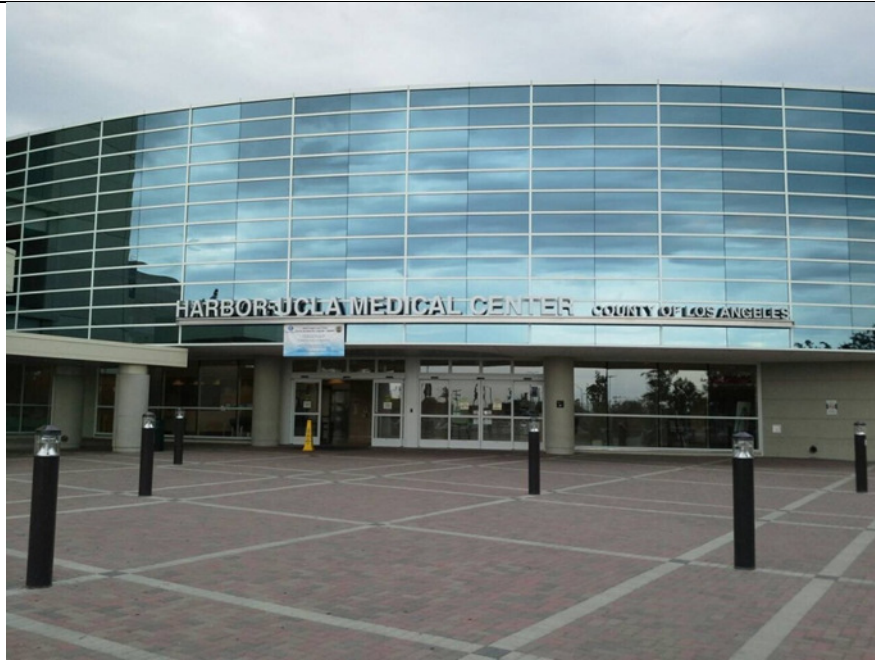
Harbor UCLA medical center 入口。