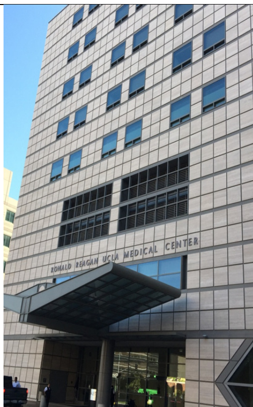
UCLA Ronald Reagan medical center ◦