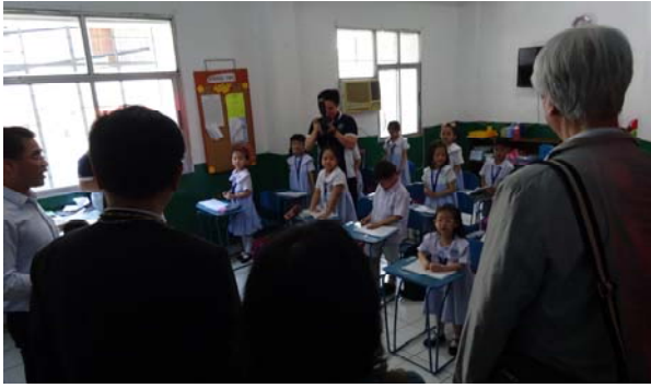
參訪幼稚園上課情形