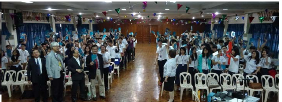
計順菲華中學學生活潑熱情