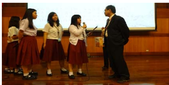
學生自發排隊踴躍提問