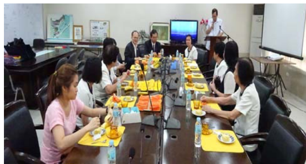
宣導會後與靈惠學院師長交流