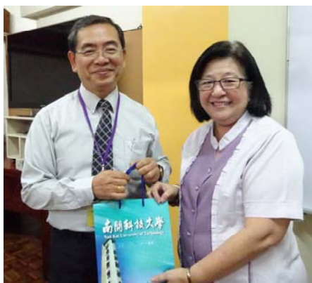
致贈禮品予中華中學