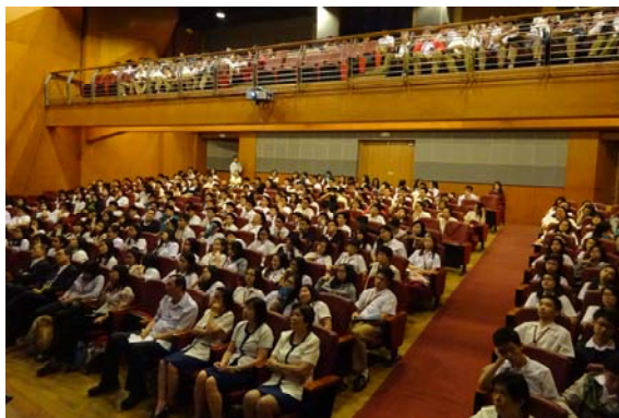
學生專心聆聽宣導說明會