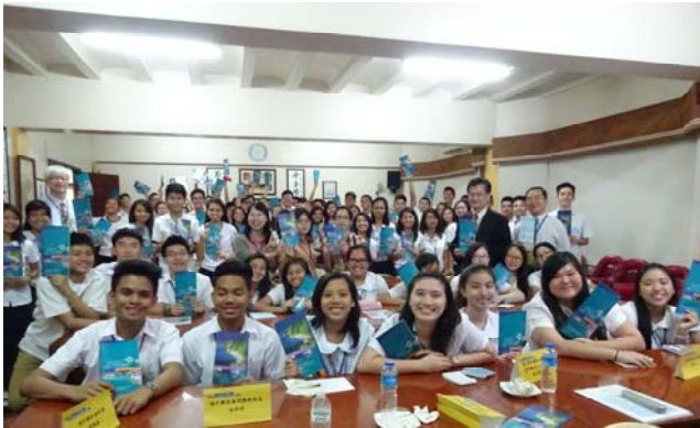
與中華中學同學合照