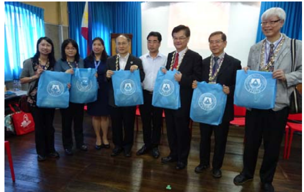
與聖軍中學互贈紀念品