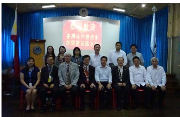
與聖軍中學師長及校友合影