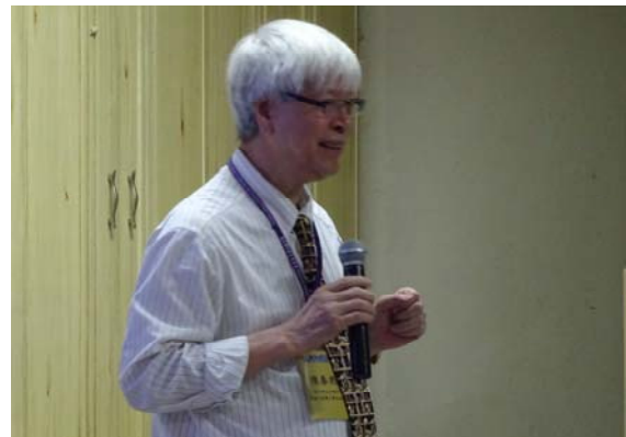
陳前副校長說明臺灣高教現況