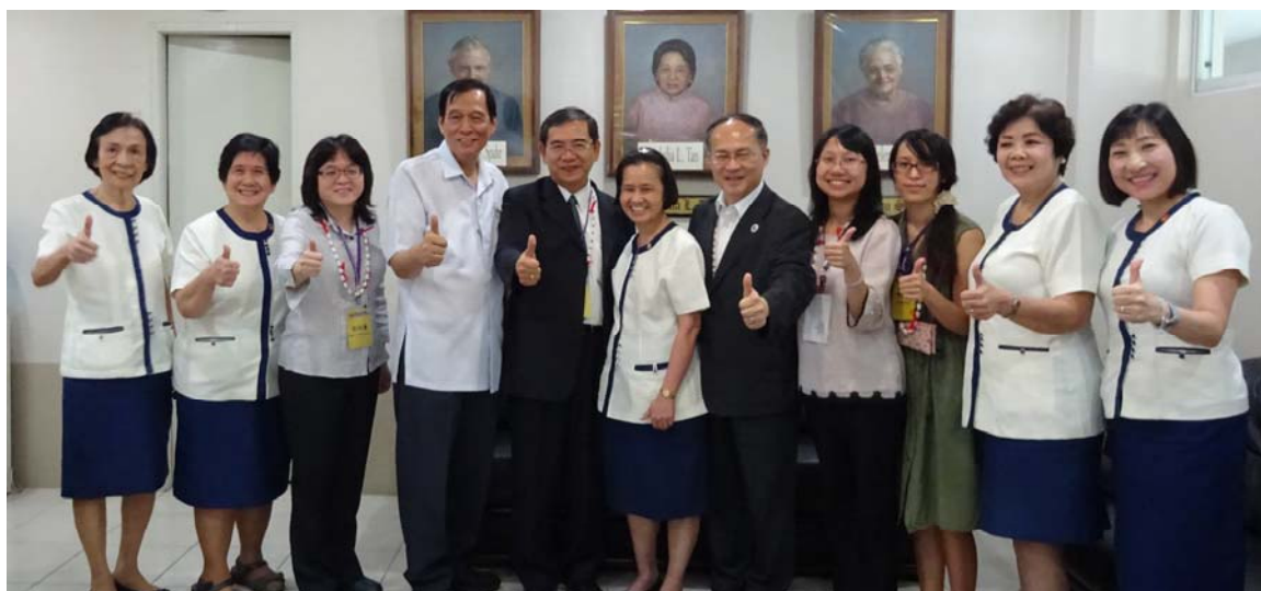
宣導會後與靈惠學院師長合照

行程第六天（9月19日）因擔心交通壅塞而延誤登機，因此提前於上午7時由旅館出發前往機場，惟班機因故延誤，預計中午12時35分即可抵臺，卻延誤至下午2時始回到桃園機場。本次宣導說明會行程感謝教育部、僑務委員會與菲華文教服務中心的協助與指導，也感謝六所華校校長及老師們熱情協助與接送，讓本次宣導行程圓滿結束。