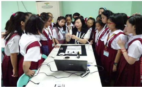
參訪書法課教學實況