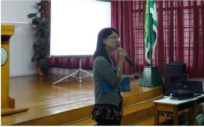
林組長珍妤解說海聯會申請程序