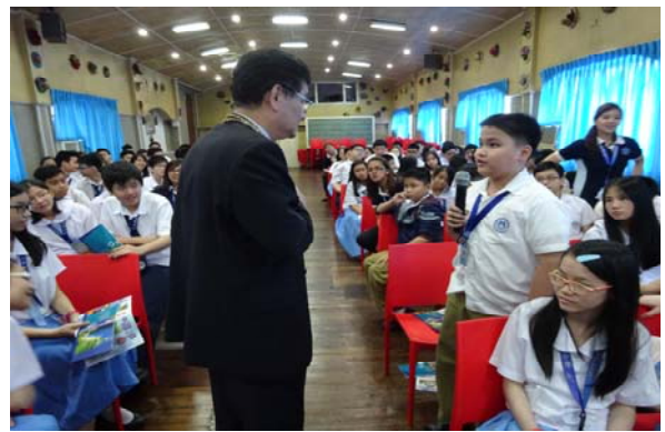
八年級學生踴躍發問