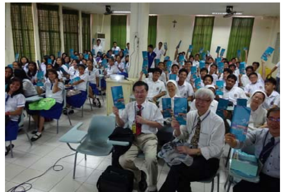
說明會現場同學反應熱烈