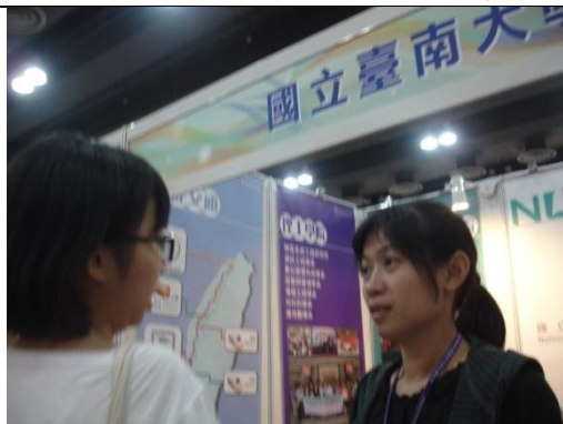
蔡佳恩組員回覆學生問題