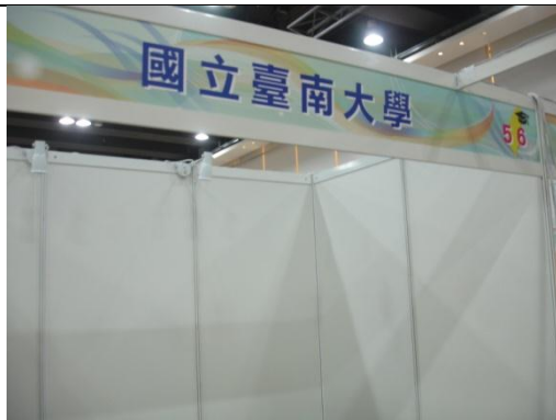
教育展攤位(場佈前)