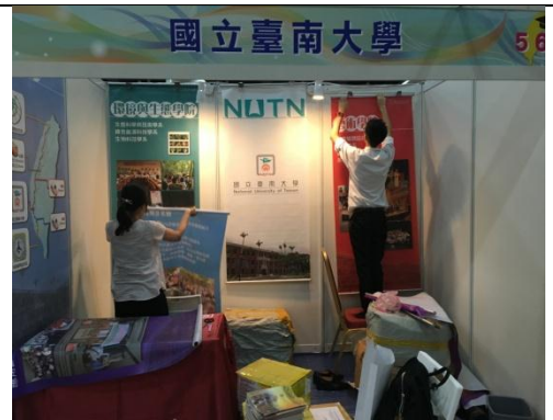
教育展攤位(場佈中)