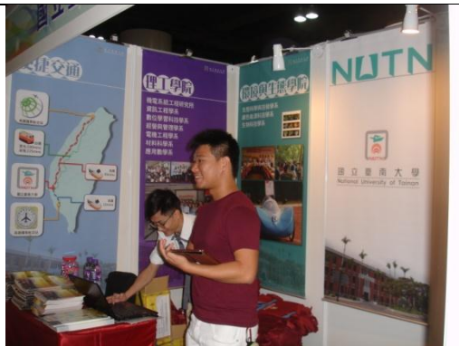
教育展攤位(場佈後)