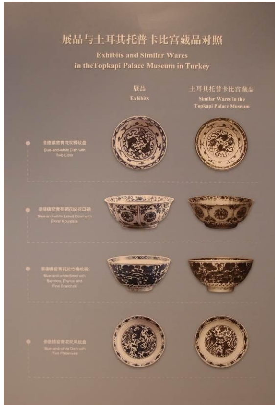
圖十七 上海博物館「明清貿易瓷展」展場牆面說明 2015年11月30日