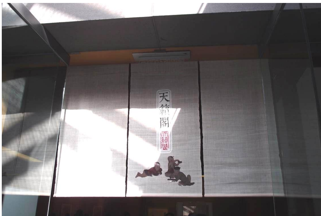
圖七 蘇州博物館「十洲高會—吳門畫派之仇英特展」 「天籟閣」展區 2015年11月28日