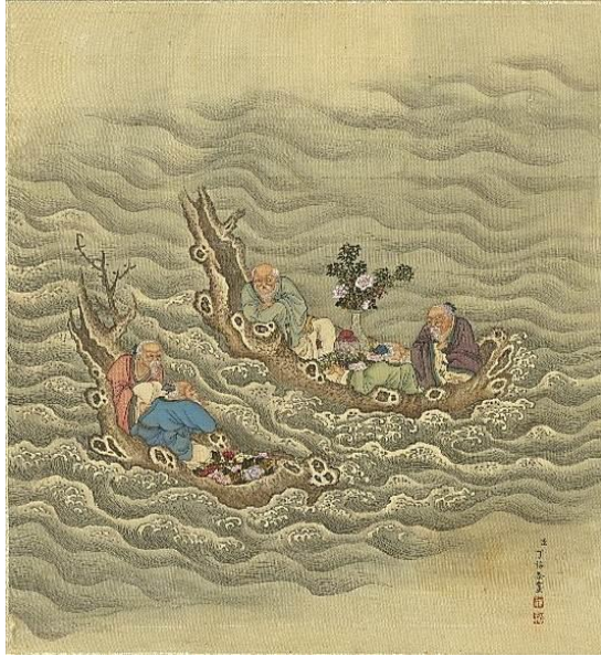
圖十五 清 丁裕 〈後天不老〉 第十二開 〈浮槎〉 國立故宮博物院藏