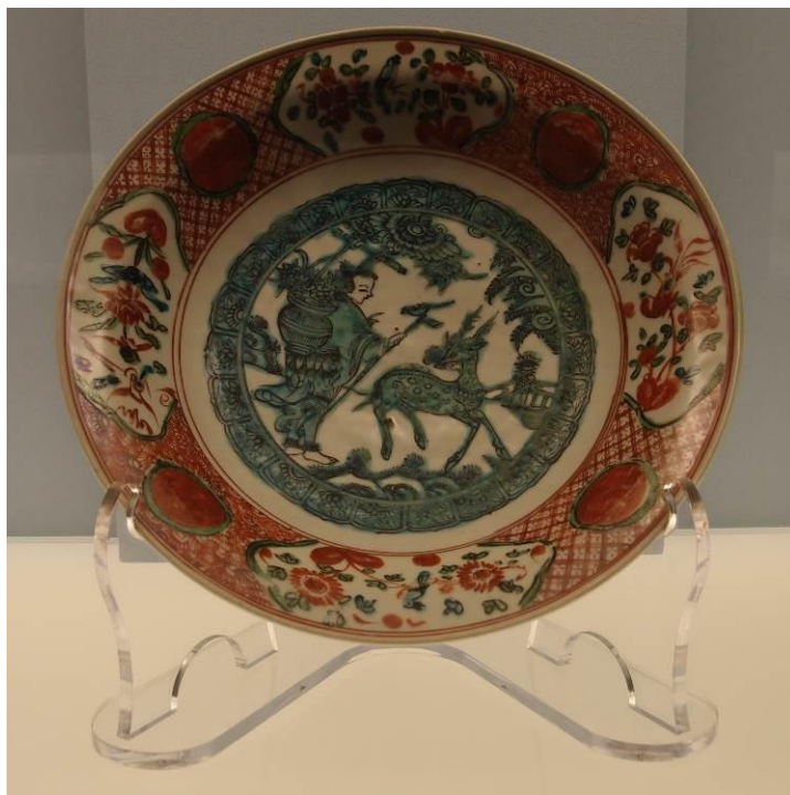
圖十八 明晚期 五彩仙人圖盤 上海博物館藏 2015年11月30日