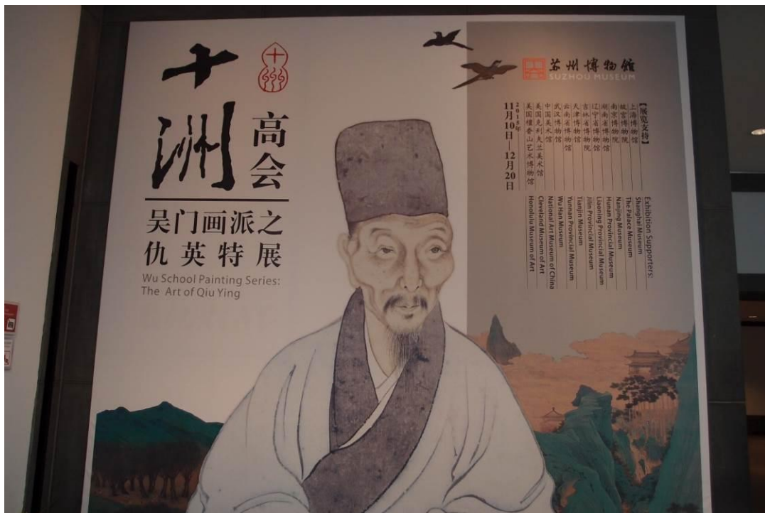
圖二 蘇州博物館「十洲高會—吳門畫派之仇英特展」 2015年11月27日