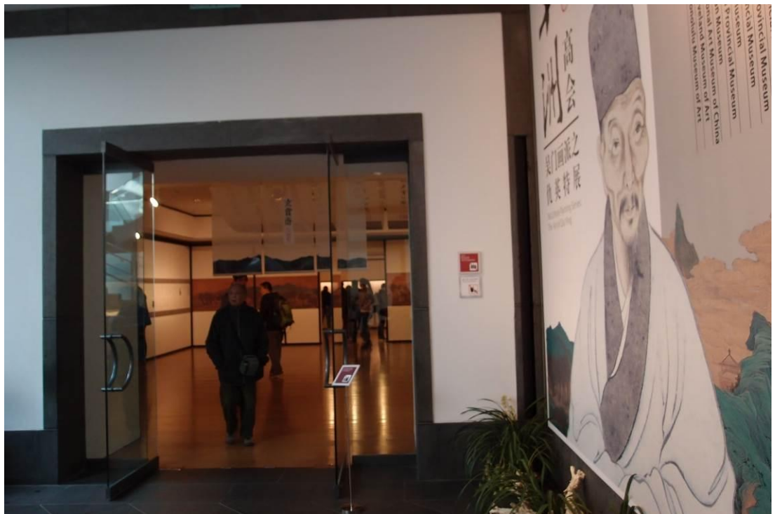
圖四 蘇州博物館「十洲高會—吳門畫派之仇英特展」「玄賞齋」展區