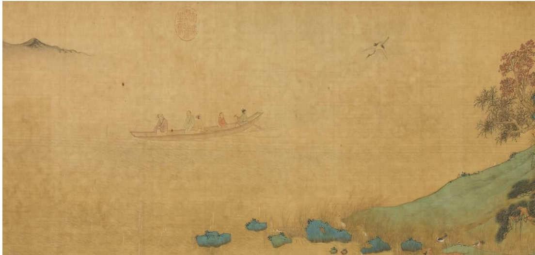
圖九 明 文徵明 仿趙伯驩後赤壁圖 卷 局部 國立故宮博物院藏