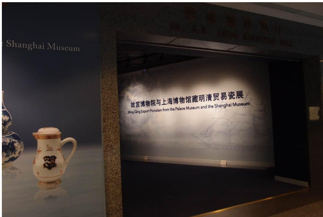
圖十六 上海博物館「故宮博物院與上海博物館藏明清貿易瓷展」展場 2015年11月30日