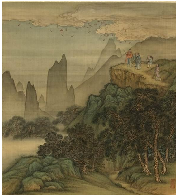
圖十四 清 金玠〈壽同山岳〉第五開〈飛蝠滿天〉 國立故宮博物院藏