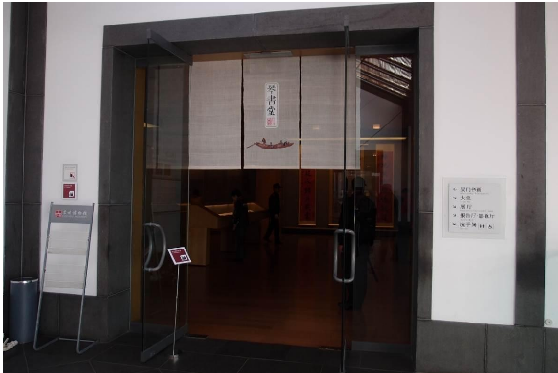
圖五 蘇州博物館「十洲高會—吳門畫派之仇英特展」「琴書堂」展區 2015年11月27日