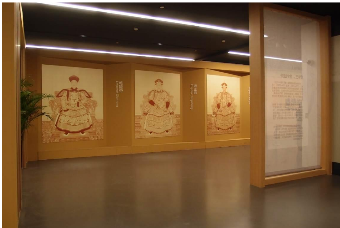
圖十二 龍美術館「盛清的世界—康雍乾宮廷藝術大展」展場 2015年11月29日