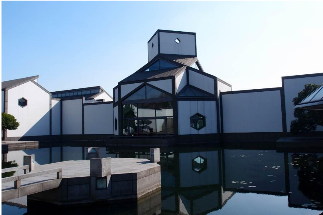
圖一 蘇州博物館 2015年11月27日作者攝