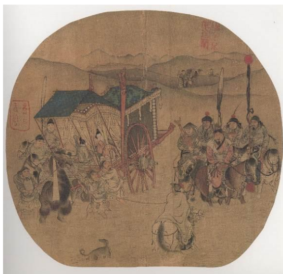
圖八 明 仇英〈臨宋人畫〉冊頁 上海博物館藏 圖片引自《十洲高會》圖錄