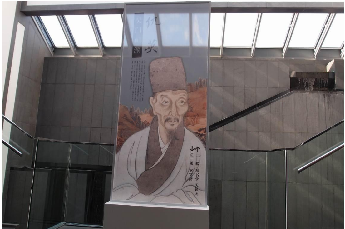
圖三 蘇州博物館「十洲高會—吳門畫派之仇英特展」