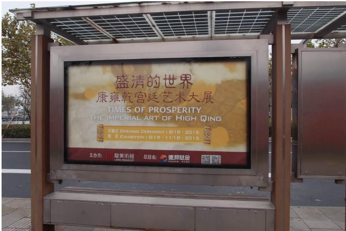
圖十 龍美術館「盛清的世界—康雍乾宮廷藝術大展」 2015年11月29日