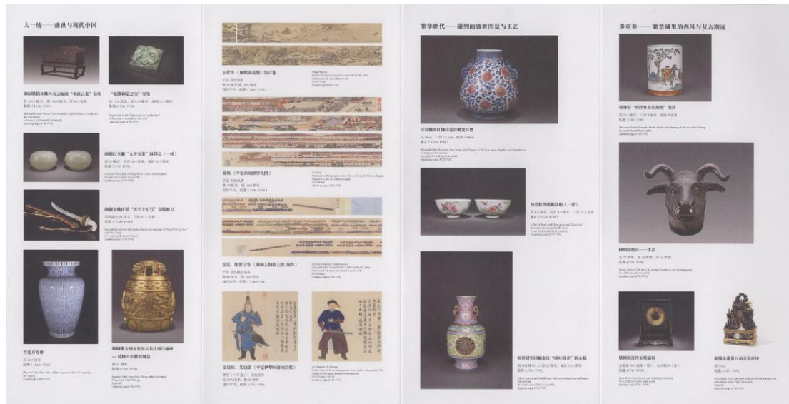
圖十三 龍美術館「盛清的世界—康雍乾宮廷藝術大展」展場摺頁