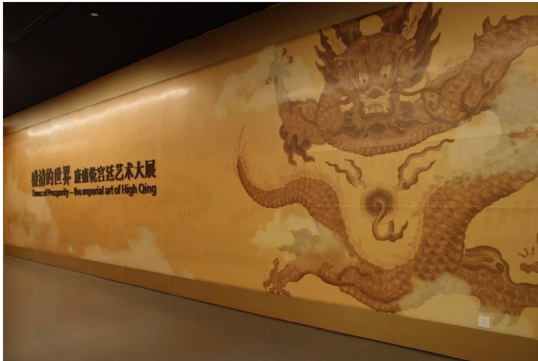
圖十一 龍美術館「盛清的世界—康雍乾宮廷藝術大展」 2015年11月29日作者攝