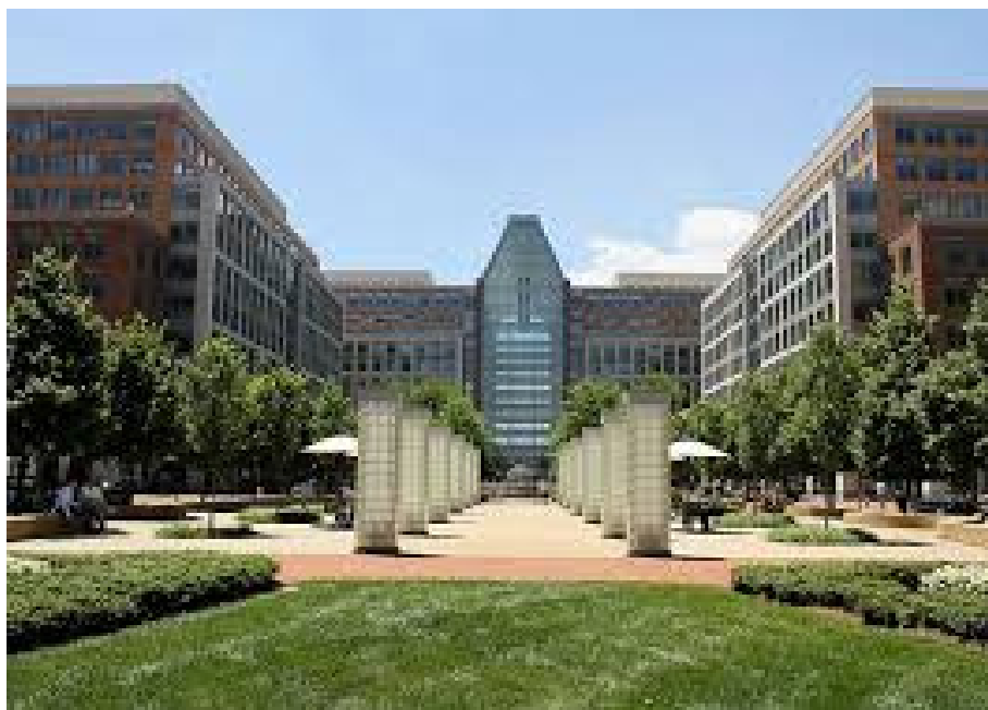
圖 11 美國專利及商標局

美國國會立法設置 USPTO 代表政府核發專利。自 1802 年起，專利局即屬特殊的政府單位，當時國務院設置一位獨立專利長官(Superintendent of Patents)負責掌管專利事務。至 1836 年制定專利法修正案，對專利局進行改組，任命主管專利局官員為專利局長。專利局一直隸屬於國務院管轄，直到 1849 年才改隸屬於內政部。至 1925 年專利局又再度改隸屬於商務部迄今，並於 1975 年將專利局改名為專利商標局。