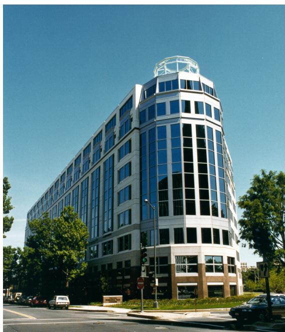
圖 13 美國國際貿易委員會

組織架構及其職責：委員 6 人，由總統提名，經參議院同意後任命之；每一黨派最多三人，一任九年，通常不得連任。且為保持 ITC 之政治中立，其主席必須每兩年由不同黨派登任。