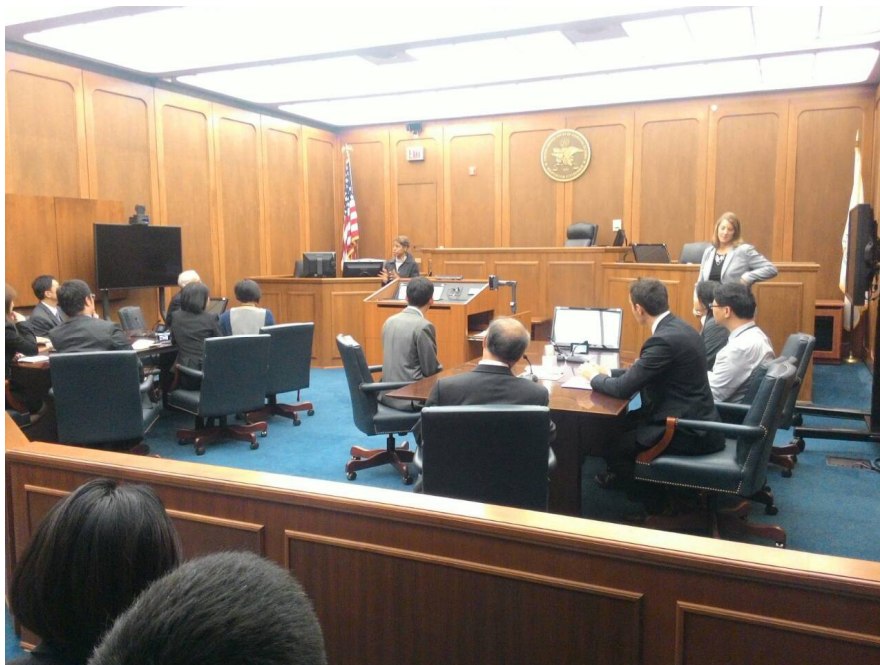
圖 15 美國美國聯邦賠償法院院長介紹該院運作實務

此外，美國並有以專業事務分配之司法管轄權的法院，如美國稅務法院、美國國際貿易法院、美國聯邦賠償法院、美國國外情報偵蒐法院及美國破產法院。本次就參訪美國聯邦賠償法院（United States Court of Federal Claims）