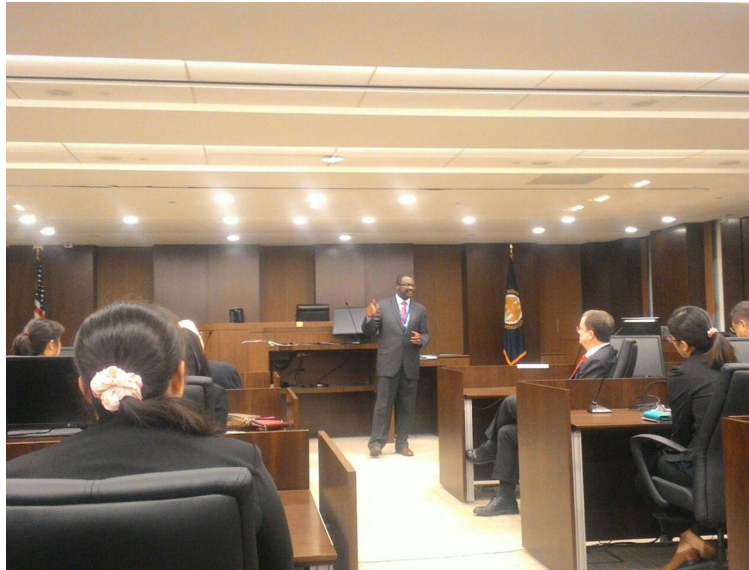
圖 14 ITC 法官介紹 ITC 運作實務