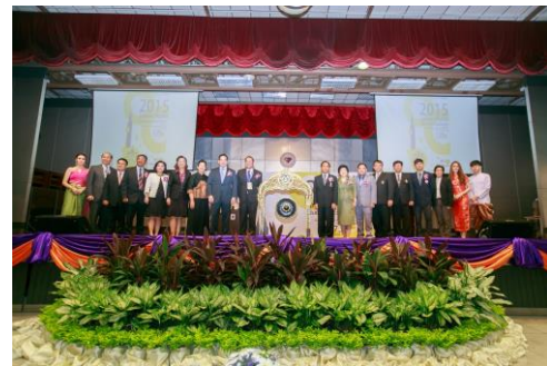
▲泰國高等教育展大合照