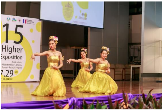
▲泰國高等教育展表演節目