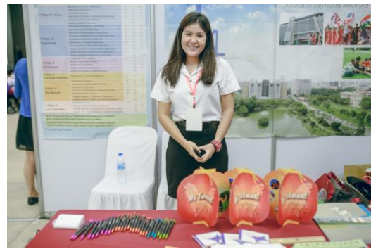
▲泰國高等教育展本校參展翻譯人員