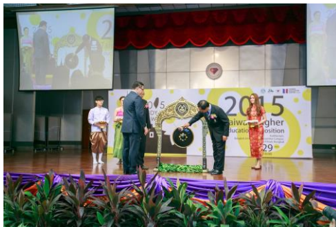
▲泰國高等教育展開展儀式