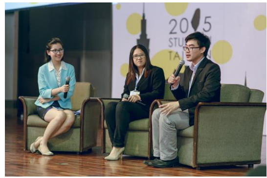
▲泰國高等教育展留臺泰生經驗分享