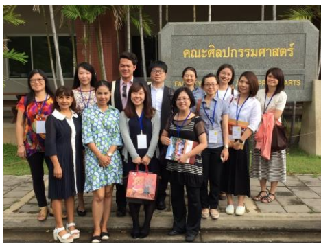
▲法政大學校園導覽合影