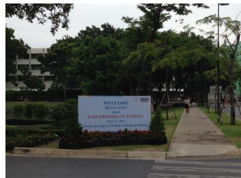
▲曼谷大學內歡迎告示牌