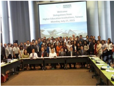
▲拜訪曼谷大學與會人員合影