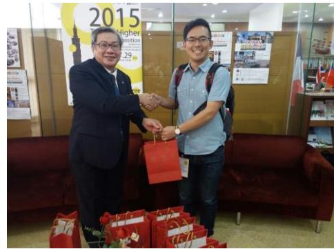
▲暹羅大學校長回禮合照