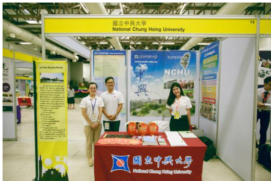
▲泰國高等教育展本校參展人員