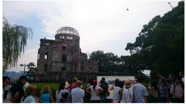
參訪廣島原爆遺跡