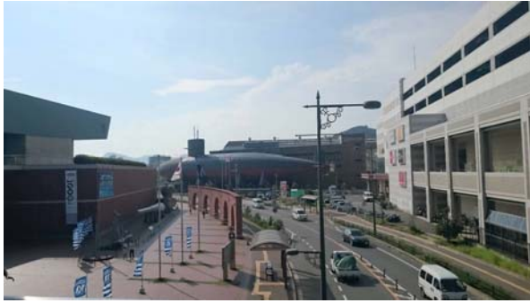
參訪吳市大和博物館