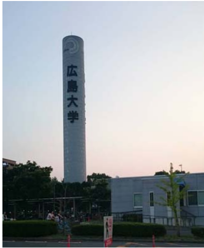
廣島大學校園一景