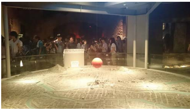
參訪廣島平和紀念資料館