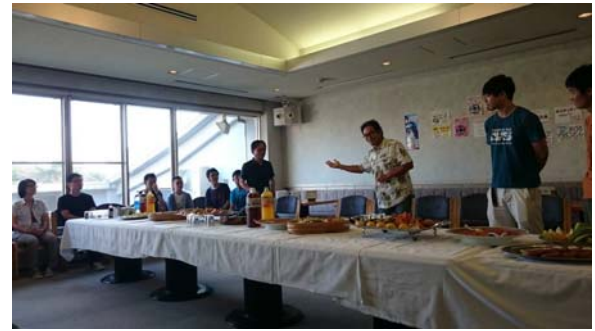
廣島大學舉行的歡迎會