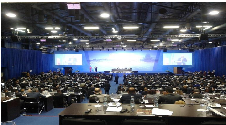
(上圖為 CoSP 第 6 屆會議會場照片)