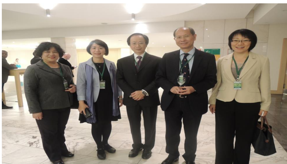
(上圖右三為香港律政司刑事檢控專員楊家雄、右二為副刑事檢控專員沈仲平)