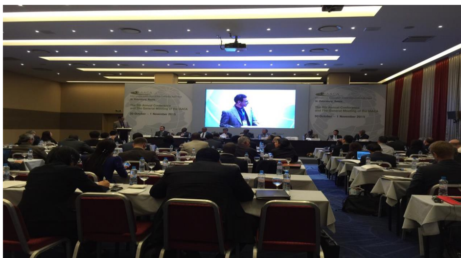
(上圖 IAACA 第 8 屆年會會議情形、下圖為我代表團成員)