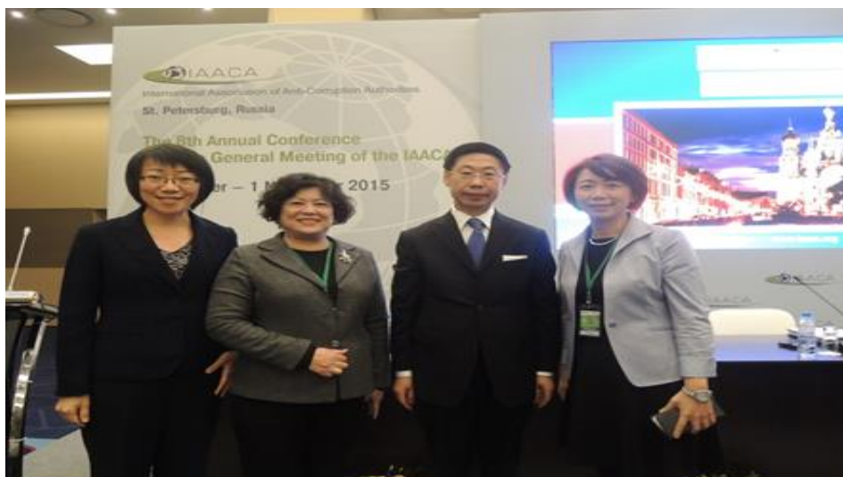
(上圖為我代表團《下同》與 IAACA 秘書長葉峰合影)