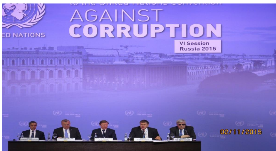
(上圖為 CoSP 第 6 屆會議開幕式貴賓致辭)