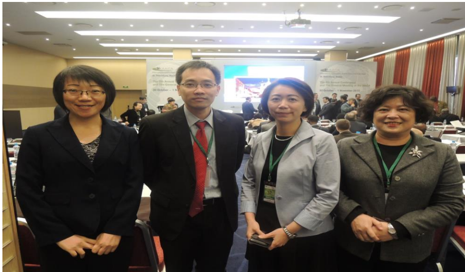
(上圖左二為新加坡貪污調查局局長黃宏冠)