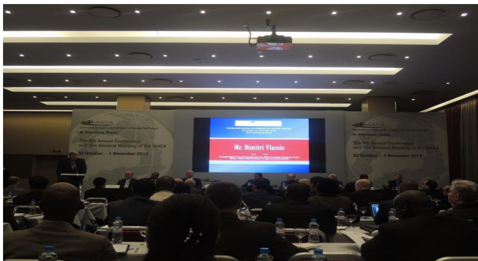
(上圖為 IAACA 第 8 屆年會開幕式貴賓致辭)