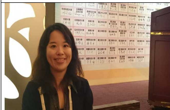
圖 11: 香港教育展合作意向書簽約典禮