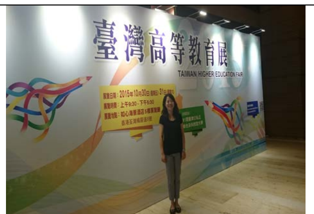
圖 12: 香港教育展宣傳看板