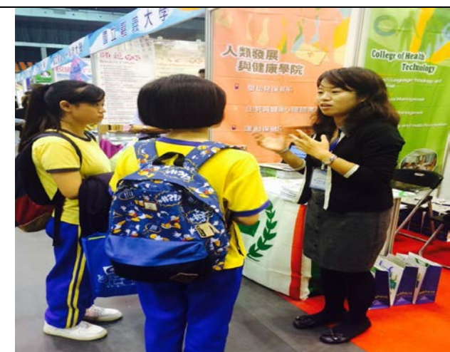
圖 4：與澳門學生解說本校入學管道