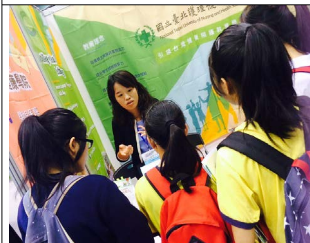
圖 3：與澳門學生解說本校課程