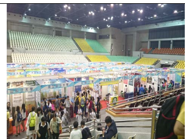
圖 6：澳門教育展活動盛況