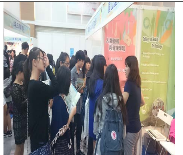
圖 10: 與香港學生說明本校特色