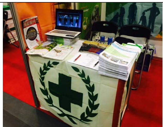
圖 2：本校教育展攤位佈置