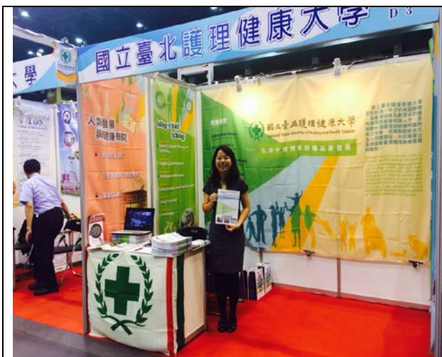
圖 1：澳門教育展攤位