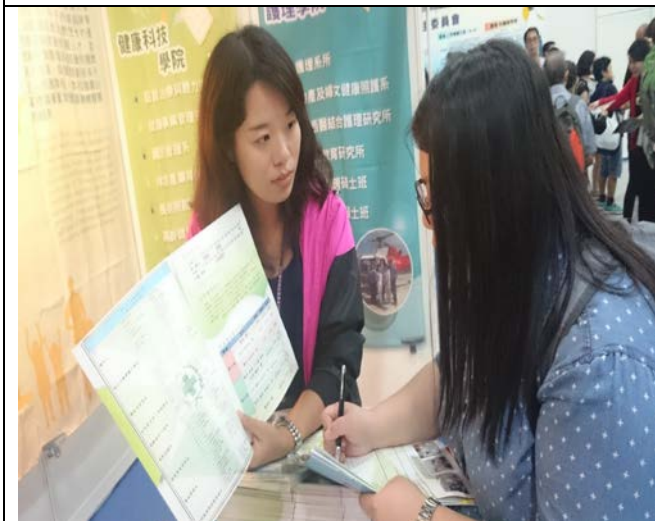
圖 9: 與香港學生解說本校課程