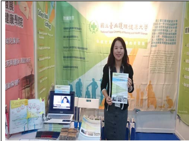
圖 7: 香港教育展攤位