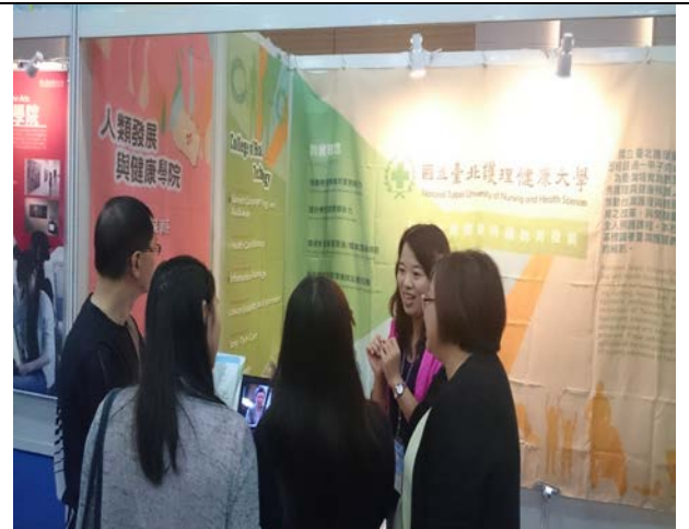
圖 8: 與香港學生家長宣傳本校教育理念