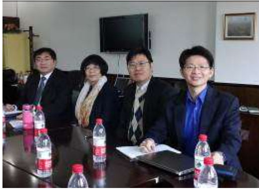
與研討會其他教授合影