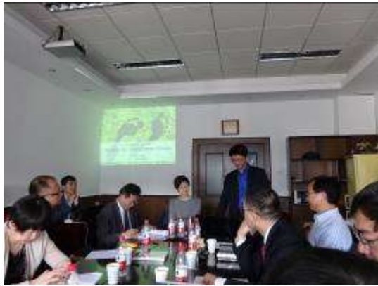
與研討會教授交流