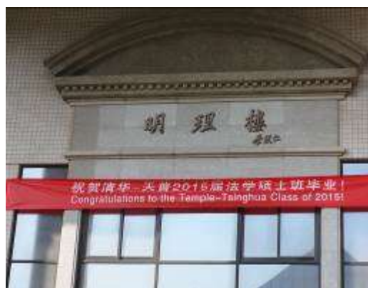
研討會地點：明理樓